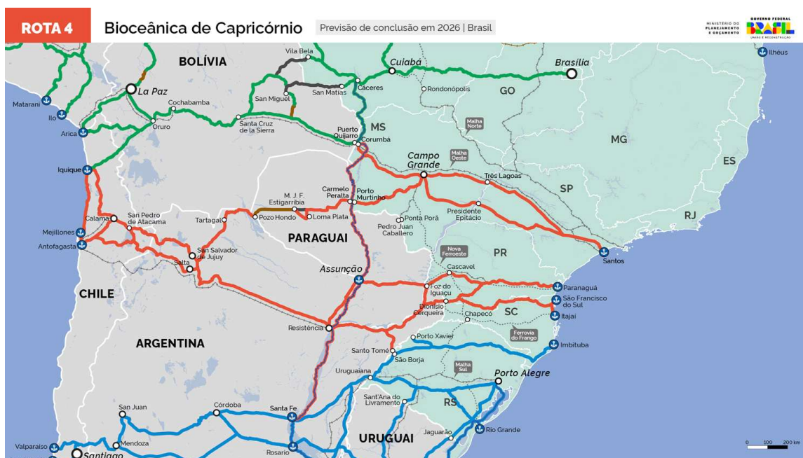
Figura 3 – Rota Bioceânica de Capricórnio 37