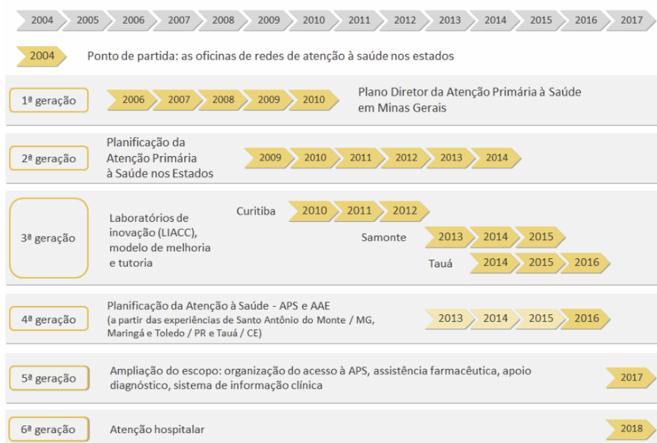
Figura 1 – Linha do tempo da Planificação da Atenção à Saúde

O projeto de Planificação da Atenção à Saúde (PAS) foi desenvolvido inicialmente como uma estratégia para a organização da APS e a implementação das redes de atenção, reconhecendo que a efetividade, eficiência e qualidade das RAS não podem ser concebidas sem uma APS devidamente estruturada (Lins, 2020). Assim, a fim de compreender os principais marcos e facilitar a compreensão da evolução do processo, no qual houve uma significativa busca de aprimoramento contínuo, a Figura 1 apresenta as diversas gerações da planificação iniciadas no ano de 2004 até 2018: