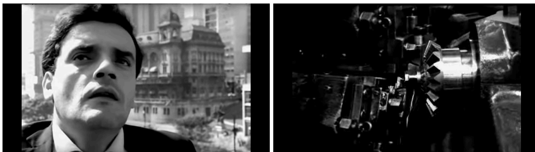
39 - DEVANEIOS E CRISE DE CARLOS (0:43:54 – 0:44:33)