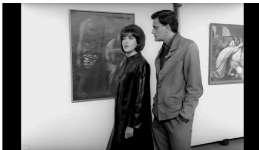
19 - A GALERIA DE ARTE (0:24:26 – 0:26:07)

Hilda é uma personagem que parece canalizar boa parte dos devaneios existenciais de Carlos. Tinha fortes inspirações pelas artes, representava uma liberdade sexual, mas sobretudo intelectual. Ao contracenar com Carlos, ela o mobilizava de forma enigmática. Isto fica nítido na cena da visita à galeria de arte e do seu leito de morte.