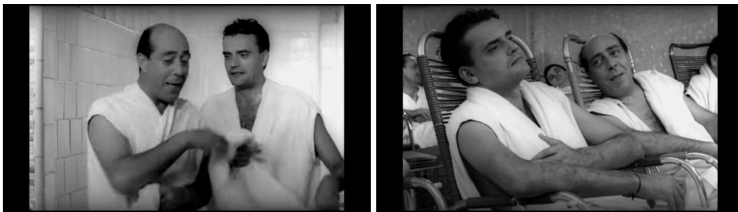
64 - SAUNA - (1:20:36 – 1:24:47)

Após seu último encontro com Hilda, um dia conturbado na fábrica e o retorno de Ana, Carlos vai à sauna com Arturo. Há uma atmosfera quase paterna onde Arturo conduz a conversa e Carlos apenas ouve e responde ocasionalmente. Entre eles há um constrangimento mais recreativo. Arturo brinca com malícia nos assuntos como infidelidade e corrupção. Entre deboches e conselhos, relatos de vida e provocações.