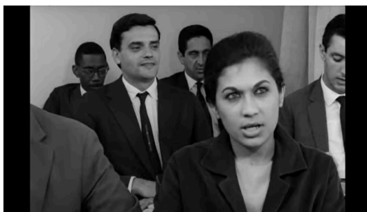
12 - AULA DE INGLÊS (0:12:24 – 0:13:36)

Nas imagens há uma divisão racial do espaço. Os transeuntes são mais diversos do que o elenco profissional. Os trens lotados são mais “miscigenados” do que as fábricas. No Brasil, essa divisão se dá entre periferia e centro, mas também entre o campo e a cidade, dado que o êxodo rural é uma das marcas da industrialização. Daí, parte do anonimato das multidões da metrópole.