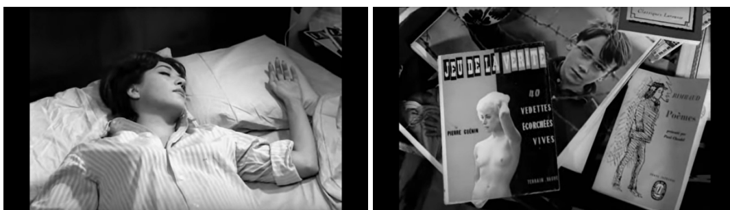
17 - O LEITO DE MORTE DE HILDA (0:21:03 – 0:23:11)

A cena é ambientada dentro do Museu de Arte Moderna e na exposição há referências a Lasar Segall, artista que soube, diz Hilda “expressar melhor os horrores da guerra” nas suas pinturas. Carlos não compreende as obras de arte – “puxa, então você não conhece nada”, diz Hilda. Após a visita, Carlos volta a falar da guerra e faz uma menção sobre os Pracinhas e os paulistas na Revolução de 1930 . Em resposta ríspida à Hilda e crítica às obras de arte, Carlos diz: “Pelo menos eu não digo que um cara sabe expressar melhor os horrores da guerra se eu nunca tomei parte em nenhuma”. Carlos sabe que houve a guerra, mas “não tomou parte em uma” o que o coloca como espectador apenas, revelando um sentimento de impotência. Ao mesmo tempo, ele critica a fala de Hilda que, embora conheça mais sobre arte, sabe tão pouco quanto ele sobre a guerra.