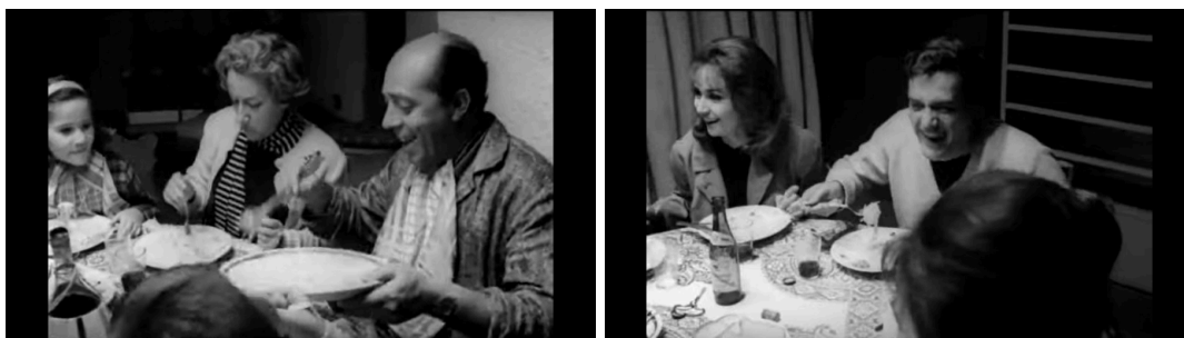
56 - JANTAR EM FAMÍLIA (1:09:17 – 1:10:50)

Neste sentido, já na fuga final, quando Carlos diz que vai embora, ele sente uma espécie de “redenção” por estar sendo pelo menos honesto e franco. Deste modo, a masculinidade hegemônica procurará um tipo de racionalidade que tenta legitimar suas ações. O abandono familiar é uma narrativa recorrente da masculinidade. Em outro momento após o casamento, Carlos diz a Luciana sobre “seu filho” ao invés de “meu” ou “nosso filho”. A escolha de palavras revela seu sentimento em relação à paternidade.