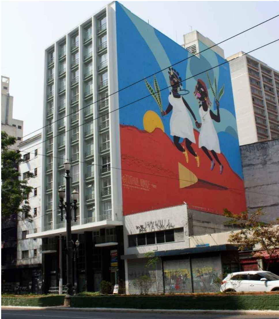
Figura 2 - Grafite retratando os ibejis, gêmeos sagrados da tradição iorubá

GONÇALVES, Fábio (@tutano_nomade). Grafite retratando os ibejis, gêmeos sagrados da tradição iorubá. Local: Av. Ipiranga, 890 - República, São Paulo - SP, 2021.