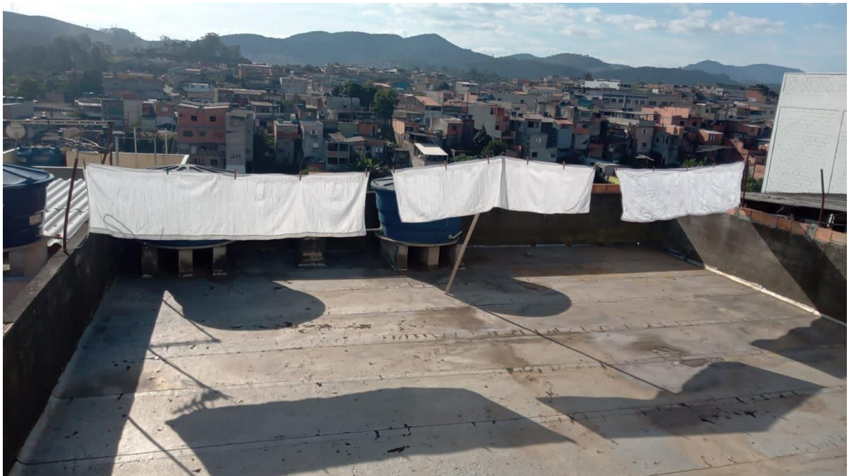
Figura 3 - Saiotes na laje.

Para ilustrar essa complexa intersecção entre tradição cultural e realidade periférica, compartilho uma imagem de meu acervo pessoal, tirada na laje da casa de Mãe Maria, Ajibonã do Ilê, uma senhora de 81 anos de idade. Na foto aparecem os saiotes engomados pendurados no varal, com o pano de fundo revelando o morro e a paisagem da periferia. Estes saiotes são peças essenciais utilizadas nas festas de candomblé, não apenas para dar volume às saias das mulheres, mas também como símbolo do cuidado, capricho e vaidade presentes dentro do candomblé.