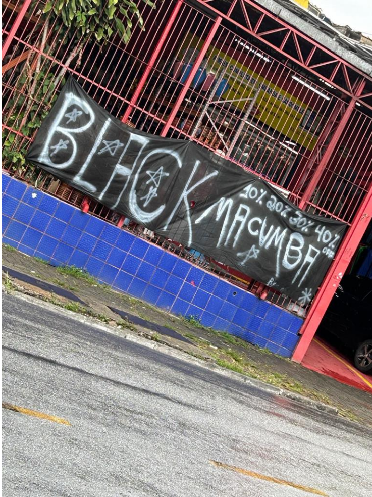
Figura 4 - “Black Macumba” em Itaquera.

Orixás São Jorge”, em alusão à Black Friday, é uma manifestação da criatividade da comunidade do candomblé.