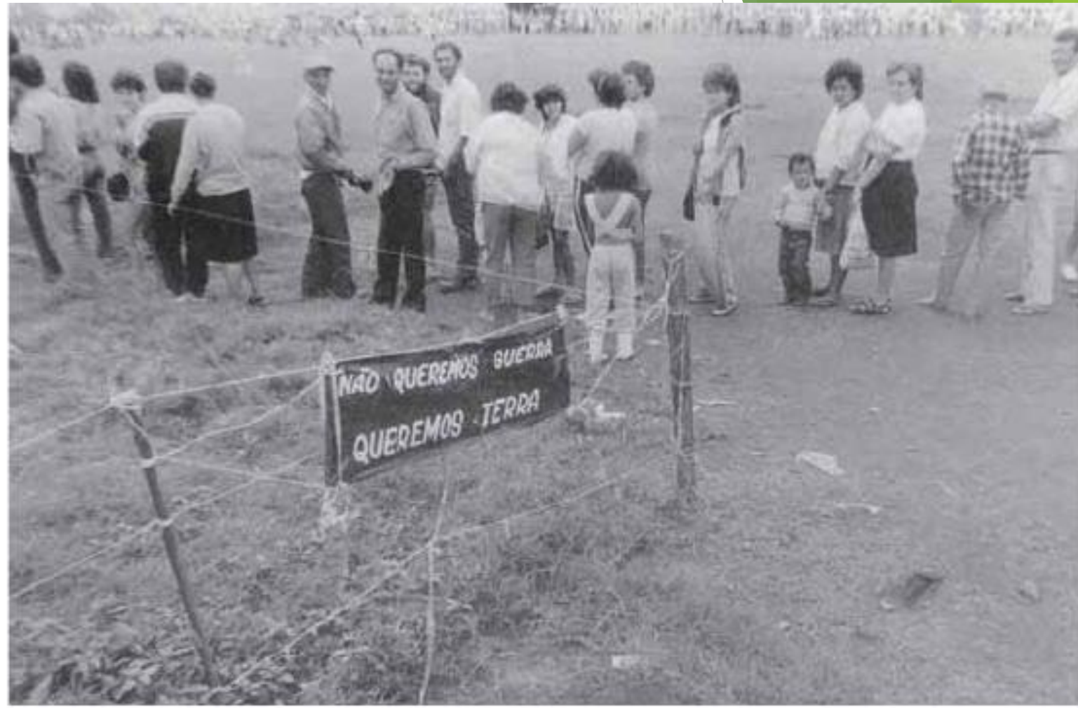
MANIFESTACIONES PRO MORADIA. SÃO PAULO. ANOS 80

O tempo continua encoberto hoje, com nuvens baixas e chuva leve. A temperatura está em torno de 20 graus Celsius. O vento é fraco e a visibilidade é boa. O tempo é adequado para uma caminhada leve, mas não é ideal para atividades ao ar livre. O tempo continua encoberto hoje, com nuvens baixas e chuva leve.