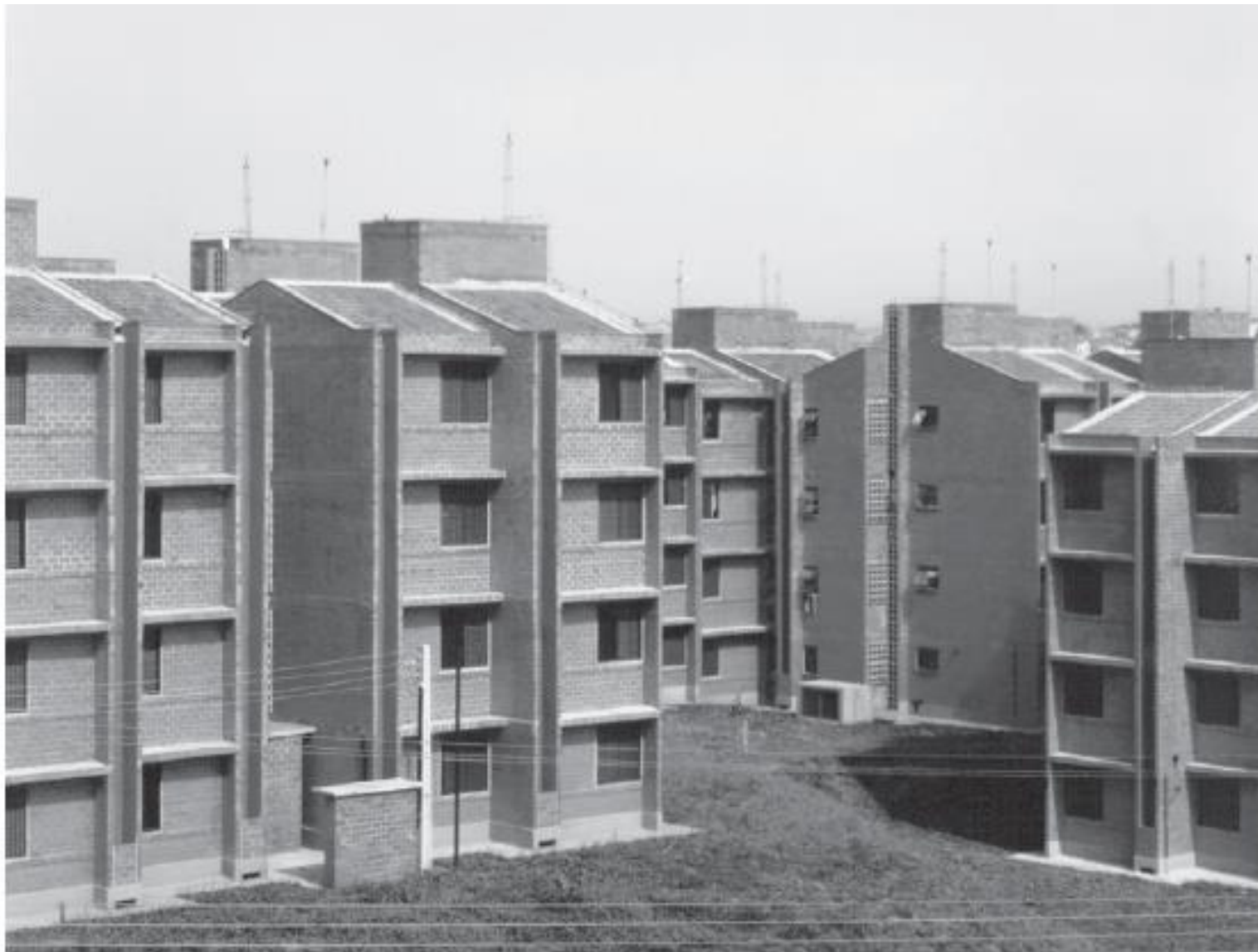
Conjunto habitacional União da Juta, em São Mateus, São Paulo (Usina).