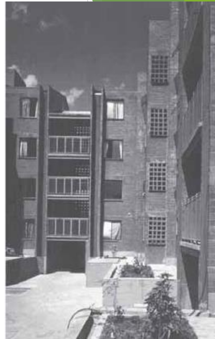
Panaderia comunitaria del conjunto.