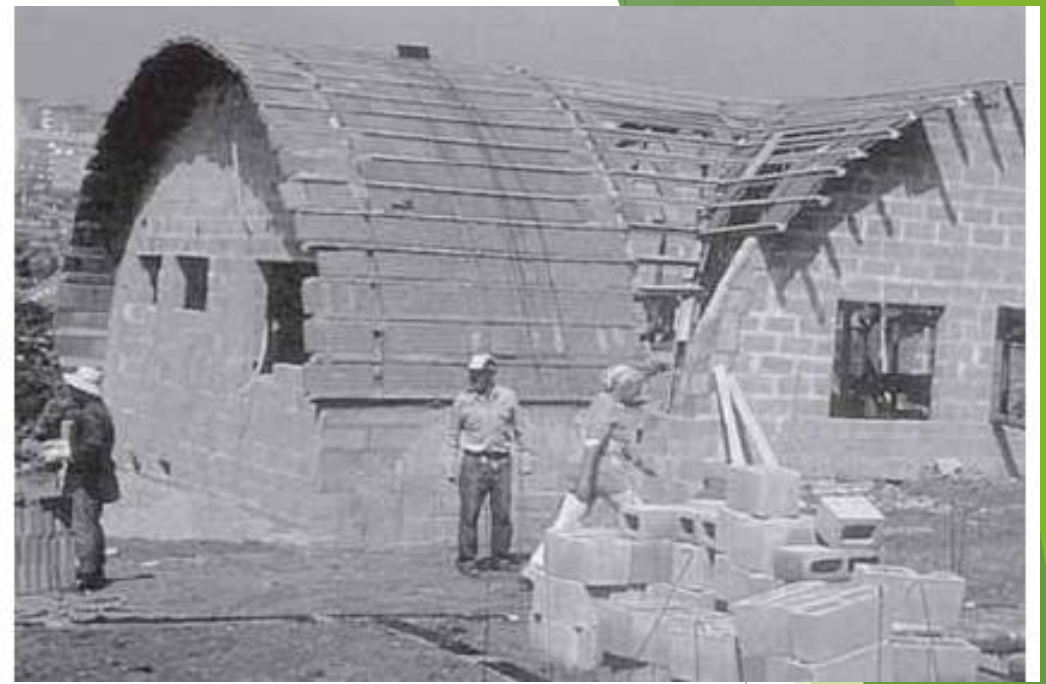
Centro comunitário Pôr-do-Sol (Oficina de Habitação)