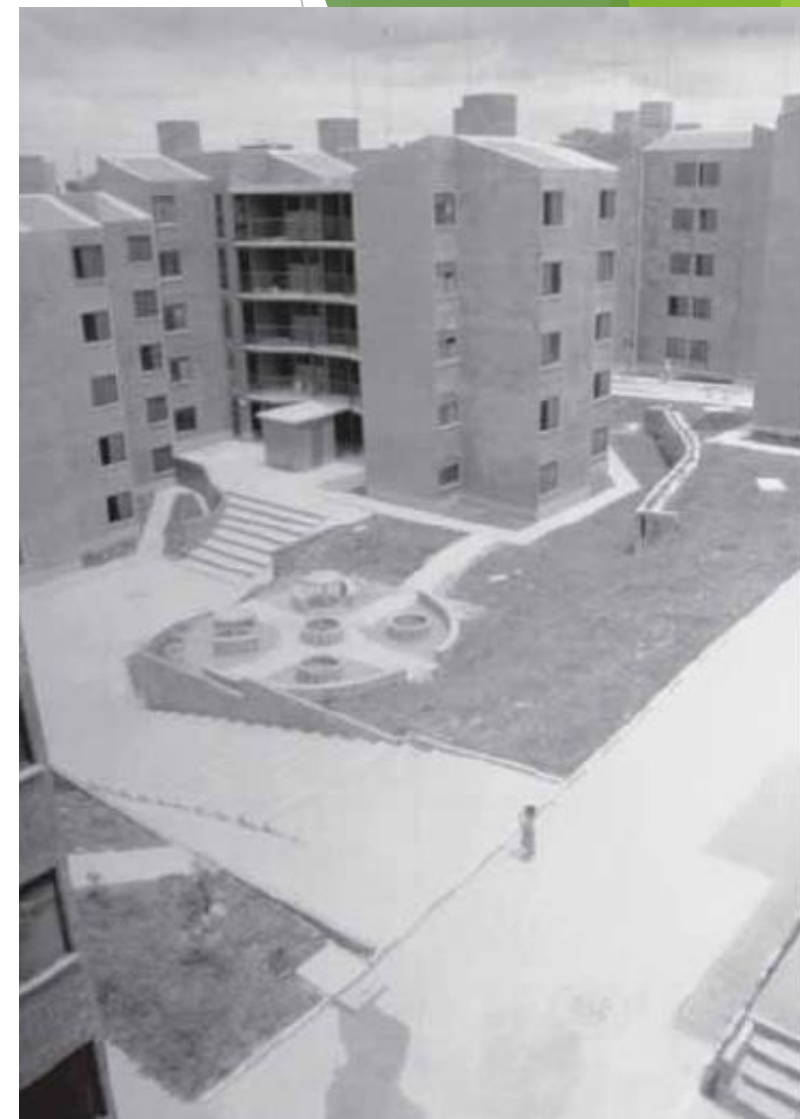
Vistas do conjunto da Associação Pró-Moradia de Osasco, Copromo