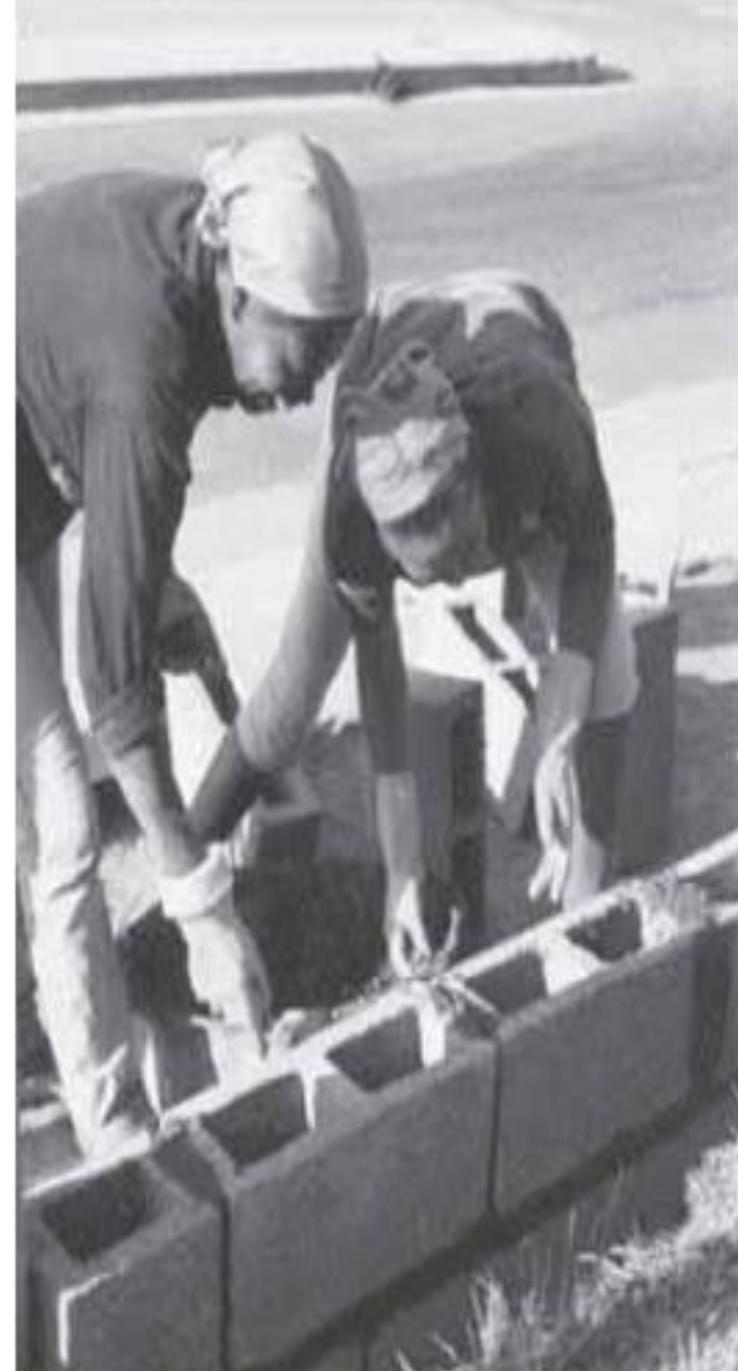
GRUPOS DE MUTIRÃO. SÃO PAULO. AÑOS 80