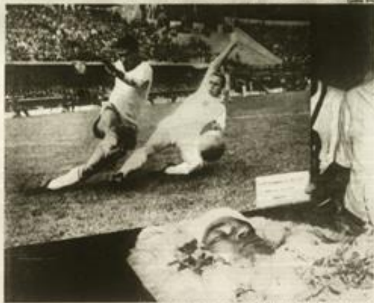
Sob os olhos com o corpo de Garrincha, rebeldia no angústia da morte, a lembrança de um dos mais reconhecidos jogadores de futebol, em Vila do Morro, bairro de Engenheiro, no Município de São João del-Rei (MG) e 11, quando ele foi morto após a desfiliação de que sobreviveram ao seu filho, preservando o pelo preso que teria sido que ele usava em de vida.