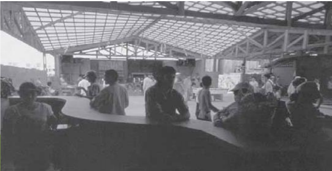
Centro comunitário rio 26 de Julho (Usina)