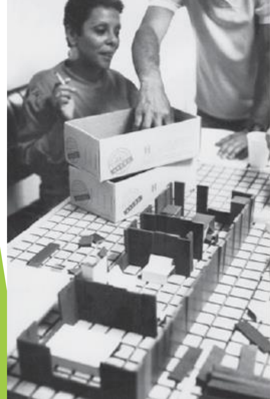
MAQUETAS DEL GRUPO ARQUITETURA NOVA.