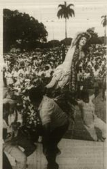
4 imagens de S. Sebastião completam o cortejo com 4000 pessoas e que foi ao ar quando um fiel torcedor, ao fim da procissão, no Brasil. Outros devotos acudiram. (Pág. 13)

Garrincha está enterrado, mas não se esqueça, no cemitério de São João del-Rei (MG) em São João del-Rei, onde seu corpo foi sepultado em 1983. O jogador de futebol nasceu em 1933, em São João del-Rei, Minas Gerais. Ele foi um dos jogadores mais populares do Brasil, conhecido por sua habilidade com o pé direito e sua capacidade de driblar os jogadores adversários. Garrincha morreu em 1983, aos 50 anos, devido a um acidente de trânsito. Sua morte foi um grande choque para o povo brasileiro, especialmente para os torcedores de futebol. Sua família e os fãs de futebol estão se reunindo em São João del-Rei para celebrar sua vida e lembrar de suas conquistas no campo.