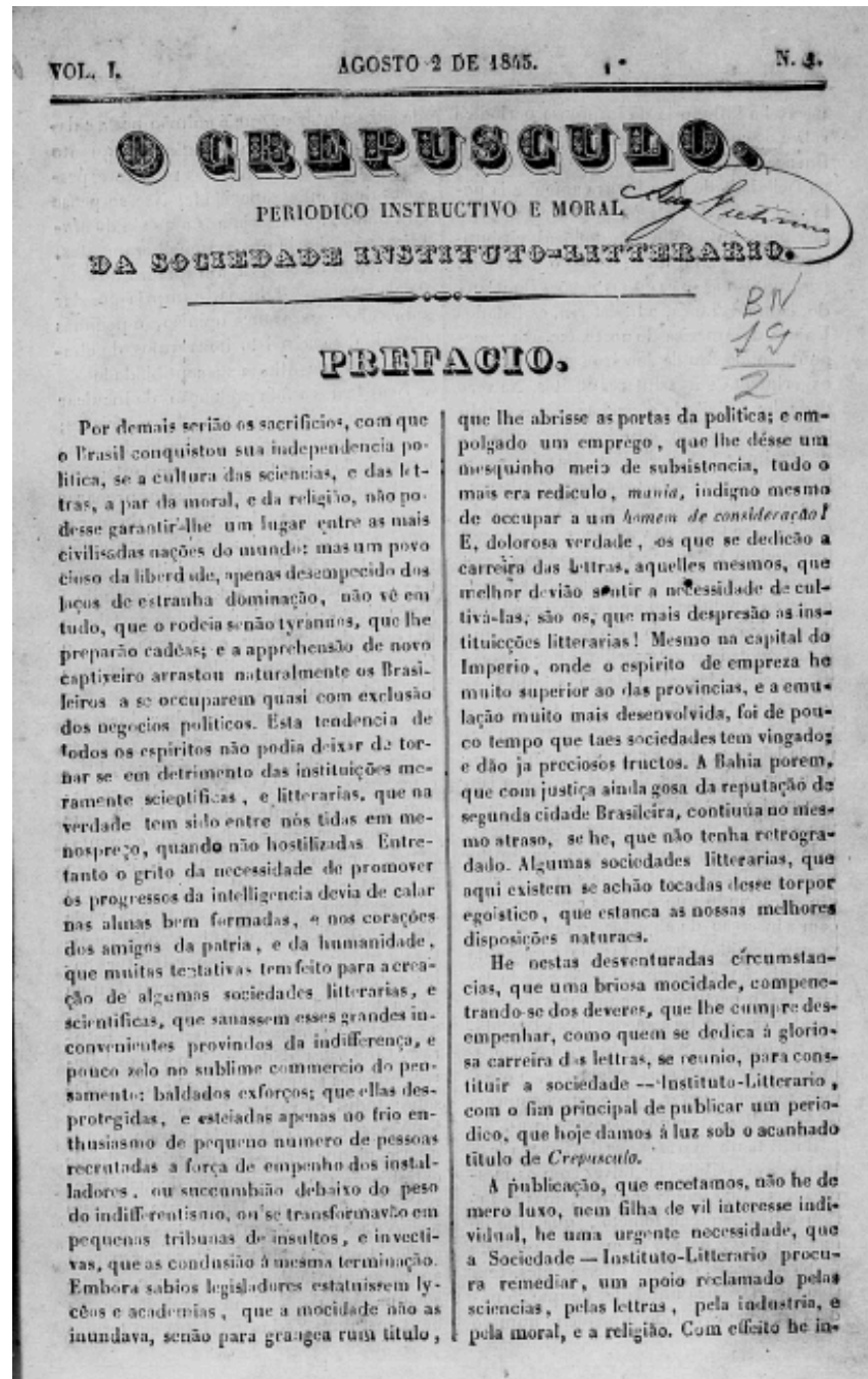
Figura 1: O Crepúsculo, Volume I, edição 1, 1845.

O ano de 1845 marca o início das atividades do periódico e define o tom de sua proposta intelectual. A primeira edição, de 2 de agosto, apresenta textos de caráter científico, literário e moral: “Phrenologia” e “Ecologia” abrem a edição com discussões sobre as faculdades humanas e o estudo da natureza; “A França” e “O Progresso” tratam da educação como via para o desenvolvimento nacional, e o texto “Despedida” encerra o volume com tom sentimental e romântico.