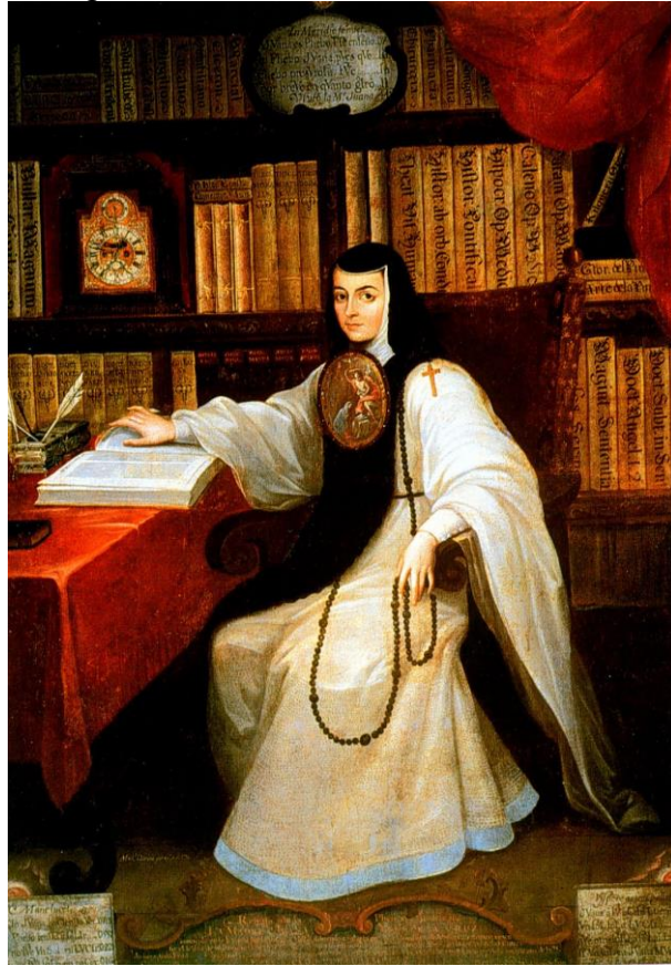
Figura 2 – Sor Juana Inês de la Cruz