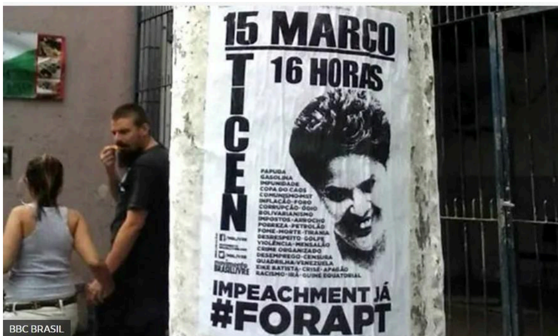
Imagem 2: Chamada para ato pró-impeachment de Dilma Roussef

Depois de ganhar projeção nacional durante eleições, antigovernistas Vem Pra Rua, Revoltados On Line e M intensificaram atuação nas redes e nas ruas às vésperas de protesto marcado para domingo