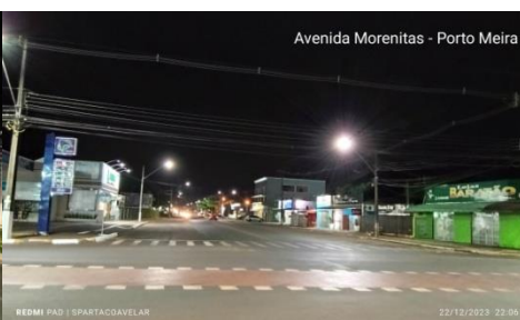
Figura 17 - Av. Morenitas - Porto Meira