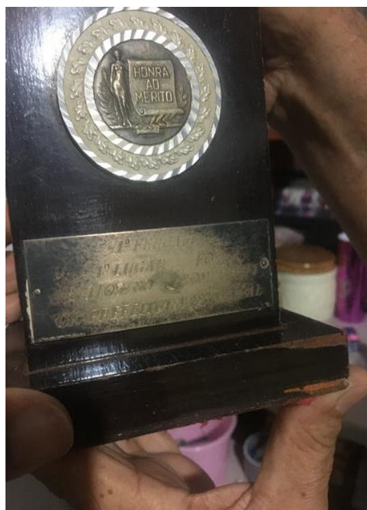
Figura 7 - Troféu do 1º Festival da Canção de Foz do Iguaçu