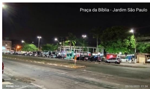
Figura 14 - Praça da Bíblia - Jd. São Paulo