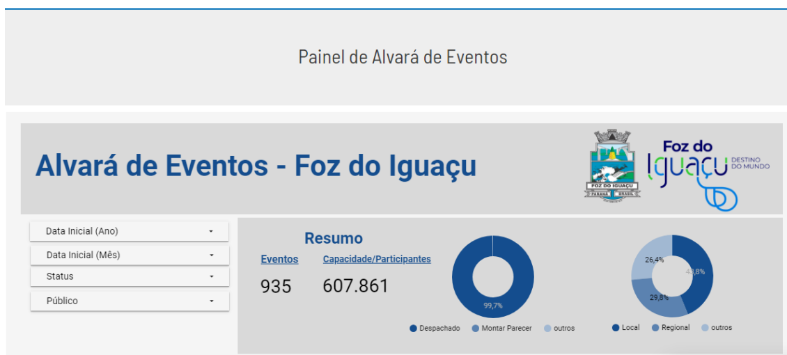
Figura 8 - Painel de Alvará de Eventos