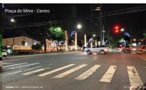
Figura 13 - Praça do Mitre - Centro