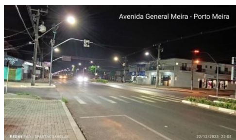
Figura 16 - Av. General Meira - Porto Meira