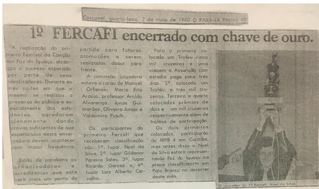
Figura 5