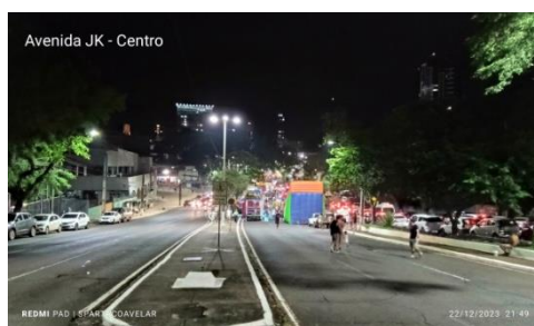
Figura 10 - Avenida JK

Mais um exemplo deste desequilíbrio das políticas públicas relacionadas à cultura na cidade são as festas de final de ano. Enquanto o corredor turístico na área central tem toda uma estrutura montada, alguns bairros de grande concentração populacional sequer tem menção sobre essas festas. Na noite de 22 de dezembro de 2023, eu andei pelas ruas de Foz do Iguaçu e registrei essa movimentação em alguns bairros e no Centro da cidade. Ruas enfeitadas e com estrutura para apresentações culturais no Centro de Foz do Iguaçu (Figuras 10, 11, 12 e 13) e ruas nos bairros apenas com a movimentação habitual do cotidiano e sem enfeites natalinos (Figuras 14, 15, 16 e 17). Os registros foram feitos aproximadamente entre às 21h30min e às 22h.