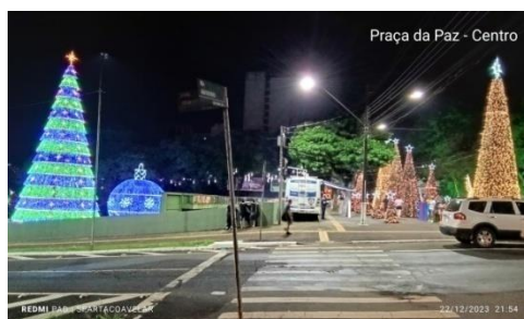
Figura 12 - Praça da Paz - Centro