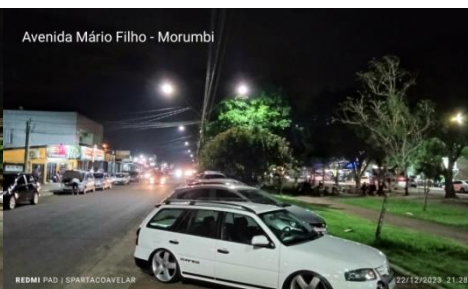
Figura 15 - Av. Mário Filho - Morumbi