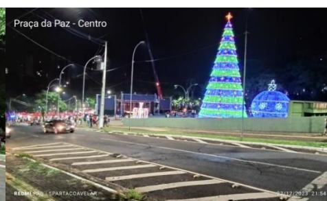
Figura 11 - Praça da Paz - Centro