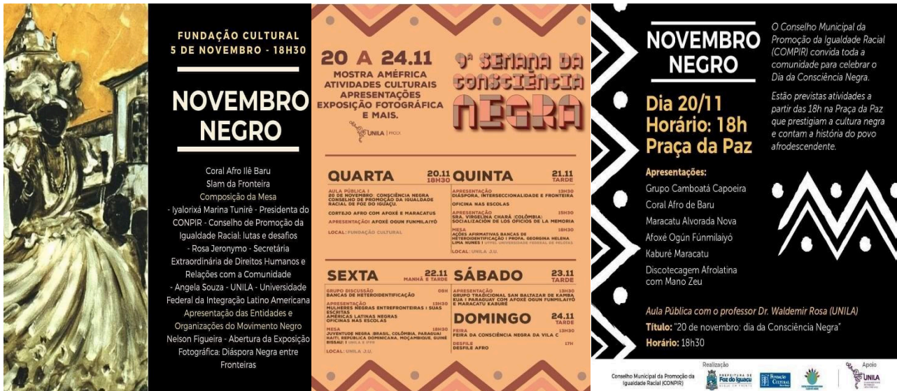
Imagens 3 - cartaz/banner da semana da consciência negra da Unila em 2019:

Outro aspecto que merece destaque são as indicações de obras de autores negros, afro-brasileiros e africanos, principalmente de autores nigerianos, como Chimamanda Adichie. Dessa forma, a rede social do NEALA configura-se como um importante espaço de divulgação e valorização da cultura africana e afrodescendente.