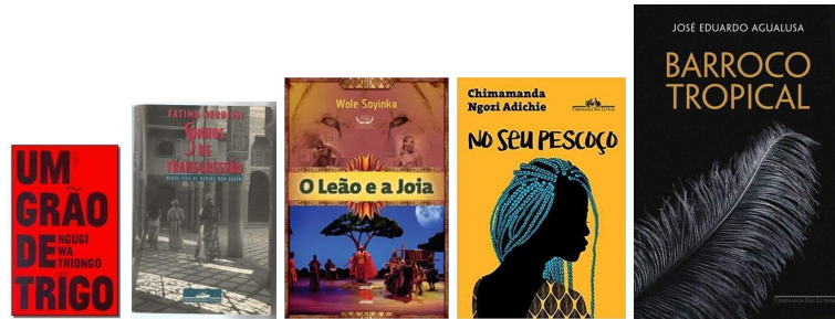
Imagens 2 - cartaz/banner de livros indicados em 2012:

Outro aspecto que merece destaque são as indicações de obras de autores negros, afro-brasileiros e africanos, principalmente de autores nigerianos, como Chimamanda Adichie. Dessa forma, a rede social do NEALA configura-se como um importante espaço de divulgação e valorização da cultura africana e afrodescendente.