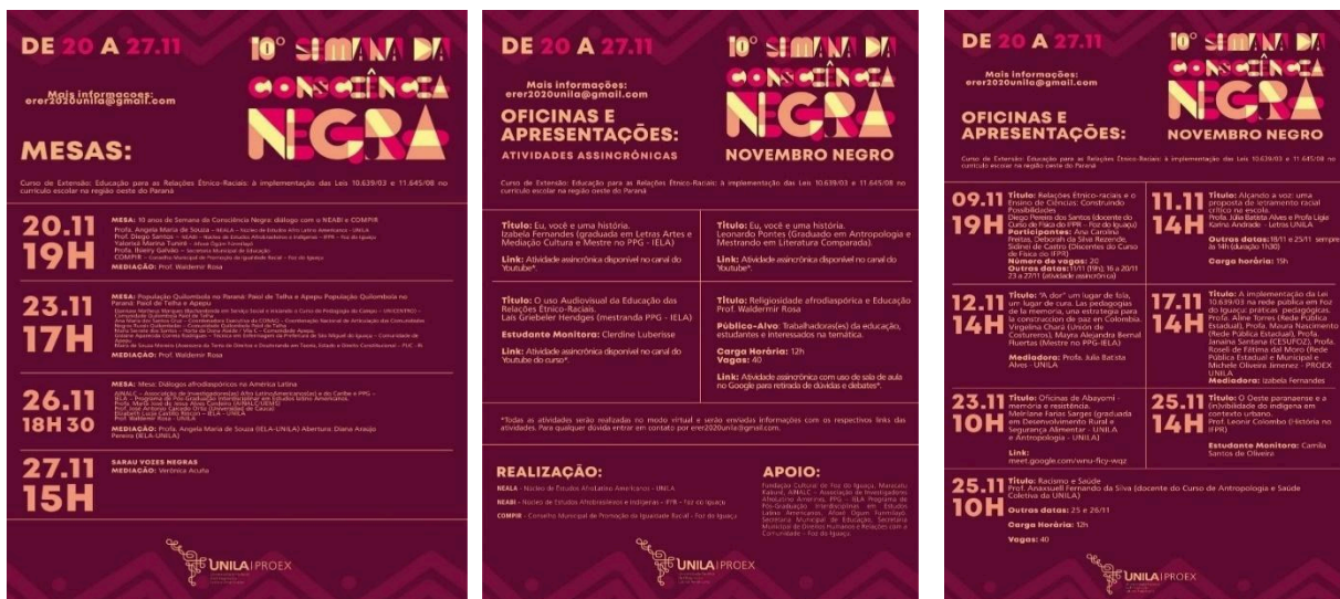
Imagens 4 - cartaz/banner da semana da consciência negra da Unila em 2020 e 2021:

Ano 2020: https://www.facebook.com/ConscienciaNegraUnila?mibextid=ZbWKwL