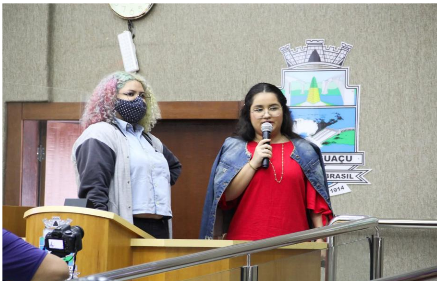
Discursando na Câmara dos Vereadores, atividade do estágio