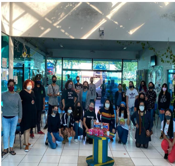
Tá no ciclo pobreza menstrual

questionar pra reivindicar tudo aquilo que é necessário pra viver de forma mais digna (Diário de campo da autora).