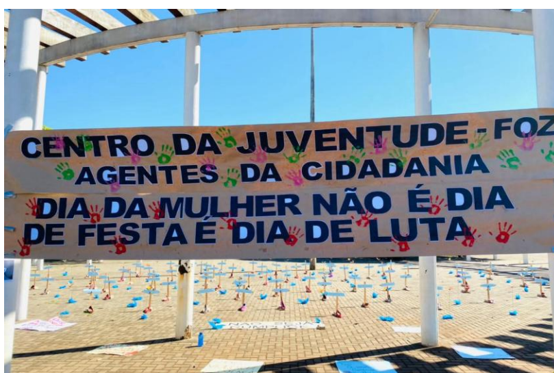
Intervenção do dia da mulher