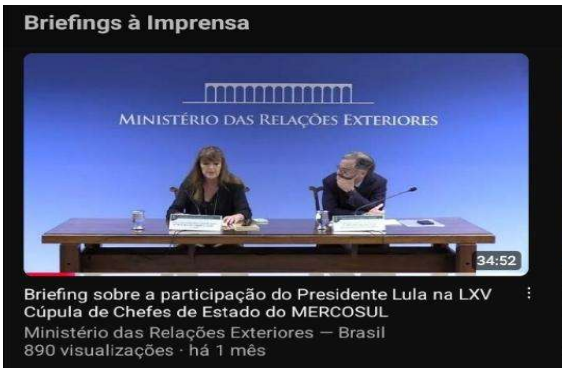
Figura 8- vídeo sobre Briefing da cúpula do Mercosul

Exteriores exemplifica como as plataformas digitais podem ser integradas às estratégias de diplomacia pública, ampliando o alcance e a acessibilidade das informações e reforçando o papel do Brasil como ator global transparente e engajado.