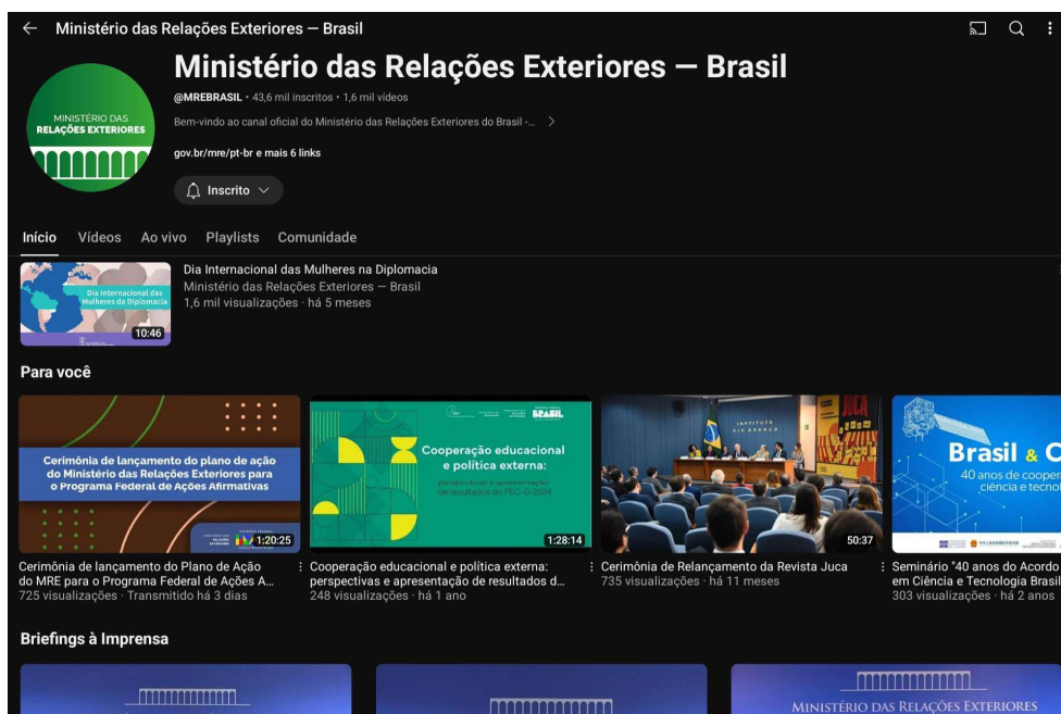
figura 4- perfil do MRE no Youtube

O perfil institucional no Youtube apresenta vídeos que destacam as atividades diplomáticas do Brasil, incluindo discursos, cerimoniais e eventos internacionais. O canal busca informar o público sobre política externa, promovendo transparência e engajamento com questões globais. Além de que é usado para difundir conteúdos culturais e educativos, reforçando o soft Power brasileiro.