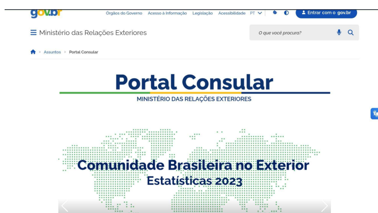
figura 1: Página inicial do Portal Consular do MRE

Assim, a análise do portal consular brasileiro será ilustrada com uma imagem da plataforma, seguida de uma comparação com outras redes digitais utilizadas pelo Ministério das Relações Exteriores, como Instagram e Youtube. O objetivo é compreender como essas plataformas se completam na disseminação de informações e na criação de uma imagem internacional para o Brasil. Para facilitar a visualização e o entendimento dessa integração, serão apresentados exemplos práticos de cada meio e suas funções no contexto da diplomacia pública digital.