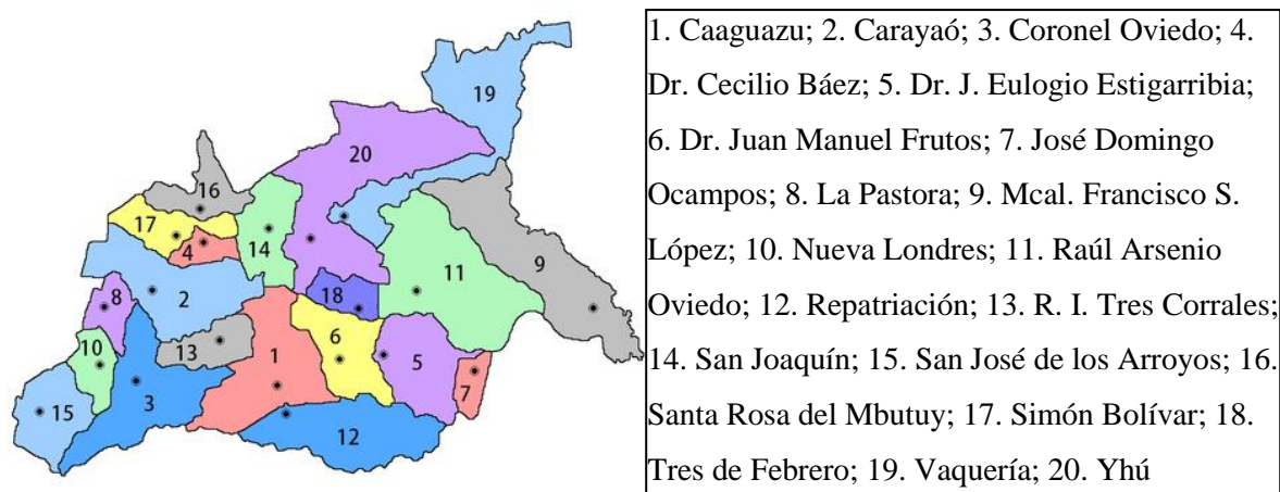
Figura 2: Mapa político del Departamento de Caaguazú (Paraguay)

El distrito Dr. Juan Manuel Frutos está localizado en el centro sur del departamento de Caaguazú. Al respecto, la siguiente figura muestra su ubicación exacta, a través del mapa político del departamento en cuestión.