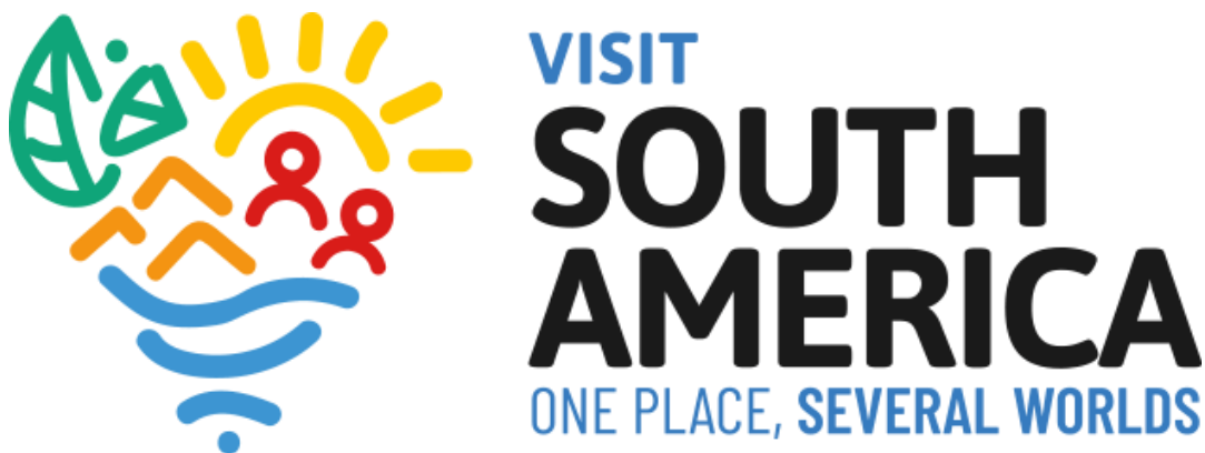
Figura 2 – Logo de la marca Visit South America

Este capítulo, por tanto, establece la base para la discusión de la marca promocional Visit South America , una iniciativa del Mercosur para promover conjuntamente los destinos turísticos de sus países miembros en el ámbito global. (MTur, 2024)