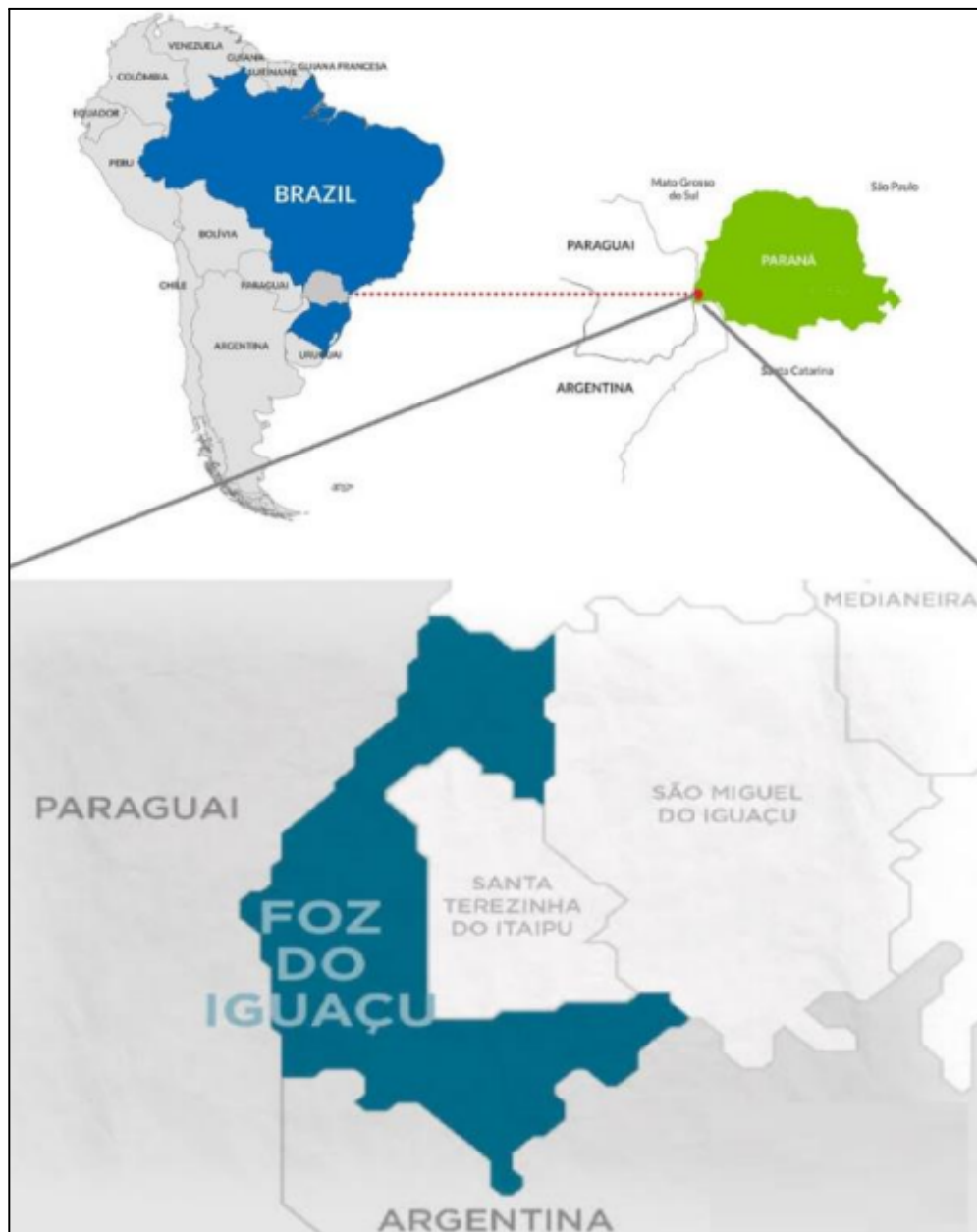
Mapa 1 – Localização do município de Foz do Iguaçu — PR