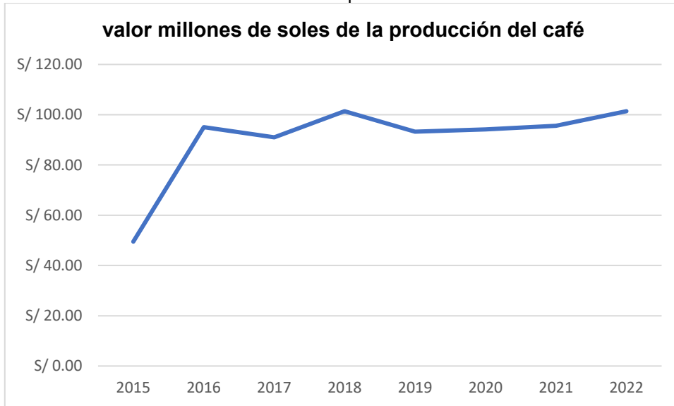
Gráfico 1 - Valor millones de soles de la producción del café

tener un valor total de 490 000.50 soles, mientras que para el 2022 se incrementó a 1 010 000.40 soles, se puede ver una diferencia de 519 999.90 soles, el cual nos indica que si hubo aumento de producción.