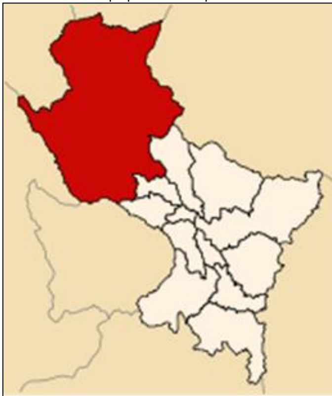
Ilustración 2 - Mapa político de la provincia La Convención

Según la ilustración 1, se puede observar que el Cusco, también conocido como Cuzco, es una ciudad ubicada en el sureste del Perú, en la región andina de los Andes. El departamento de Cusco cuenta con una población de 1,516,729 habitantes, donde el 9.6% representa la población adulta mayor (126,379). Es una de las ciudades más icónicas y visitadas de América del Sur debido a su impresionante historia, su rica cultura y su proximidad a la antigua ciudad inca de Machu Picchu 2023 (INEI, 2023).