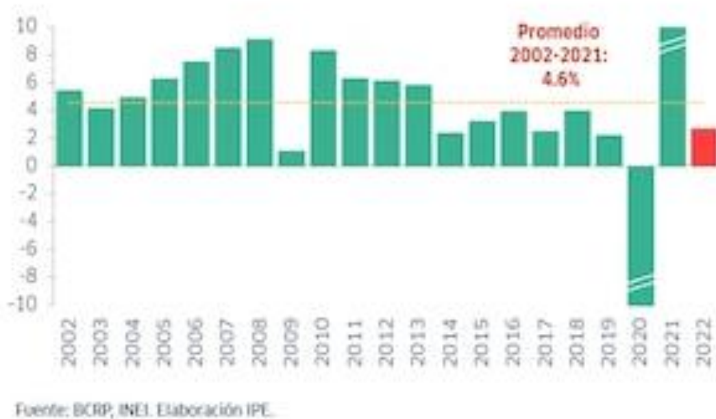
Figura 1. Crecimiento anual del PBI del Perú (2002–2022) (var. % real)

Fuente: Banco Central de Reserva del Perú (BCRP) e Instituto Nacional de Estadística e Informática (INEI). Elaboración: Instituto Peruano de Economía (IPE), 2023.