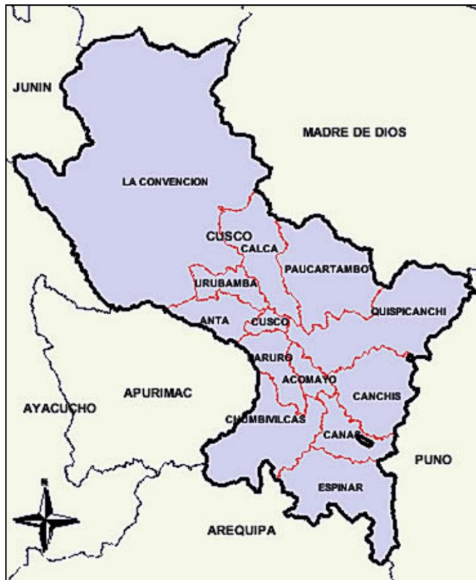
Ilustración 1 - Mapa político de la Región Cusco

A continuación, se presenta la Ilustración 1, que muestra la ubicación política de la provincia de La Convención dentro de la región Cusco, permitiendo identificar su localización geográfica y los límites territoriales con otras provincias y regiones del país.