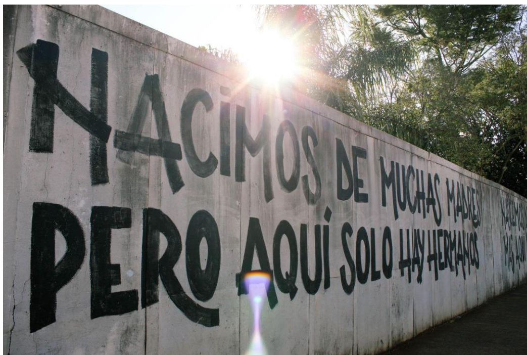
Maria Eduarda Balbinot (1998) fronteira , 2022 Fotografia digital

A tríplice fronteira mais conhecida e singular da América Latina é composta por Brasil, Paraguai e Argentina, um lugar de terras vermelhas e de muita água, faz com que essa região seja conhecida e tenha particularidades que a transformam num substantivo, “A tríplice fronteira”. Essa fotografia que abre este subcapítulo, é parte de uma das paisagens da fronteira , o mural fica na cabeceira da Ponte Internacional da Amizade, principal acesso entre Brasil e Paraguai. Quem cruza a ponte diariamente observa a frase “ nacimos de muchas madres, pero aquí sólo hay hermanos ” em espanhol, português e guaraní, as três línguas faladas na fronteira. O mural faz parte de um projeto chamado “Diálogos da Fronteira”.