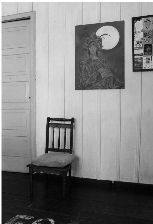
Maria Eduarda Balbinot (1998) incômodo , 2022 Fotografia digital

Essa fotografia pode apenas parecer uma cadeira perdida numa sala, e no fim, é exatamente isso. Uma cadeira vazia, uma ausência que contrasta com a parede preenchida com arte. Ao observar esse espaço íntimo, doméstico, de uma das mulheres, porém vazio, me fez refletir que até mesmo nos espaços que causam certo incômodo é combustão para a criação e a reflexão de quais espaços as mulheres ocupam dentro de suas casas?