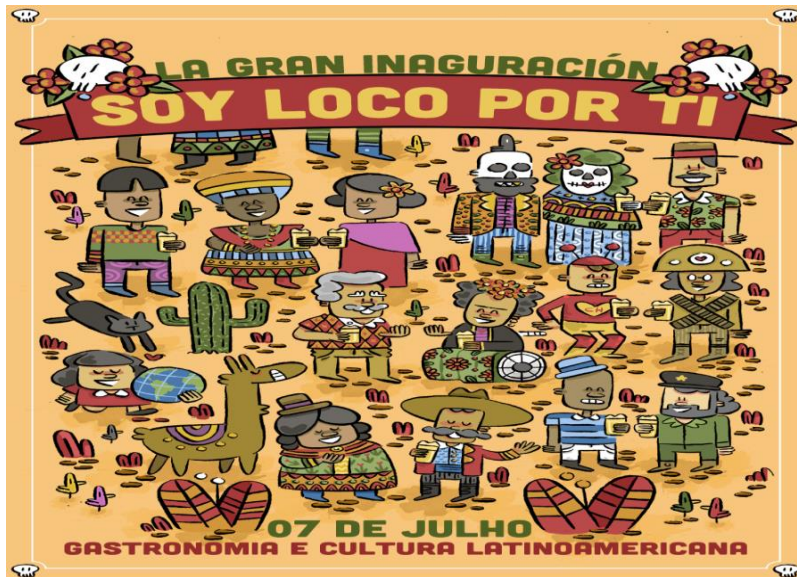
Figura 9 30

Bourdieu (1996) detalla sobre la competencia lingüística dominante: elemento que tiene su función en un mercado específico (comercio Foz y Puerto Iguazú) aparece bajo la denominación de capital lingüístico (el reconocimiento que pueda tener un agente) para llevar a cabo su colocación de formación de precios más favorable a sus productos y de aportar el lucro simbólico correspondiente, esto sería: en cuanto mayor la oficialidad de la situación o contexto, mayor es el grado de reconocimiento, de legitimidad en las formas de expresión dominante, cambiando las facultades de pronunciación, de producción lingüística, estos factores podrían ejercer en el receptor que estuviera dispuesto a conocer y reconocer.