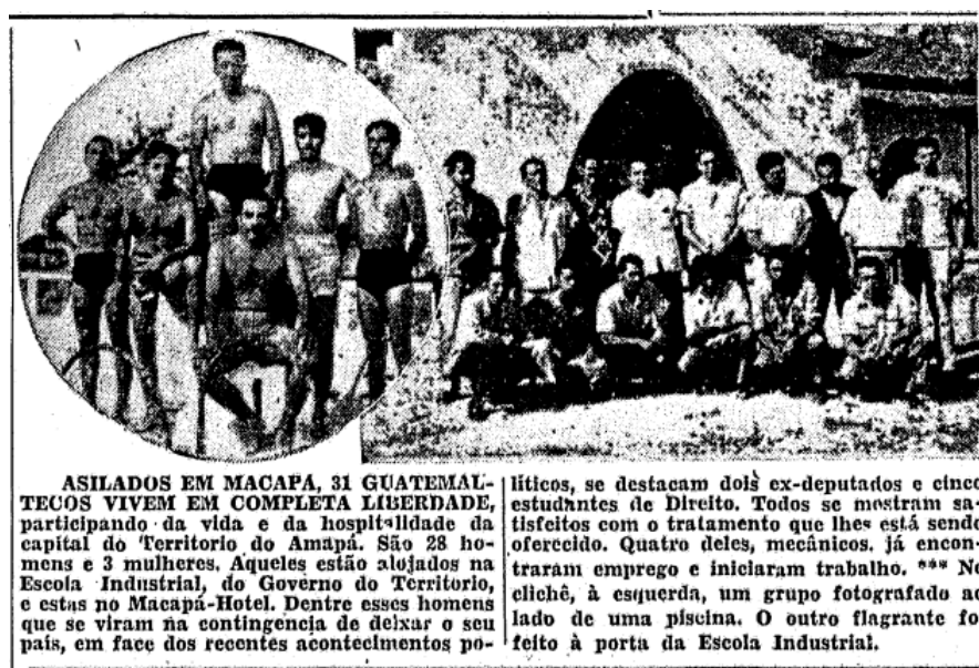
Figura 7 – Os guatemaltecos exilados no Brasil em 1954.