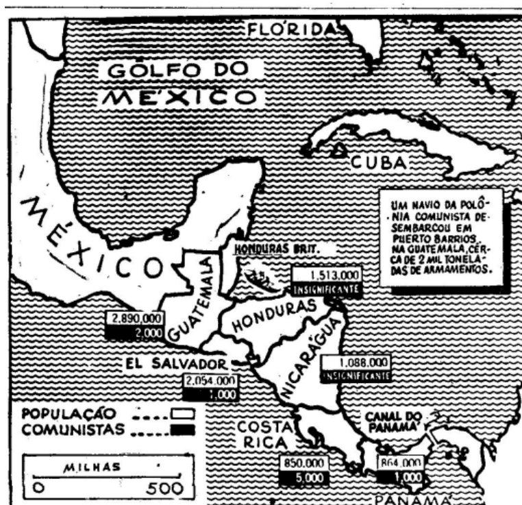
Figura 5 – Mapa da América Central e distribuição demográfica de comunistas.