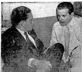
O Sr. João Goulart, à direita, falando no O GLOBO, em São Paulo