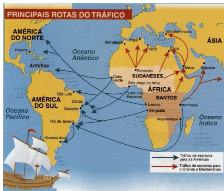
Figura 01: Rotas do tráfico de escravos