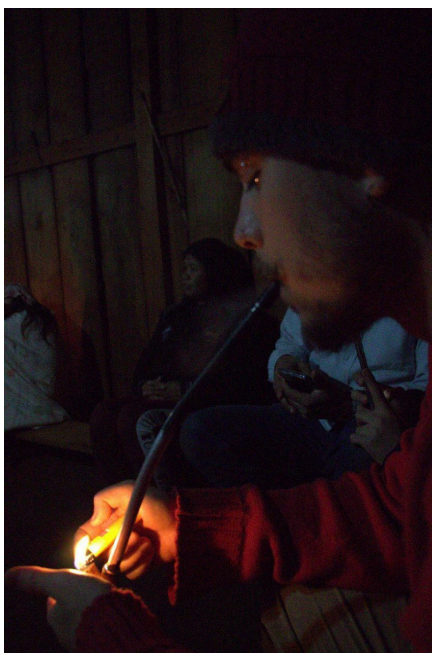
Fotografia 6: autor pitando o petyngua no opy