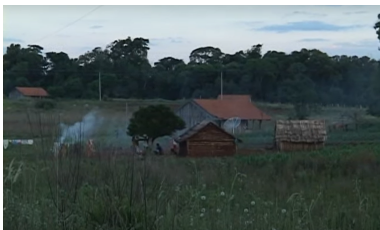
Imagens 1, 2 e 3 – Planos gerais em Mbya Mirim e En mi Tribuna

Bordwell e Thompson (2013) destacam que, além do que é filmado, o cineasta faz escolhas de como filmar a partir de três áreas, entre elas o enquadramento. “Em qualquer imagem, o quadro não é simplesmente uma borda neutra; ele impõe certo ponto de vista ao material da imagem. No cinema, o quadro é importante porque define ativamente a imagem para nós.” (BORDWELL; THOMPSON, 2013, p. 298, Grifos dos autores). O enquadramento pode afetar a imagem de diferentes maneiras, como nos colocando a certa distância, assim, segundo os autores, nos dando a sensação de estar “[...] longe ou perto da mise-en-scène do plano.” (p. 309, Grifo dos autores). Esse aspecto geralmente é chamado de “distância da câmera”, e para definir os termos em relação a cada distância, os autores usaram o corpo humano como medida-padrão. Assim estabelecem, em linhas gerais, alguns planos, como o plano geral, mais utilizado, por exemplo, para paisagens e vistas ( loc. cit. ), como vemos em Mbya Mirim e En mi Tribuna .