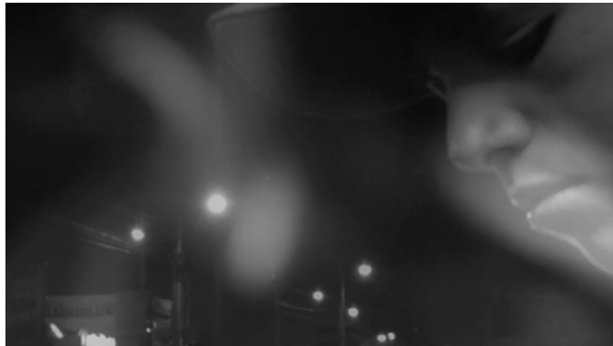
Imagem 14 – Chama sobrepõe a imagem de Marcelo