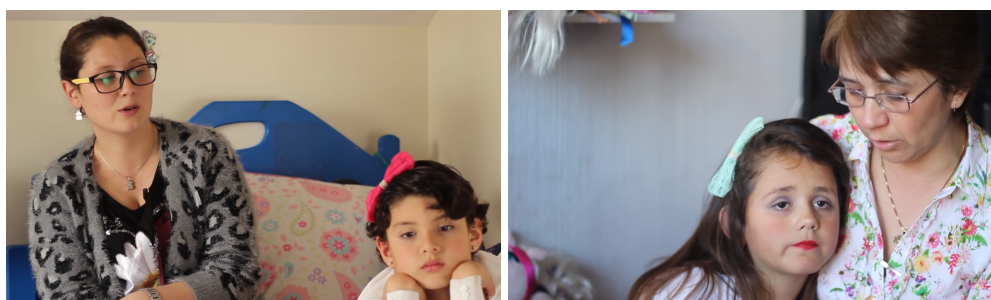
Imagens 38 e 39 – Mães de crianças e adolescentes trans