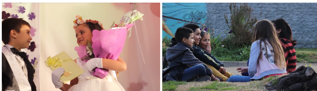
Imagens 40 e 41 – Alguns planos finais em Niños rosados y Niñas azules