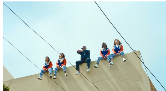
Figura 24, 25. Atrévete-te-te (2005)

Por otro lado, es evidente como en Bellacoso esta relación se presenta de manera horizontal, es decir, aunque los artistas son los principales en el videoclip, las mujeres también tienen un protagonismo ya que tienen una actitud empoderada, se apropian del espacio y hasta son colocadas a la par con los artistas.