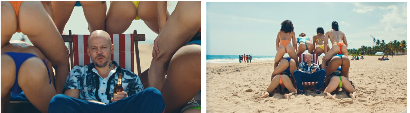
Figura 20, 21. Bellacoso (2019)

De esta forma, en el videoclip Bellacoso los cuerpos son predispuestos y mostrados a partir de la propia voluntad, abandonando así la posición voyeurista. Los cuerpos tienen agencia sobre su propia expresión sexual y la cámara cumple un papel más pasivo, al recurrir a tomas distantes, respetando la intimidad y registrando simplemente lo que le es mostrado. Aún exponiendo los cuerpos semidesnudos esta no insinúa reproducir fantasías masculinas (figs. 20, 21).