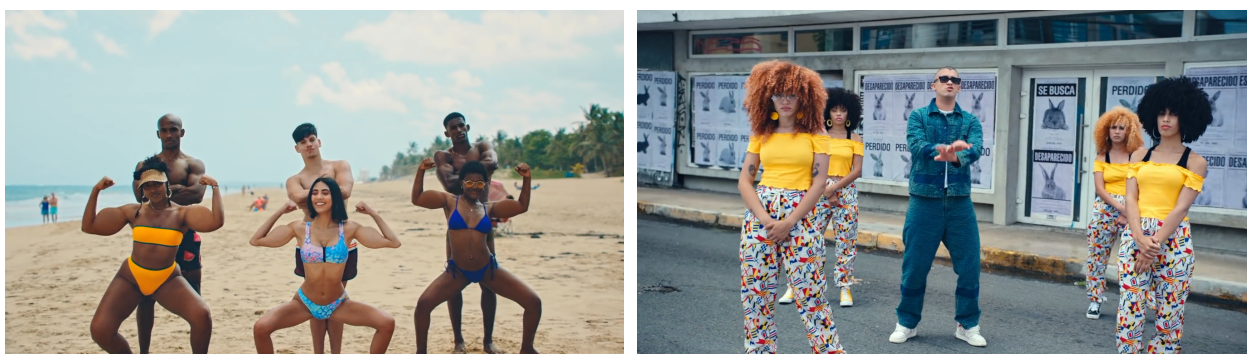
Figura 9, 10. Bellacoso (2019)

les atribuyen, según este estudio palabras como: independencia, inteligencia (azul); espontaneo, egoismo, optimismo (amarillo); vigor, agresividad, felicidad (rojo); vivacidad (verde); poder, ambiguo (morado); diversion, original, subjetivo (naranja). Estos colores evocan sensaciones más fuertes con carácter y convicción, esta variedad de estilos permite al espectador una gama de opciones en las que se puede ver contemplado lo que proporciona una identificación a un nivel personal.