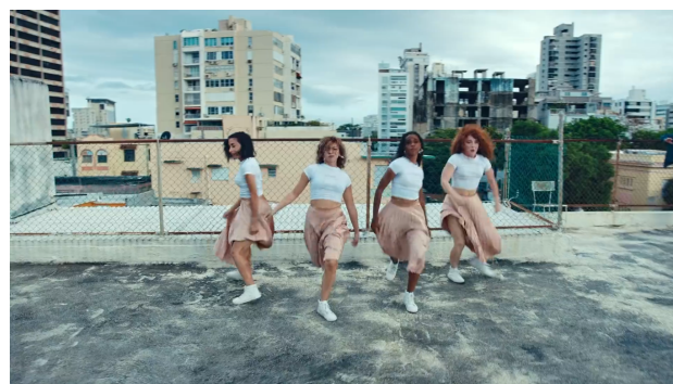
Figura 7, 8. Bellacoso (2019)

En Bellacoso , la paleta de colores de los vestuarios es más variada contando principalmente con colores primarios (azul, rojo, amarillo) y tonos secundarios (naranja, verde y morado). En su mayoría son colores radiantes que contrastan con el escenario —excepto por la secuencia donde la vestimenta se camufla con el fondo por su tonalidad pastel (fig. 10). En oposición con el blanco que Heller (2008) relaciona con adjetivos como “el bien”, “verdad”, “perfección”, “pureza”, “inocencia”; a los colores antes mencionados se