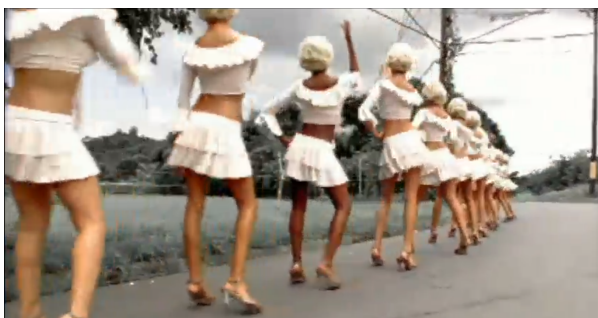
Figura 4. Atrévete-te-te (2005)

Podemos notar que los vestuarios, en ambos, consisten en prendas de ropa cortas que muestran bastante piel —lo que es recurrente en videoclips musicales de géneros urbanos en Latinoamérica. Por su lado, Atrévete-te-te muestra a unas bailarinas con una vestimenta bastante similar con la sex symbol de los años 50, la actriz Marilyn Monroe —específicamente nos remite a la famosa imagen de la escena de la película La Tentación Vive Arriba (Billy Wilder, 1955), donde su vestido es levantado por una corriente de aire proveniente del suelo. Esto insinúa que la mujer en este videoclip pretende ser un objeto de deseo, recalcado por el comportamiento de la cámara que será desarrollado más adelante.