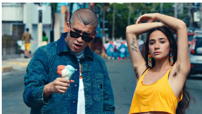
Figura 3. Bellacoso (2019)

Podemos notar que los vestuarios, en ambos, consisten en prendas de ropa cortas que muestran bastante piel —lo que es recurrente en videoclips musicales de géneros urbanos en Latinoamérica. Por su lado, Atrévete-te-te muestra a unas bailarinas con una vestimenta bastante similar con la sex symbol de los años 50, la actriz Marilyn Monroe —específicamente nos remite a la famosa imagen de la escena de la película La Tentación Vive Arriba (Billy Wilder, 1955), donde su vestido es levantado por una corriente de aire proveniente del suelo. Esto insinúa que la mujer en este videoclip pretende ser un objeto de deseo, recalcado por el comportamiento de la cámara que será desarrollado más adelante.