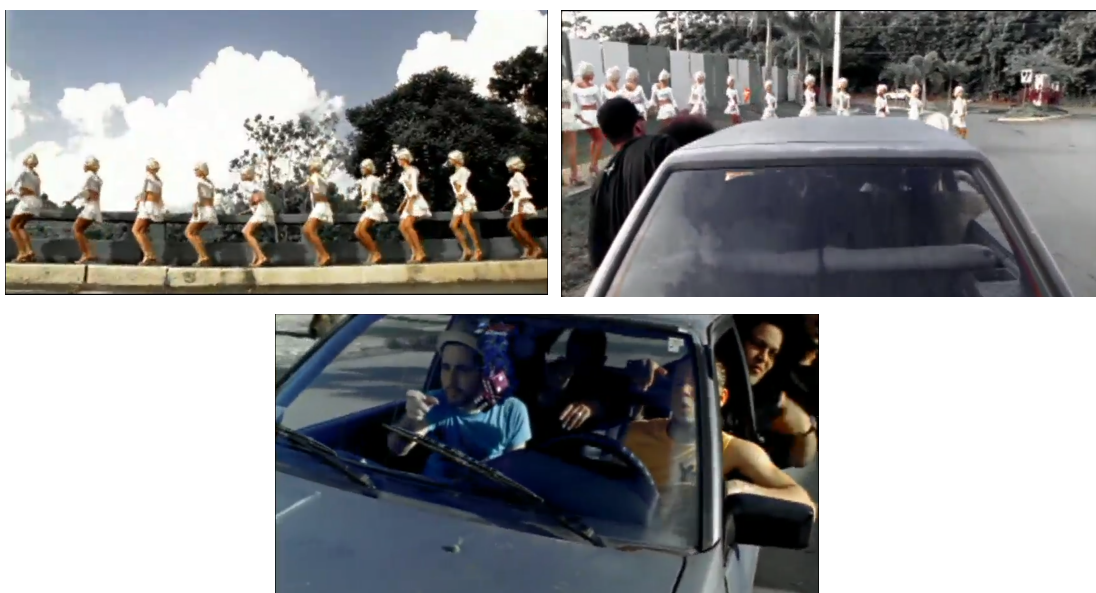
Figura 11, 12, 13. Atrévete-te-te (2005)