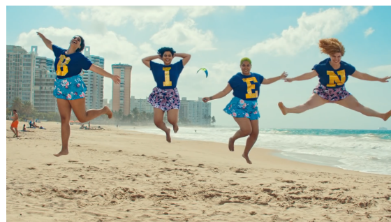
Figura 5. Bellacoso (2019)

En Bellacoso , existen varios grupos de bailarines con diferentes coreografías, vestuarios, cuerpos y estilos en general presentándose en diferentes escenarios. Además de esta diversidad, se pueden notar pequeñas variaciones en las prendas dentro de estas agrupaciones. Aunque son congruentes transmiten una noción de individualidad, algo que en el otro videoclip Atrévete-te-te , no se pretende.