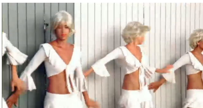
Figura 6. Atrévete-te-te (2005)

En el videoclip de Calle 13 las prendas de las bailarinas en su totalidad son de color blanco. Según Eva Heller (2008, p. 156-159), el blanco “es femenino y es noble, pero también es débil”, “es el color de la voz baja”, “es el color de los caracteres tranquilos y pasivos”, un color que, según la autora, también se asocia al bien y a la perfección. De esta manera, el color que utilizan las bailarinas les impone cualidades pasivas, esto acompañado de los otros factores dentro del videoclip crea una imagen de la mujer que está siendo representada como personas sin carácter y conformes. No son agentes que aporten significado, en realidad son las que portan el significado. Esta falta de agencia lleva a una cosificación de sus cuerpos, ya que están siendo despojados de sus voluntades, personalidad e identidad.