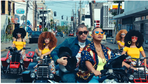
Figura 22. Bellacoso (2019)