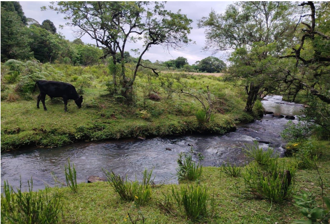
Figura 6. Floresta – Fuentes de agua - Ganado