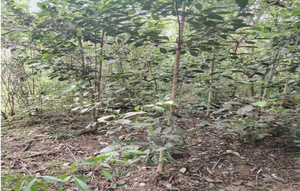
Figura 7. Plantío de yerba mate