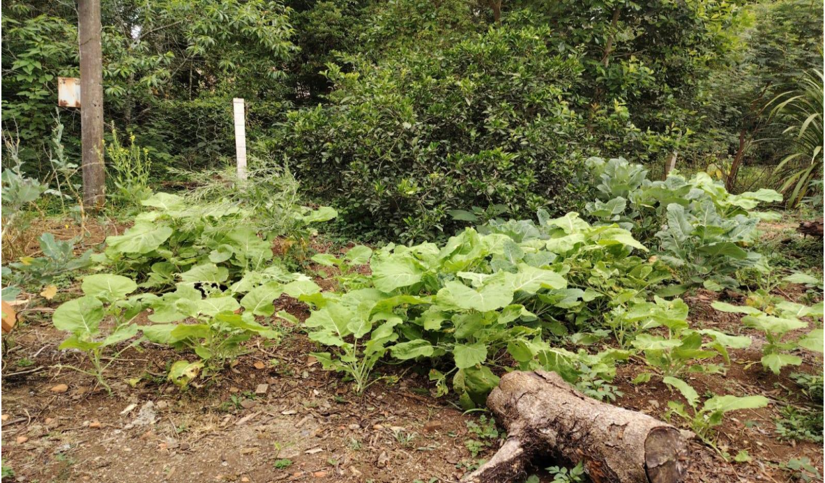
Figura 3. Huerto