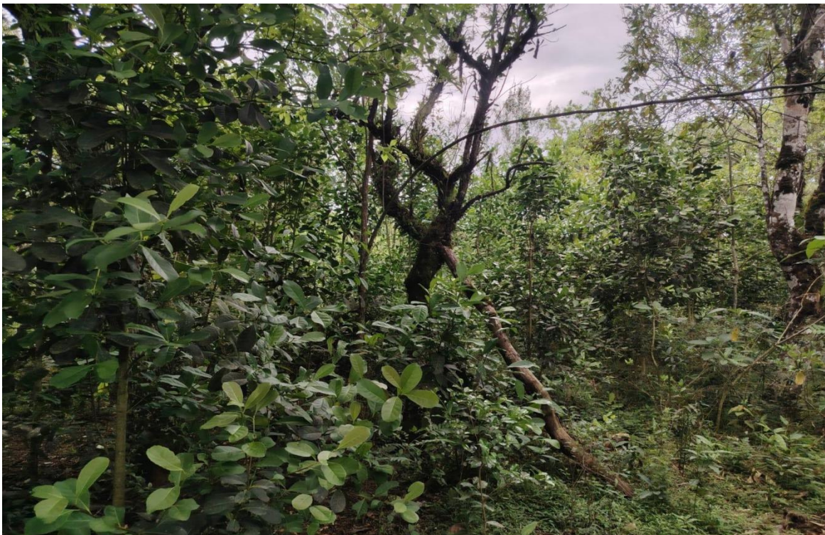
Figura 8. floresta Nativa