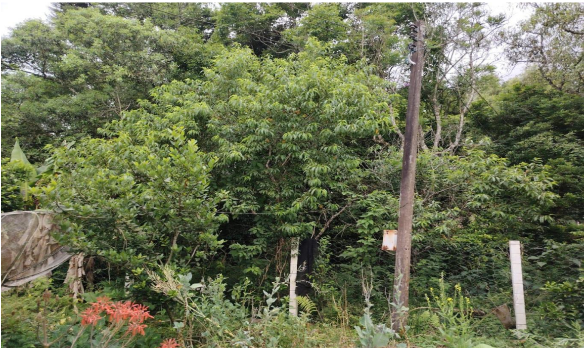
Figura 4. Árboles frutales