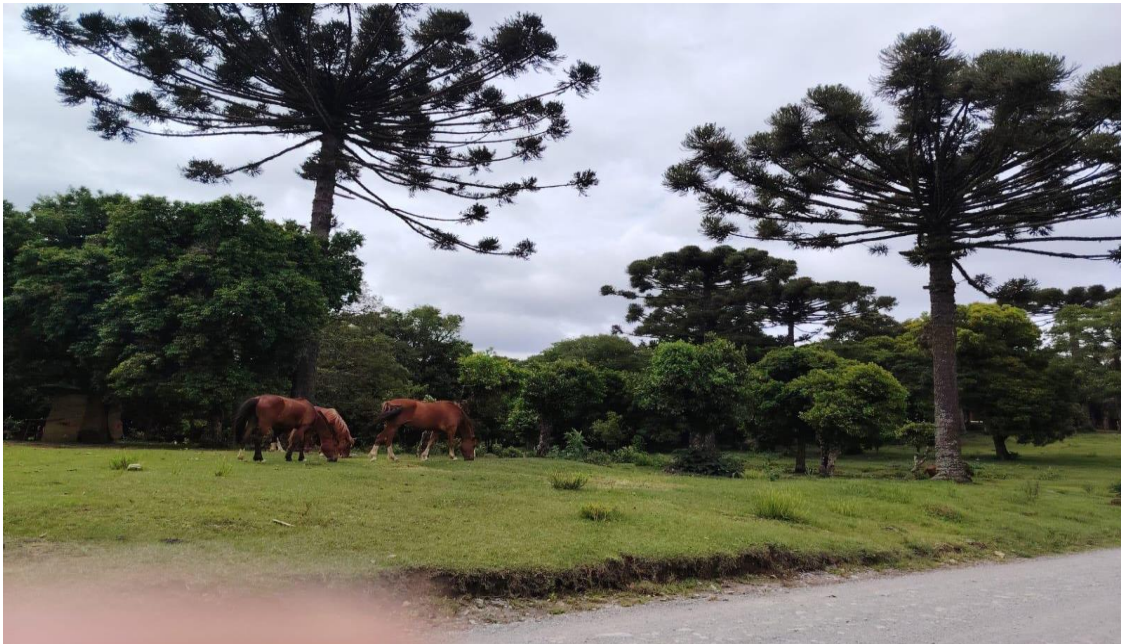
Figura 2. Floresta

A continuación se anexan fotografías tomadas en la pesquisa realizada en los faxinales de Rebouças (PR).