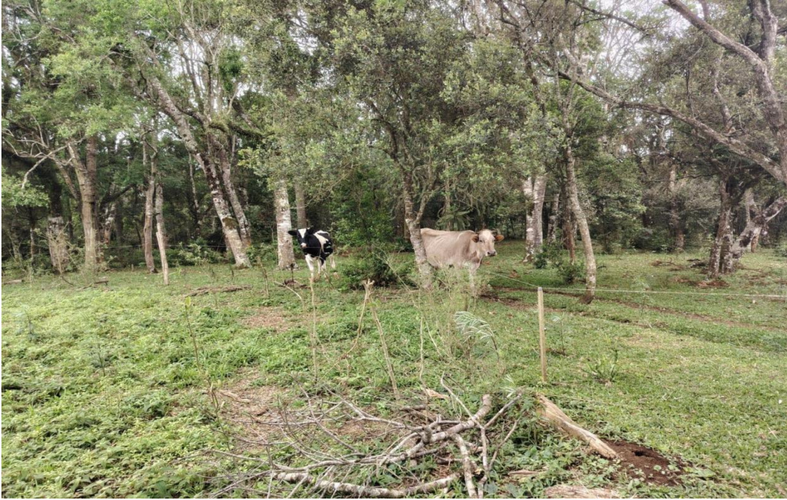
Figura 5. Floresta y ganado