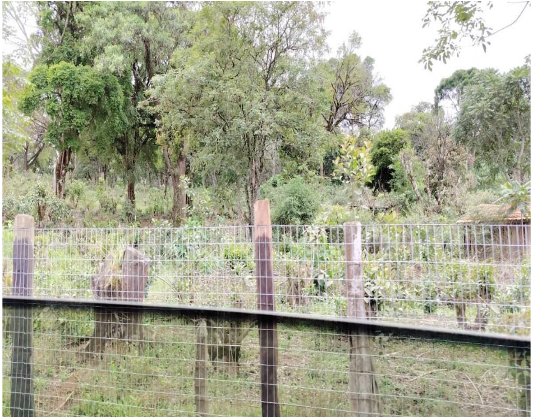
Figura 09. Faxinal cercado

se viene dando desde hace mucho tiempo atrás, él es una persona que nació en un faxinal, y aun moro en uno de ellos, y ha visto cómo se reduce la floresta en el territorio, en el cual cada vez hay menos floresta y más agricultura.