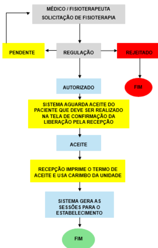
Figura 2. Fluxograma atual da regulação das solicitações de fisioterapia para clínicas credenciadas.

Desse modo, o atual fluxo de regulação dentro da rede através do sistema do RP ocorre da seguinte maneira: