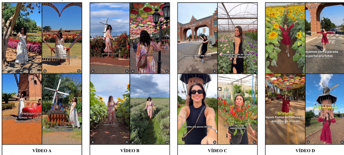
Figura 4 — Exemplos da personagem feminina como mediadora do olhar nos vídeos analisados – Brasil, 2025

A mise-en-scène corrobora essa lógica ao construir um ambiente estético marcado pela harmonia cromática, pela constância da iluminação natural e pela presença contínua de uma figura turística idealizada. Apresenta-se na Figura 4 a constatação de que em todos os vídeos selecionados, a personagem feminina aparece como mediadora do olhar: posando, caminhando, girando, tocando, sorrindo. O corpo, assim, funciona como âncora emocional e interpretativa.