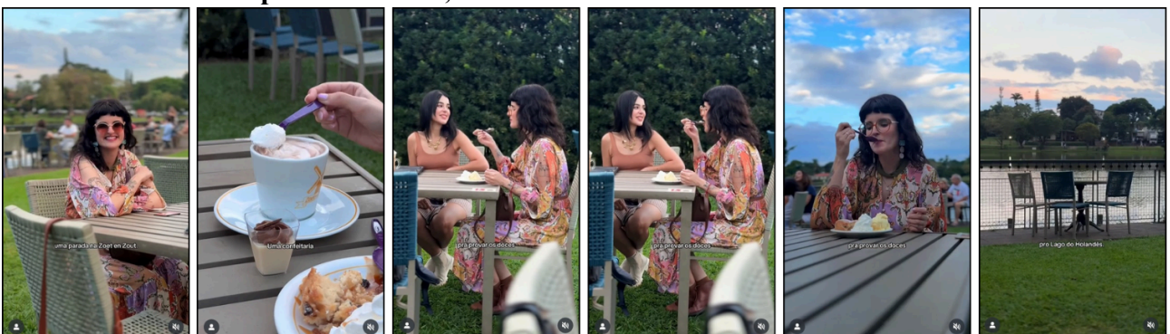
Figura 8 — Sequência de raccords no gesto de provar a sobremesa no vídeo B: continuidade visual e fluidez entre planos – Brasil, 2025