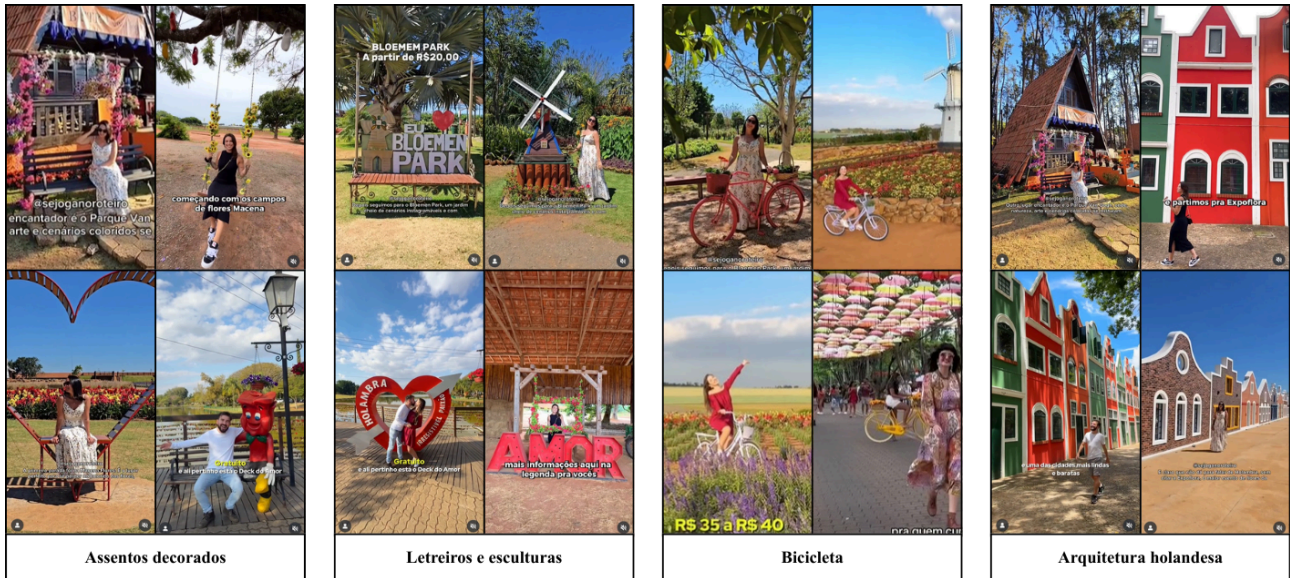
Figura 6 — Elementos instagramáveis que compõem a cenografia turística em Holambra nos vídeos analisados – Brasil, 2025

sintetizam a maneira como esses dispositivos estruturam a experiência turística e organizam a interação entre corpo, espaço e câmera.