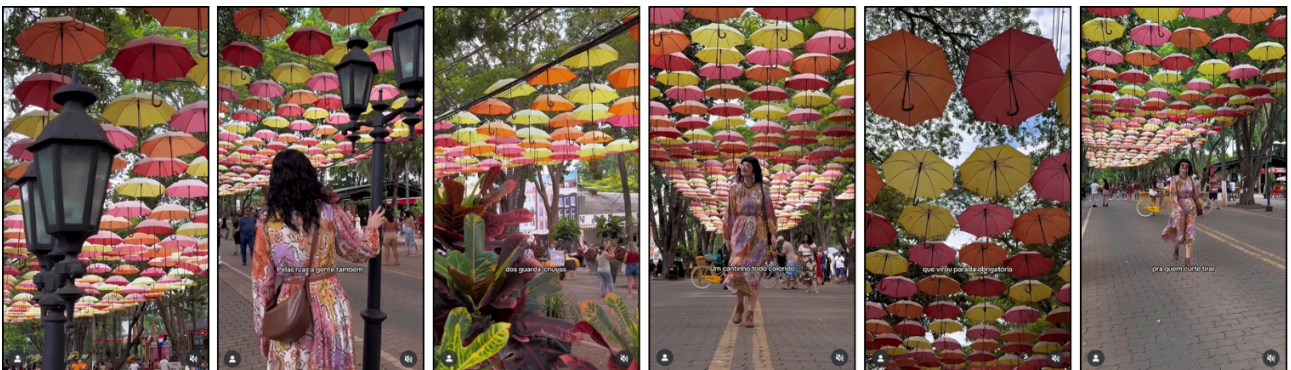
Figura 7 — Exemplos de raccords de ação na rua dos guarda-chuvas: continuidade gestual e movimentos sequenciais nos vídeos analisados – Brasil, 2025

Essa técnica se torna evidente nos raccords apresentados nas Figuras 7 e 8, nas quais a ação iniciada em um plano é retomada no plano seguinte a partir de um ponto de continuidade na ação ou no ambiente, de modo que o movimento parece prolongar-se sem interrupção. Ao operar essa transição fluida, o vídeo não apenas aumenta a sensação de naturalidade e de presença, mas também demonstra uma intenção expressiva rara no conjunto analisado, aproximando-se de procedimentos tradicionalmente associados à narrativa audiovisual profissional.