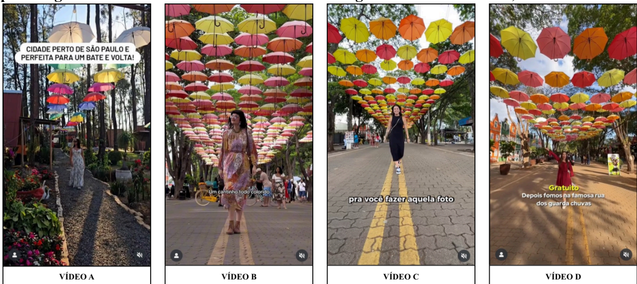
Figura 5 – Repetição da imagem-modelo nos vídeos A, B, C e D: ponto de vista frontal, personagem centralizada e cenário simétrico com os guarda-chuvas – Brasil, 2025

A composição dos quadros também evidencia uma padronização rigorosa da linguagem visual que estrutura a experiência turística como um gesto repetitivo. Em todos os vídeos analisados — e igualmente em outros materiais circulantes nas redes — reaparece a mesma imagem-modelo : ponto de vista acerca de um metro do chão, um plano aberto com a figura caminhando em direção ao dispositivo e ocupando o centro geométrico do quadro, enquanto o cenário simétrico se organiza ao fundo. A partir da demonstração na Figura 5, pode-se notar que a fórmula se repete de maneira quase idêntica nas peças B, C e D, especialmente na rua dos guarda-chuvas coloridos em Holambra, onde a convergência das linhas de perspectiva conduz inevitavelmente o olhar para a personagem central. Mesmo o vídeo A, embora não utilize o mesmo local exato, recria a mesma estrutura em outro ponto da cidade com guarda-chuvas coloridos pendurados: personagem no eixo médio, percurso frontal, profundidade de campo aberta e organização geométrica do cenário. O que surpreende, assim, é a uniformidade desta fórmula pois se trata de um padrão imagético consolidado, uma gramática compartilhada que define impreterivelmente como Holambra deve ser vista e registrada.