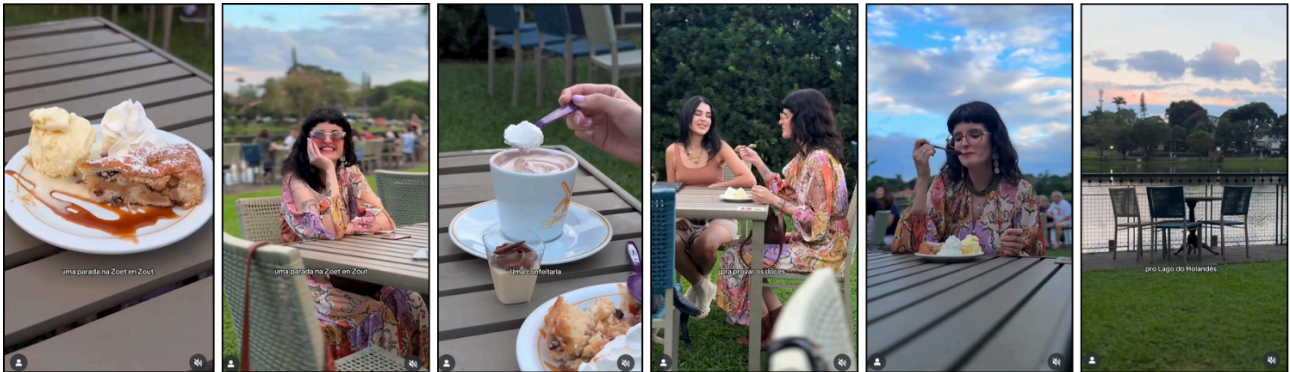
Figura 2 — Sequência de planos do vídeo B evidenciando o uso do plano-detalle na abordagem da gastronomia local – Brasil, 2025

Podemos pontuar também a estratégia verificada em muitos dos vídeos mapeados quanto à utilização de planos-detalle. Dentro do corpus, podemos verificar a ocorrência desta estratégia nos vídeos B e D com bastante similaridade: ambos trazem o recurso ao abordar a gastronomia local, conforme demonstrado nas Figuras 2 e 3, através das capturas de tela das respectivas sequências que carregam os planos-detalle.