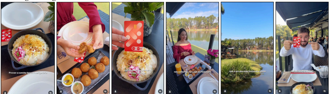
Figura 3 — Sequência de planos do vídeo D evidenciando o uso do plano-detalle na abordagem da gastronomia local – Brasil, 2025