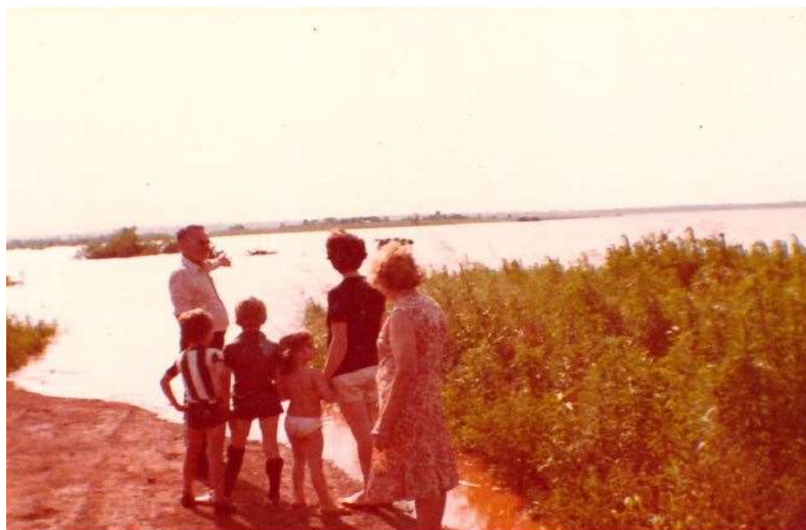
Foto: 1982