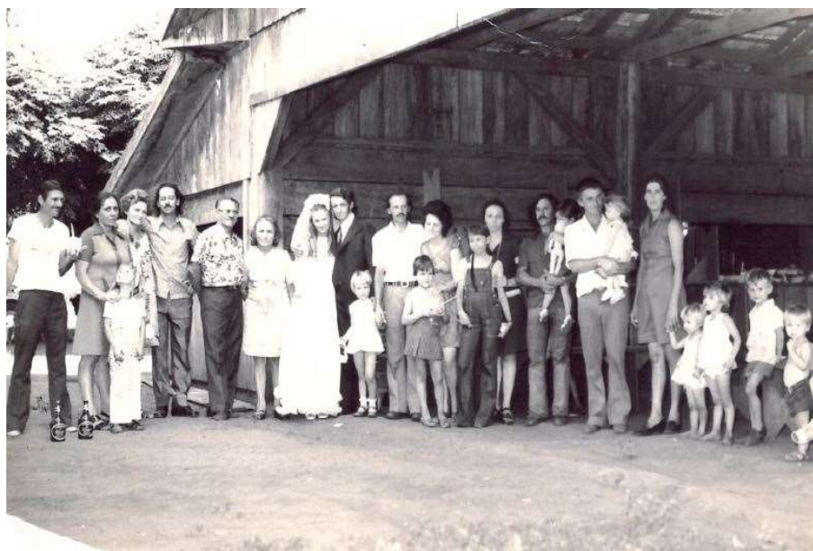
Figura 4: Festa de casamento na Igreja Nossa Senhora da Saúde em Vista Alegre.

Foto: 05 janeiro de 1973