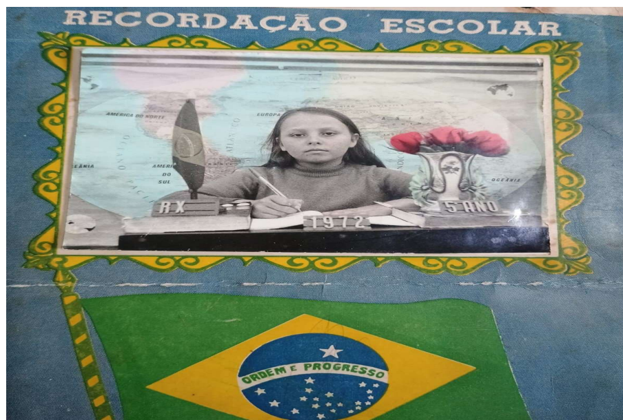
Figura 2: Recordação escolar da Escola Rui Barbosa, em Vista Alegre.

Fonte: Acervo pessoal da senhora Vilma Berlanda de Andrade 21 / Foto: 1972