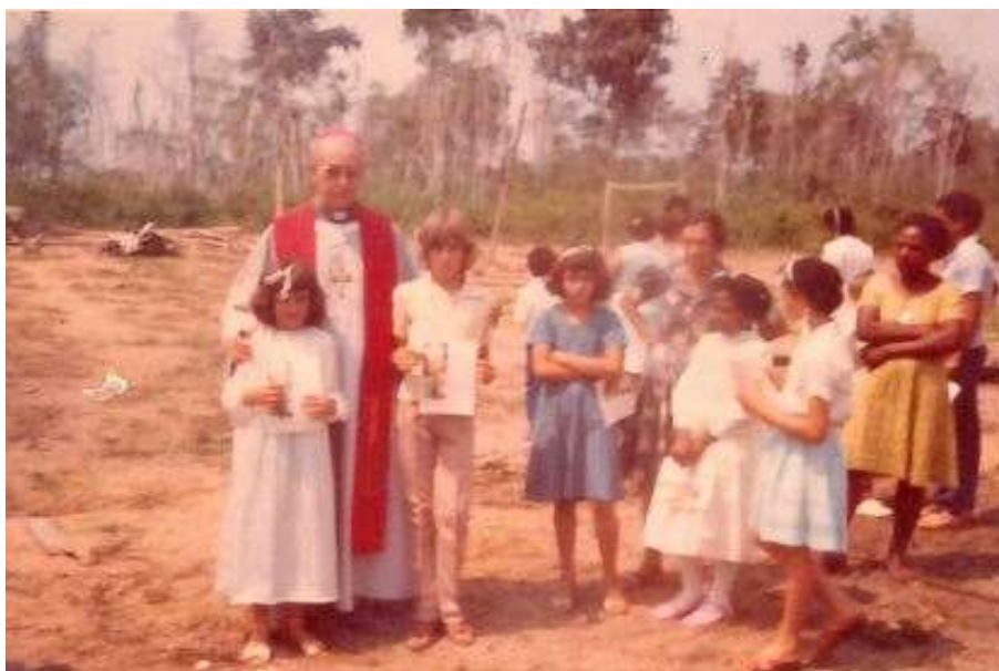
Figura 6: Crisma na comunidade de Vista Alegre.