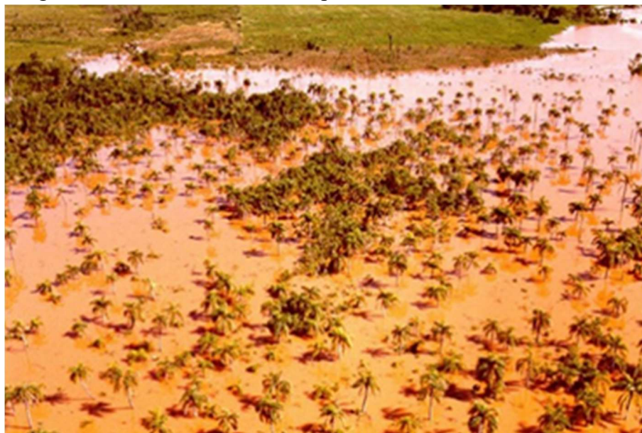
Figura 10: Alagamento do reservatório de Itaipu.

Fonte: itaipu.gov.br. 40 Foto: Valdenor Franzen, 2014