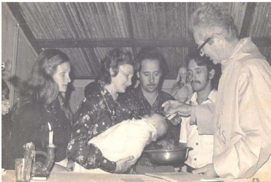
Figura 5: Batizado na Igreja Nossa Senhora da Saúde em Vista Alegre.

Fonte: Acervo pessoal da senhora Elisabete Berlanda Viana/ Foto: 1975