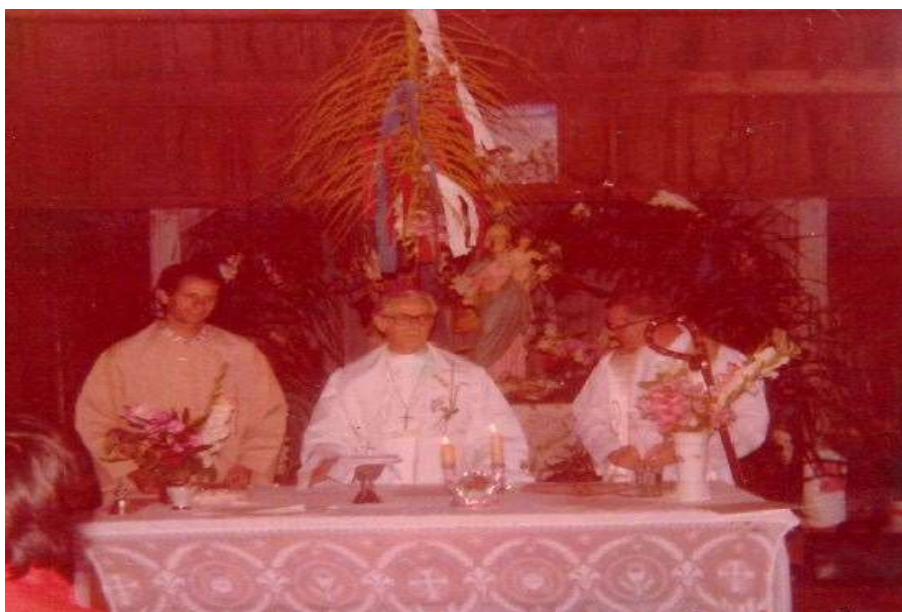
Figura 3: Missa na Igreja Nossa Senhora da Saúde na comunidade de Vista Alegre.

Fonte: Acervo pessoal da senhora Elisabete Berlanda Viana 22 /Foto: Novembro de 1979