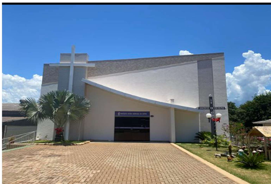
Figura 7: Igreja e imagem de Nossa Senhora da Saúde na atualidade.

Na fotografia (FIGURA: 7) abaixo, observa-se a Igreja Nossa Senhora da Saúde, que hoje é uma paróquia do bairro Portal da Foz, e a estátua da Santa que pertenceu à Igreja de Vista Alegre.