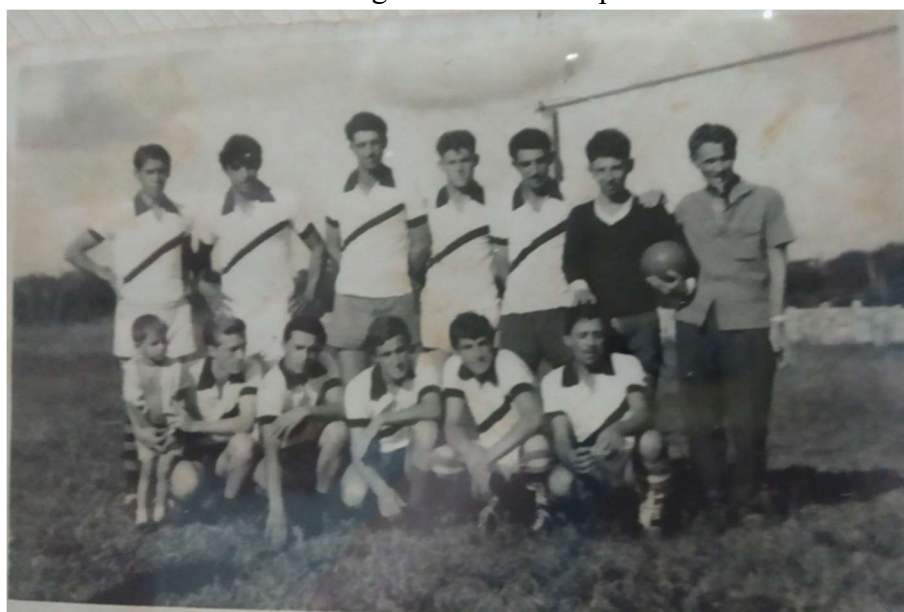
Figura 9: Time de futebol da Vista Alegre - Cruzeiro Esporte Clube.

32