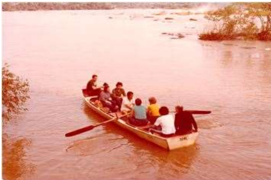
Figura 8: Travessia no Rio Paraná de Vista Alegre para Hernandarias, Paraguai.

29