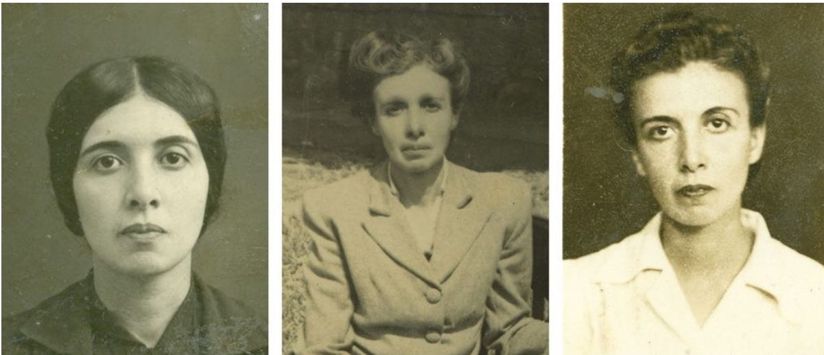
Figura 4: Nise da Silveira na juventude