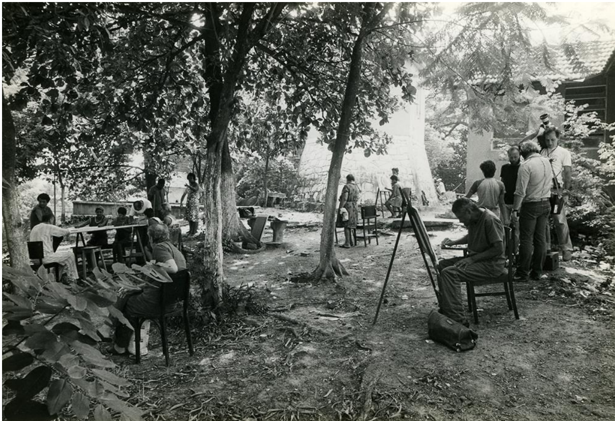
Figura 2: Atividades no Engenho de Dentro