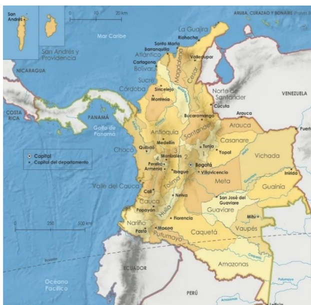
Figura 2 – Mapa actual de Colombia

Tras esta guerra civil, el país quedó en ruinas a nivel económico, diversos paisajes y riquezas naturales se deterioraron y perdió territorio frente a los países vecinos, lo que dio como resultado una cartografía similar a la actual (ver figura 2). Por consiguiente, no sólo se le dificultaba a la población minorizada la construcción de un discurso propio y su representación en la historia, sino que la sociedad colombiana en general era consciente del ciclo repetitivo en el que estaba inmersa y de que el Estado no había logrado instaurar el orden ni convertirse en el legitimador y protector de la vida y la propiedad que había prometido ser, sino que se había convertido en el principal promotor de la violencia.