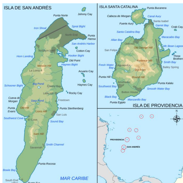
Figura 4 – Mapa del Archipiélago de San Andrés, Providencia y Santa Catalina