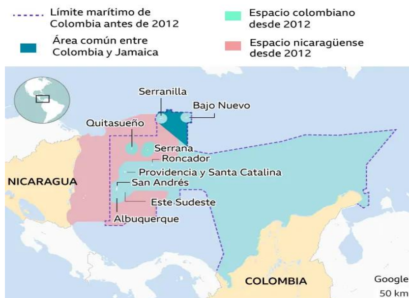
Figura 5 – Delimitación marítima entre Colombia y Nicaragua

explotar sus recursos naturales, se han sentido infantilizados y definidos a partir del lente externo, del lente del visitante (Bendek, 2022), por lo que ha surgido la necesidad de construir su propia historia y de aumentar el uso del creole sanandresano, más allá del ámbito familiar y social. Este hecho se ha visto reflejado en la literatura local, en la que no sólo se narra la historia y los problemas de la isla, sino que también se incluye la lengua nativa. En Los cristales de la sal (2019), varios personajes ponen en práctica esta reconstrucción al reunirse y debatir sobre la historia y las problemáticas del archipiélago.