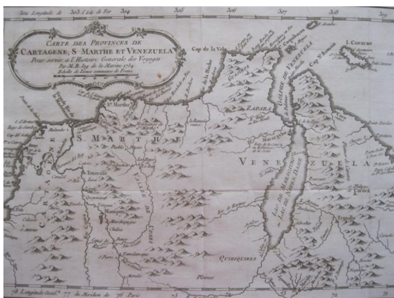
Figura 3 – Mapa de Cartagena, Santa Marta y Venezuela por Jacques-Nicolas Bellin

Tras diversos procesos de división territorial, en 1525 se fundó la ciudad de Santa Marta, la más antigua del país y la segunda de Sudamérica, y en 1533, la ciudad de Cartagena de Indias (ver figura 3). Debido a su ubicación estratégica, estas dos ciudades eran el centro administrativo del Nuevo Reino de Granada y sus puertos eran los más importantes para la conexión con el Viejo Continente. A pesar de ello, ambas ciudades sufrían constantes ataques de piratas que saqueaban y quemaban diversos lugares, lo que ponía en peligro la efectividad de las funciones administrativas y la conservación de los registros históricos. En 1538, el conquistador español Gonzalo Jiménez de Quesada fundó la ciudad de Santa Fe de Bogotá y la nombró capital.