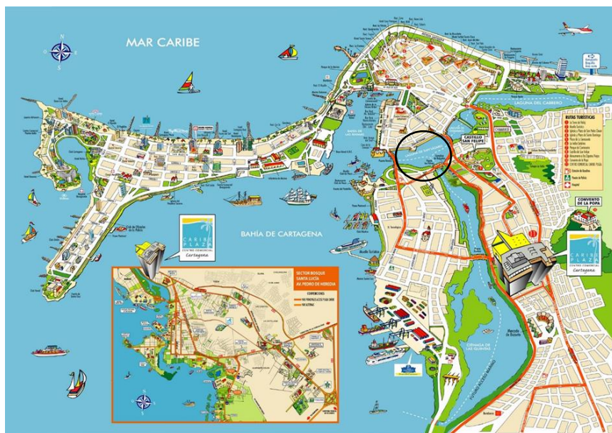
Figura 6 – Posible ubicación del barrio en Ver lo que veo