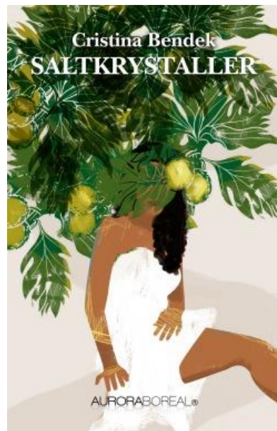
Figura 10 – Portada edición en danés