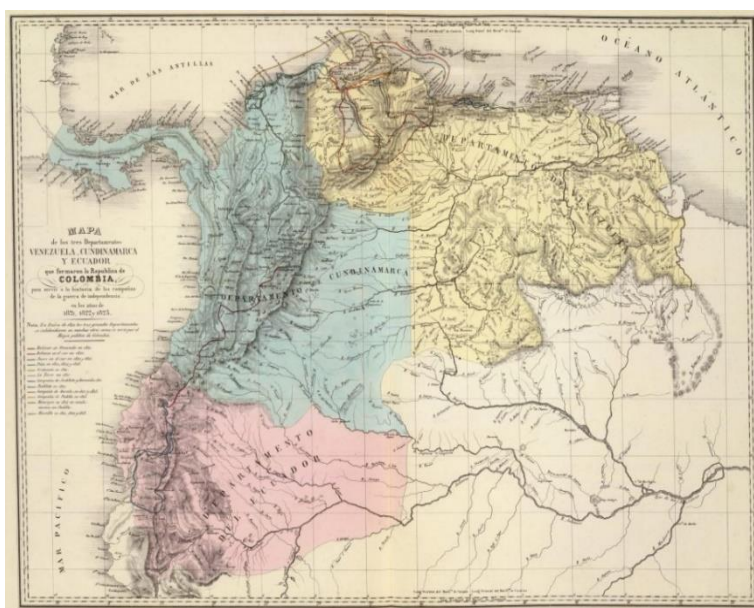
Figura 1 - Mapa de la Gran Colombia

Dicha imaginación se crea mediante diferentes símbolos que representan “lo común” de sus integrantes; en este caso, los símbolos patrios (flor, animal, himno, escudo y bandera), el español como lengua oficial y el catolicismo como religión principal. Una vez culminado el periodo de independencia, quedaron dos grandes estructuras organizativas: el ejército, que creció desenfrenadamente y luego se utilizó contra el pueblo, y la Iglesia, que definió la organización de la nueva nación. En 1822, “la imagen de la República independiente y soberana se había afirmado por completo en la conciencia de América, y todas las gentes se rendían sin reservas a esa evidencia” (Gaviria, 2001, p. 40), razón por la cual los habitantes de las islas de Providencia y San Andrés se unieron voluntariamente y juraron obediencia a la Constitución de la Gran Colombia.