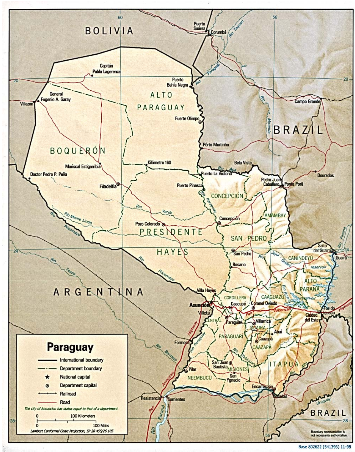
Figura 2 – Mapa político da República do Paraguai.