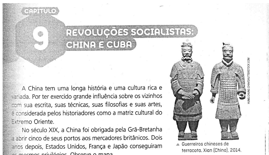
Figura 1 – Imagem de guerreiros terracota presente no livro didático.

Na abertura do capítulo 9 intitulado “Revoluções Socialistas: China e Cuba”, observa-se o uso de uma imagem dos guerreiros de terracota de Xian (Figura 1), identificados como “Guerreiros chineses de terracota”. Xian [China], 2014”. Embora visualmente atrativa, essa figura aparece de forma descontextualizada, uma vez que o texto trata do imperialismo europeu no século XIX, enquanto os guerreiros pertencem ao período da dinastia Qin, cerca de 210 a.C. O recurso visual, portanto, cumpre uma função ilustrativa, sem contribuição efetiva para a compreensão histórica.