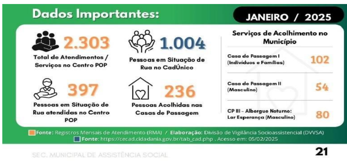
Imagem 1 – Situação dos Serviços de Acolhimento em Foz do Iguaçu – PR.