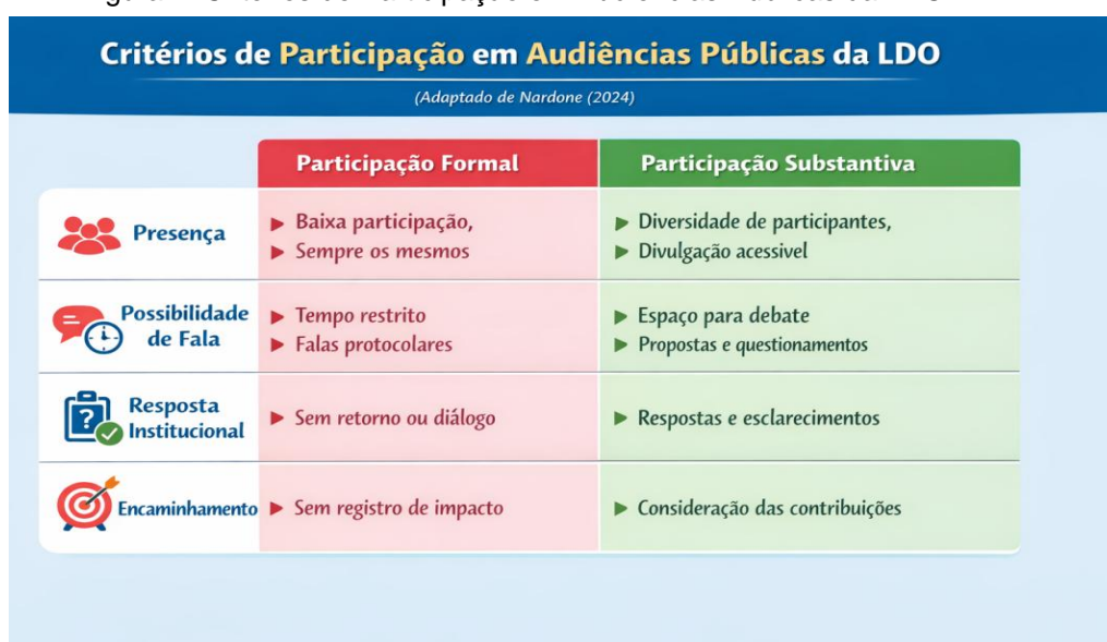
Figura 1: Critérios de Participação em Audiências Públicas da LDO