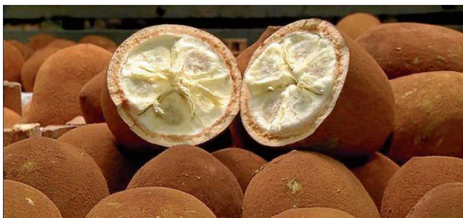
Fotografia 2- Cupuaçu, fruta amazônica

Não podemos deixar de destacar aqui que uma das frutas que chamam a atenção é o cupuaçu 1 , consumido por muitos nortistas e que os povos tradicionais veem como algo valioso para toda a Amazônia. De acordo com pesquisadores do Instituto de Biociências (IB) da USP (2023), o fruto, “parente” do cacau, é uma espécie domesticada pelas populações indígenas do médio-alto Rio Negro há mais de 5 mil anos.