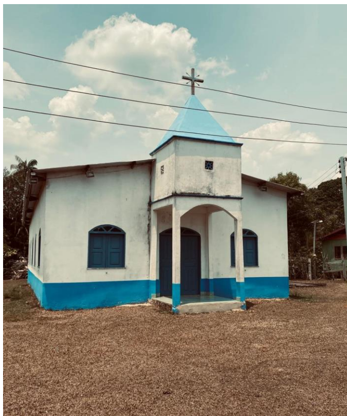
Fotografia 6 – A única igreja da comunidade (igreja São Pedro)

No que diz respeito à infraestrutura da comunidade, o acesso a bens e serviços sociais, embora contingente, é organizado em comparação com outras comunidades do município de Manicoré. São Pedro do Uruá possui um campo de futebol, um centro social chamado Francisca Paes, uma escola municipal chamada Pedro Batista, um salão de dança e uma igreja católica.