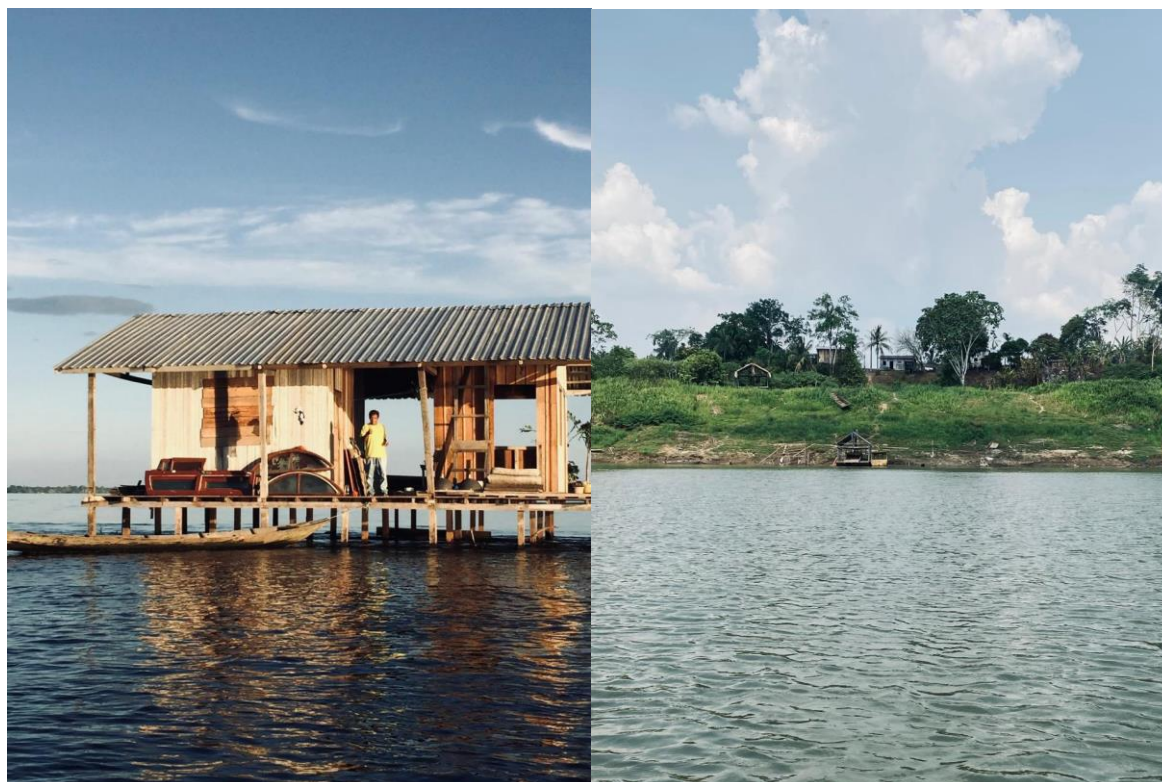
Fotografia 8 – Casa palafita (à esquerda) e casas na beira do Rio Madeira.

As moradias, em geral, possuíam poucos móveis; no entanto, as redes desempenhavam papéis principais, sendo utilizadas para relaxar nos momentos de lazer ou como camas. Além disso, algumas famílias tinham televisão (TV), outras não, mas o rádio estava presente em todas as casas que visitei. Isso talvez comprove o motivo de o mesmo ser indicado como o veículo mais importante para a transmissão de informações para os ribeirinhos, apesar da internet estar presente no ambiente.