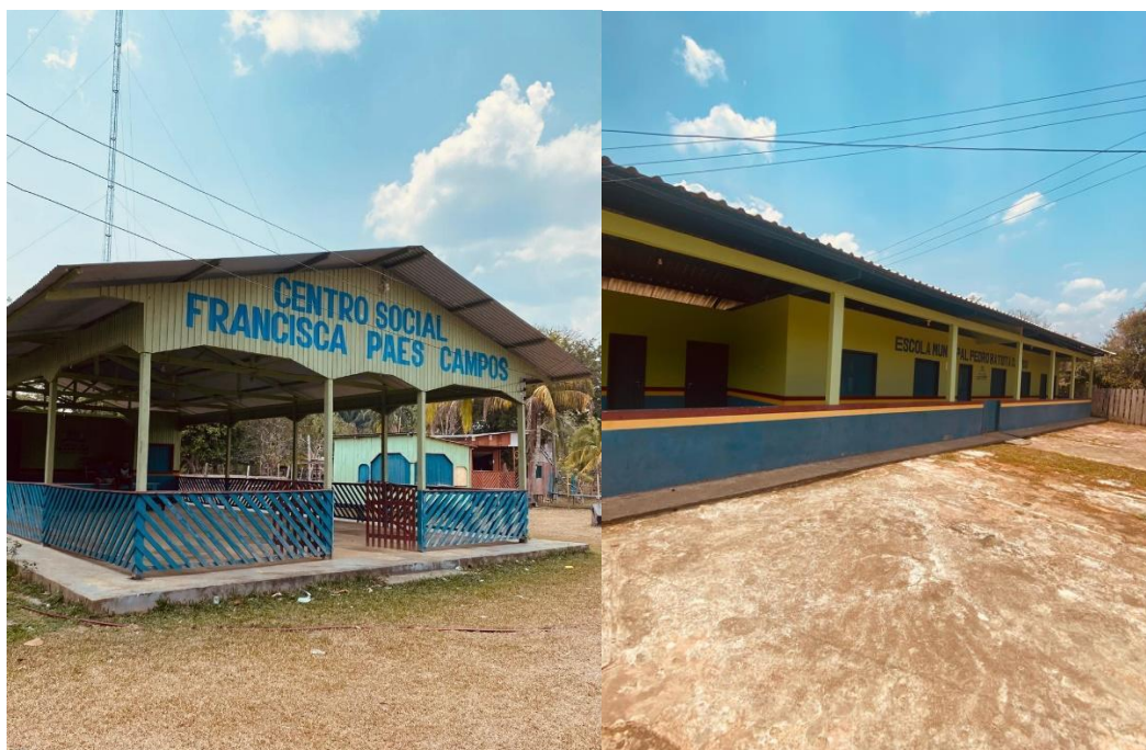
Fotografia 7 – Centro social e escola municipal com as cores do atual prefeito de Manicoré

Um ponto curioso que observei foi o nome dado à escola e ao centro social. Eles recebem os nomes de dois membros da primeira família que se instalou na comunidade. Atualmente, a maioria dos moradores possui esses sobrenomes: Batista, Paes, Barbosa, Mar, até porque são parentes.