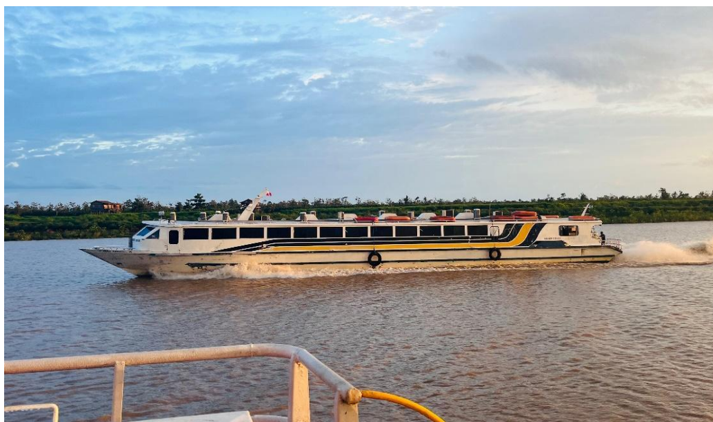
Fotografia 3 – Lancha que sai de Manaus a Manicoré