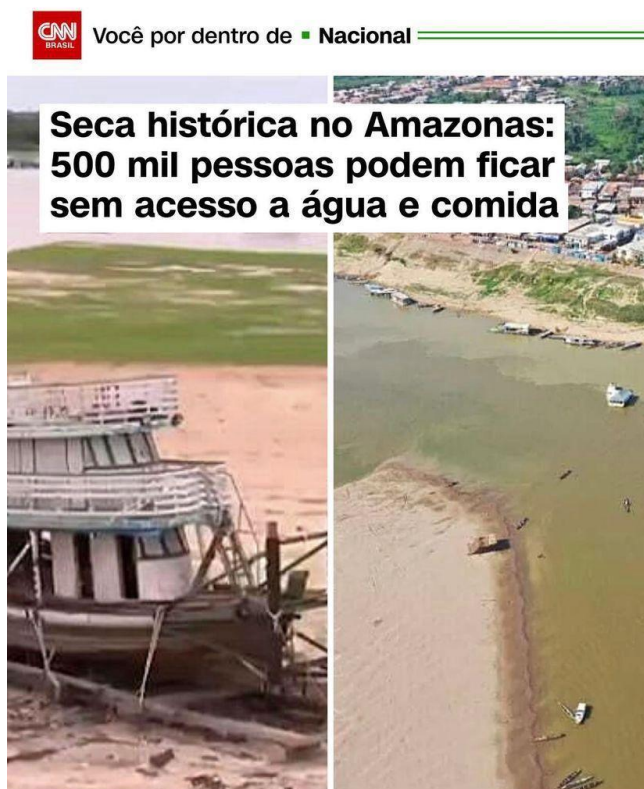
Imagem 3 – Reportagem feita pela CNN Brasil