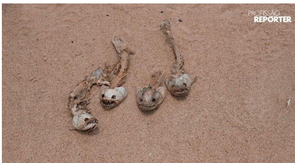
Imagem 2 – Esqueletos de peixes mortos no Rio Negro durante grande seca

Há outras situações, durante o período de cheia, é impossível plantar, e os peixes, surpreendentemente, se dispersam na vastidão das águas, tornando a pesca mais difícil. Como resultado, as famílias enfrentam uma situação de vulnerabilidade devido a essa realidade das inundações. Uma das alternativas é viajar a Manaus ou Manicoré em busca de outros alimentos.