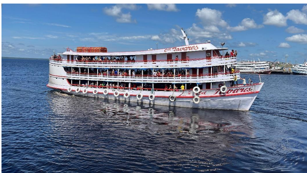
Fotografia 4 – Barco com passageiros e mercadorias

A partida para a comunidade e para o município de Manicoré pode variar, uma vez que são vários barcos que podem sair em qualquer dia da semana. Geralmente, saem toda terça e quinta-feira, retornando na sexta-feira ou domingo, transportando pessoas e mercadorias. Quanto às lanchas, costumam sair toda sexta-feira e retornam no domingo a Manaus.