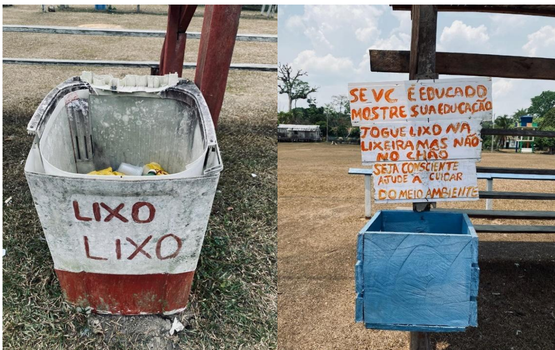
Fotografia 10 – Coletas de lixo e avisos para visitantes e moradores