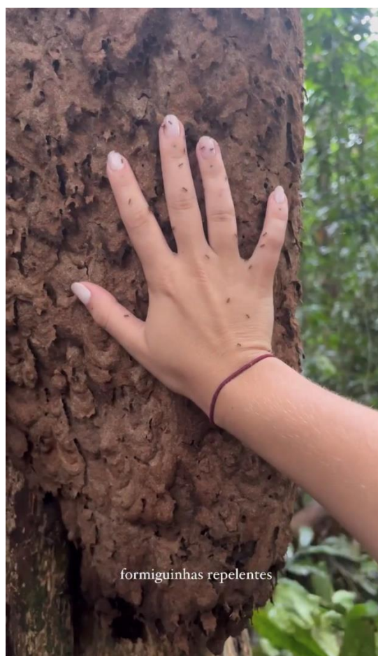
Fotografia 9 – Formiga Tachí - repelente