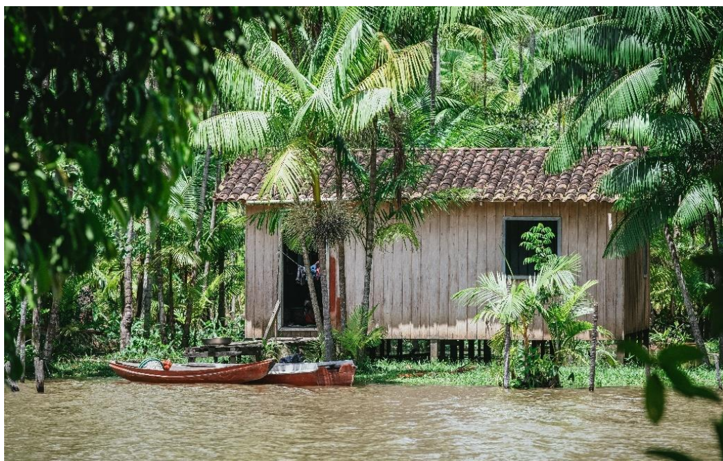
Fotografia 1- Casa palafita à beira do rio