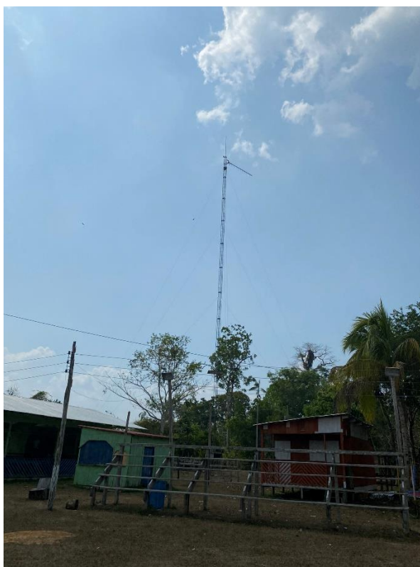
Fotografia 15 – A primeira antena para receber internet