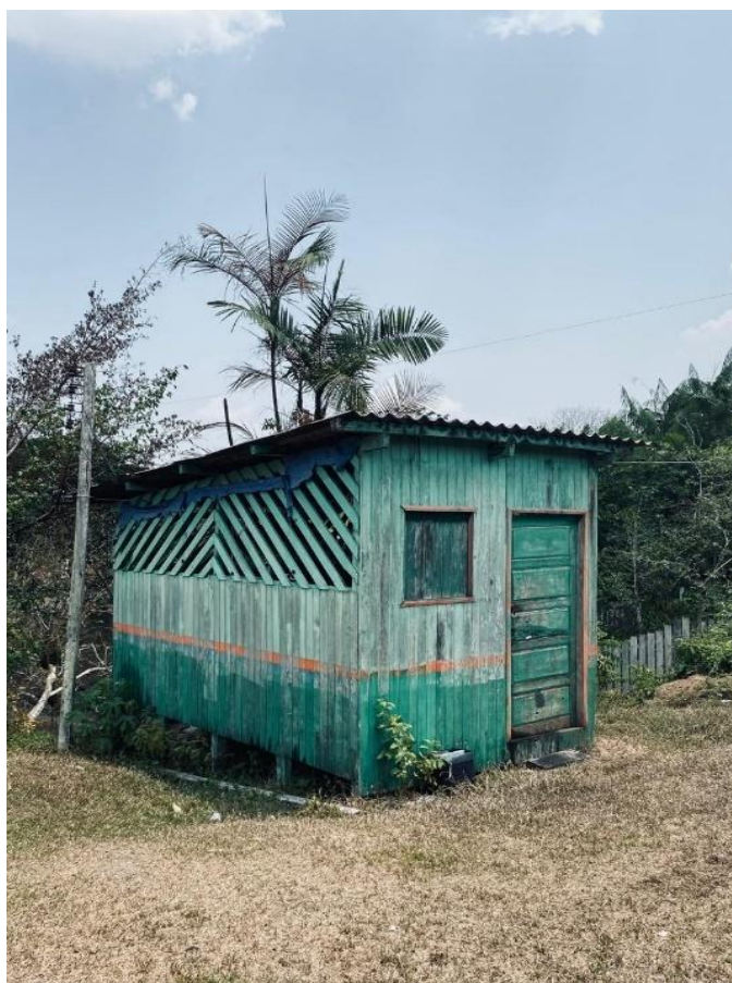
Fotografia 11 - Estrutura construída para proteger o gerador.