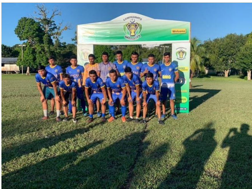
Fotografia 12 – Times representantes da comunidade