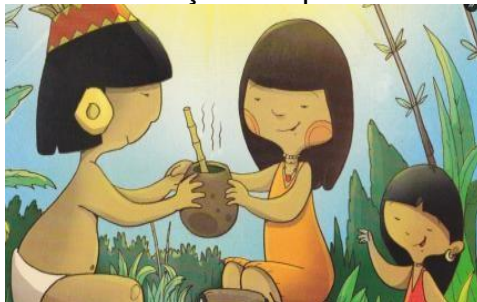
FIGURA 3 – Crianças compartilhando Tereré

(Araí), em forma de belas jovens, desceram à Terra" e, agradecidas pela proteção de um sábio cacique, criaram para seu povo a planta sagrada (COLMAN, 1994, apud ATENEO GUARANI, 2010).