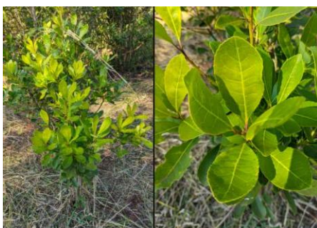
Figura 1 – folhas de erva mate

Estendendo-se a partir do tronco, os ramos finos e flexíveis sustentam a verdadeira joia da planta: as folhas (figura 01). Estas não são folhas comuns. São folhas perenes, que persistem verdes durante todo o ano, um símbolo de resistência. Ao pegá-las, sente-se sua textura coriácea – firmes e resistentes como couro. Esta textura é resultado de uma cutícula espessa, uma camada de cera que reduz a perda de água, um superpoder para enfrentar verões intensos. A cutícula, conforme Heckman (2019), "desempenha função crucial na proteção contra a dessecação e na defesa contra patógenos, sendo particularmente espessa em espécies de ambientes com alta insolação" (p. 112).