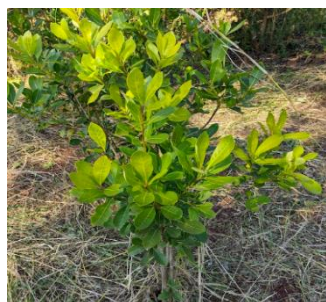
FIGURA 2 – Plantio de erva mate.

secundárias (MARCHESAN et al., 2013). Esta rede vascular não é apenas o esqueleto da folha; é o seu sistema circulatório (ALMEIDA et al., 2025). É por ali que correm os elementos: a xantina, a teobromina, a teofilina e uma legião de antioxidantes e vitaminas que a planta, em sua sabedoria silenciosa, sintetiza (BRAVO et al., 2007), "está intimamente ligada ao desenvolvimento foliar e à exposição sola atingindo seu ápice em folhas maduras de plantas cultivadas sob condições ideais de luz".