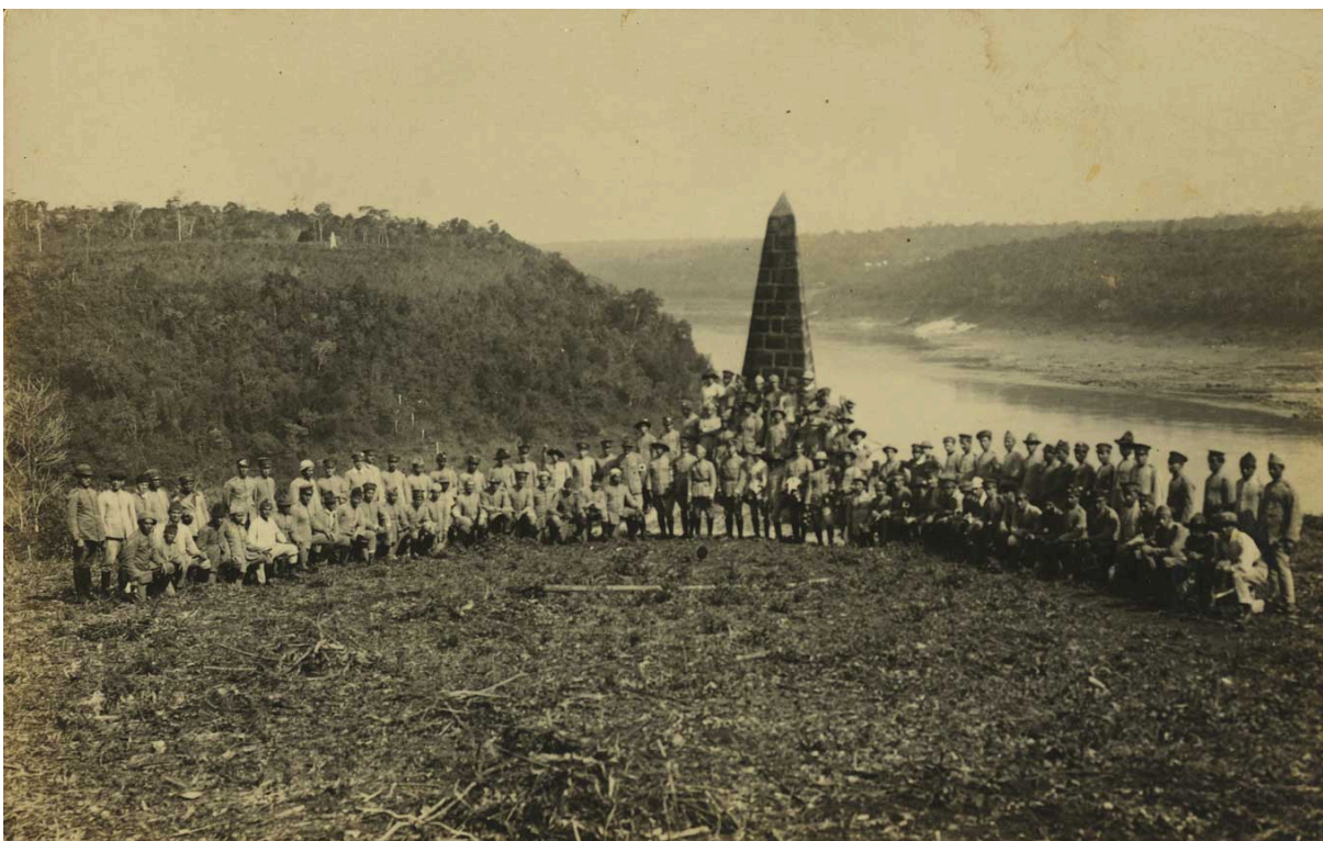
Figura 15 – Rebeldes paulistas e gaúchos na fronteira com o Paraguai e a Argentina formam a Coluna Prestes. Foto tirada em Foz do Iguaçu, onde as Colunas Miguel Costa e Prestes se encontraram

Com o andar da pesquisa, percebeu-se que, após a construção dos marcos, o espaço do Marco das Três Fronteiras torna-se, em alguma medida, um espaço esquecido ou, ao menos, não documentado de forma sistemática (até onde esta pesquisa conseguiu alcançar). Entre o início do século XX e a década de 1960, praticamente não se encontraram registros sobre o local. A única exceção, encontrada no acervo da Biblioteca Nacional Digital, foram fotografias datadas de 1924, relativas ao encontro dos tenentistas da Coluna Miguel Costa-Prestes em Foz do Iguaçu. Nelas, observa-se a presença de integrantes do movimento tenentista próximos ao obelisco, sugerindo que o espaço ainda funcionava como possível ponto de referência geográfica, ainda que desprovido de qualquer infraestrutura ou significado turístico naquele período.