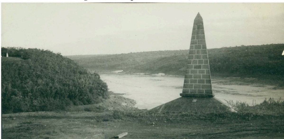
Figura 14 – Fotografias do Obelisco, 1930

marcos localizados no bairro de Porto Meira, em Foz do Iguaçu, e na margem oposta, onde hoje se encontra a cidade de Puerto Iguazú. Como sintetiza Louvain (2018), esse ato marcou o encerramento pacífico de um litígio territorial que atravessara séculos — desde os conflitos entre as coroas espanhola e portuguesa, passando pelas disputas entre o Império do Brasil e a República Argentina, até o acordo entre esta última e a então recém-proclamada República dos Estados Unidos do Brasil. Os trabalhos da Comissão foram oficialmente concluídos em 1905, com a instalação de aproximadamente 300 marcos ao longo da fronteira estabelecida.