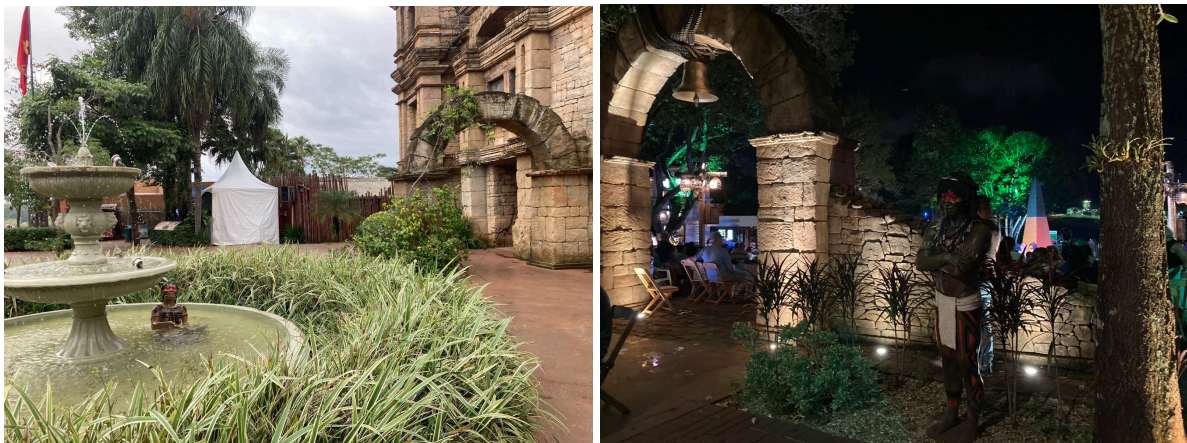
Figura 7 - Estátuas sem identificação