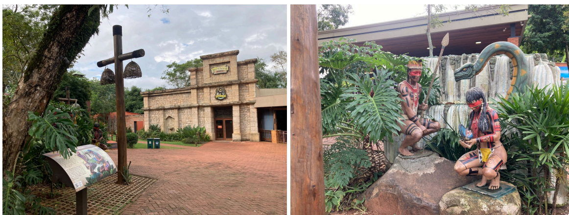
Figura 11 - Restaurante Cabeza de Vaca e estátua da lenda das cataratas