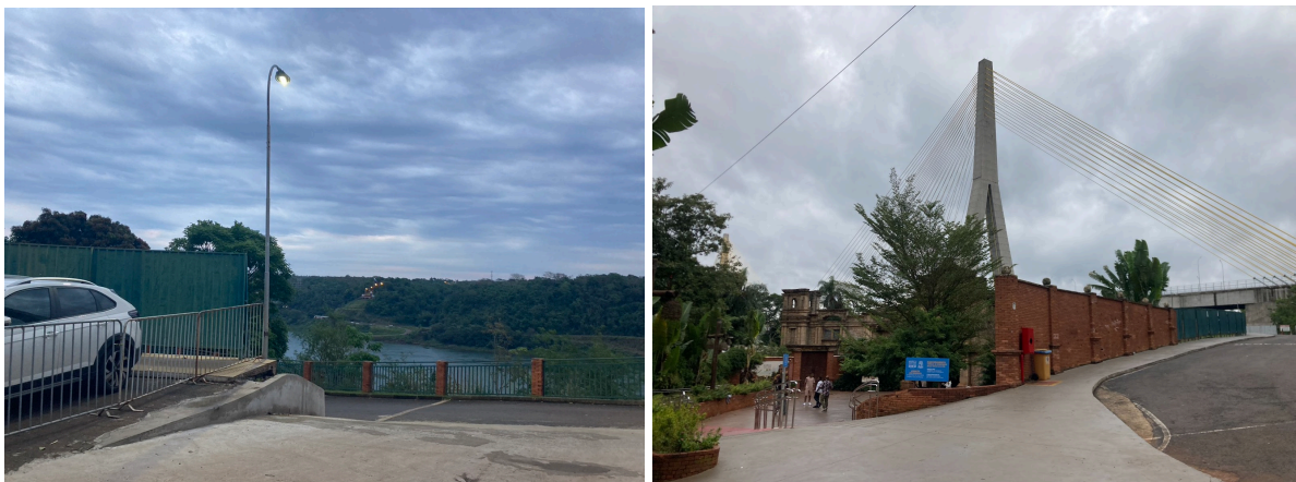
Figura 2 - Vista atual da entrada do Marco das Três Fronteiras com alterações na paisagem