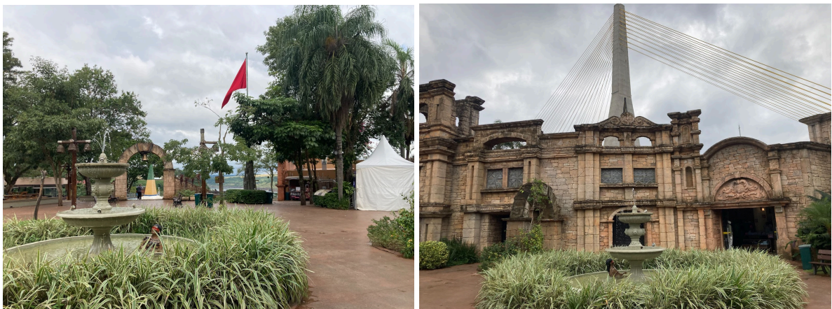
Figura 6 - A primeira praça

Somente depois deste percurso é possível adentrar o espaço murado do parque, onde o obelisco brasileiro, em verde, amarelo e azul, começa a se revelar ao fundo. Ao entrar, o visitante encontra uma primeira praça com um chafariz central. Ali, dois elementos ganham destaque aos olhos mais atentos: a escultura de uma mulher indígena, sem nome ou qualquer identificação, que está posicionada dentro da água; mais adiante, de pé, próximo a um coqueiro, uma figura masculina indígena em tamanho real repete a mesma ausência de placa ou explicação. São presenças silenciosas, cuja função simbólica parece ser mais decorativa do que informativa, sugerindo um apagamento da individualidade e da historicidade desses corpos.