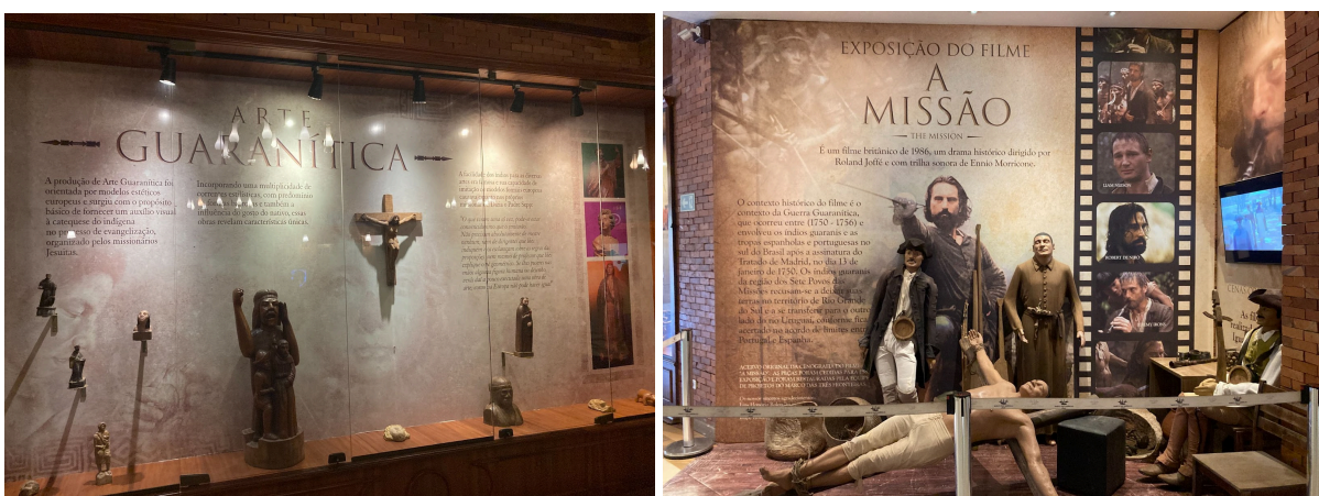
Figura 4 - Exposições de arte guaranítica e do filme “A Missão”, localizadas no salão de entrada