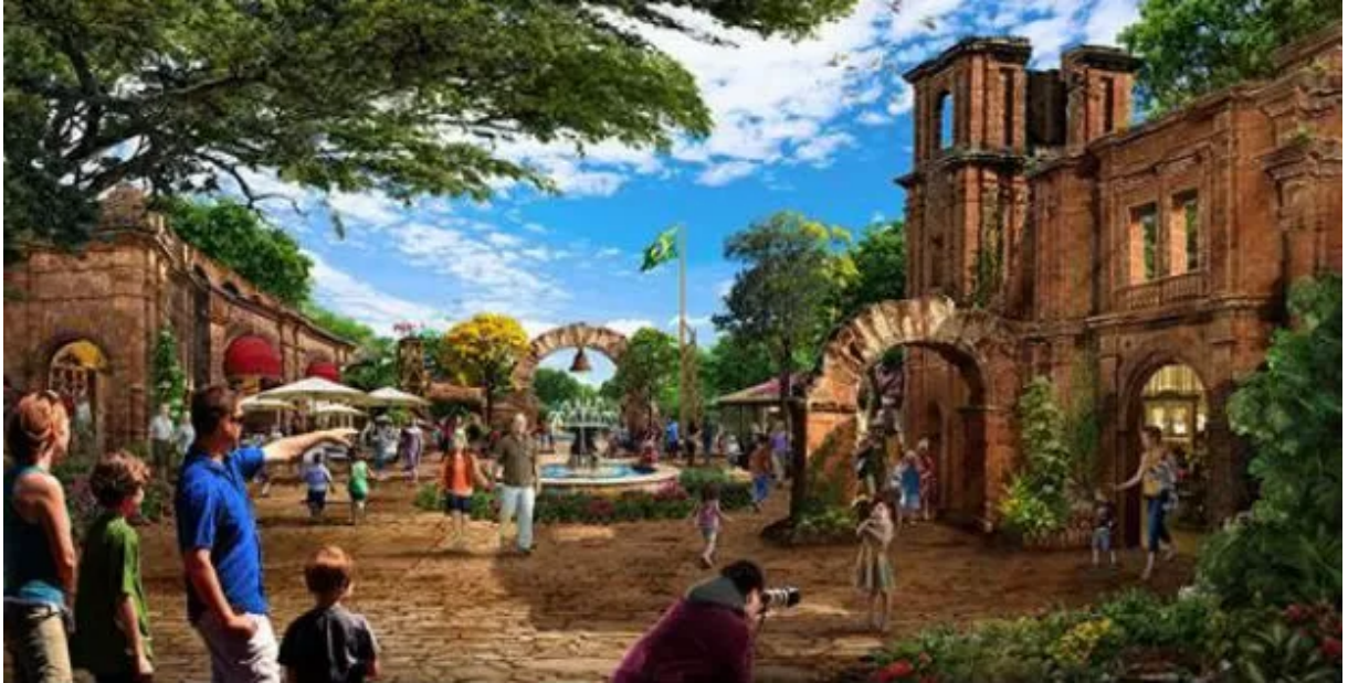
Figura 19 – Vila de entretenimento cidade cenográfica das Missões Jesuíticas imagem projeto conceitual