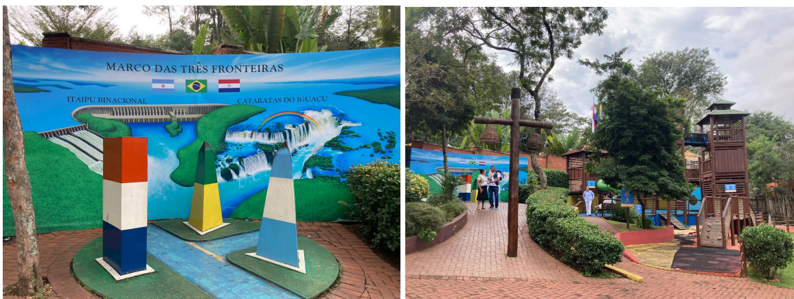
Figura 10 - Espaço para fotos e playground

ou ainda, instagramável 8 . Ao lado, encontra-se uma área infantil com playground e, logo à frente deste, o restaurante Cabeza de Vaca . Por fim, existe um conjunto de três estátuas — um homem e uma mulher indígenas e uma cobra — que se encontra atrás de um poste de madeira e representam o conto das cataratas, está acompanhada por uma placa mais à esquerda das estátuas, esta conta a história da lenda (figura 11).