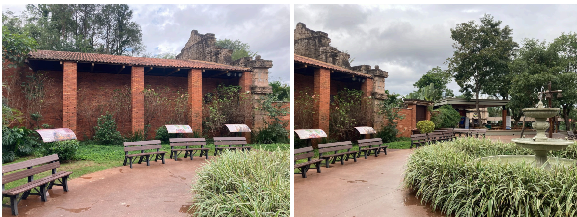
Figura 8 - Placas da primeira praça

Ao sair da primeira praça, atravessa-se um pórtico (visível na fotografia à esquerda da figura 6), construído no mesmo estilo das ruínas missioneiras, com um sino pendurado no alto. Ao passar por ele, o visitante entra em um espaço mais amplo, onde por fim se encontra o obelisco cercado por outro chafariz, próximo a ele existem outras duas placas, a mais próxima do obelisco, “Marco das Três Fronteiras - Brasil”, afirma que o obelisco é um dos principais símbolos da cidade e que celebra a paz entre povos, ademais cita sua história somente no último parágrafo 6 . Já a placa mais distante do obelisco, “Fronteira