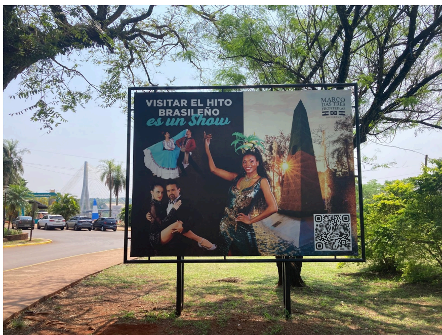
Figura 21 – Propaganda do Marco das Três Fronteiras Brasileiro em outdoor a frente do obelisco argentino

Ademais, outros aspectos corroboram para essa análise. Um deles é a própria organização física e simbólica do espaço, cujas escolhas de disposição revelam as prioridades do projeto turístico que o molda. Por exemplo, o fato de a pessoa visitante ser conduzida, logo na entrada, à loja de suvenires antes mesmo de viver a experiência do lugar, faz com que o percurso seja intencionalmente desenhado para estimular o consumo de “lembrancinhas” antes mesmo da própria experiência do espaço. Outro ponto seria a grande quantidade de lugares para compra de alimentos presentes em torno do obelisco, podendo-se quase considerar a praça central do espaço do Marco das Três Fronteiras como uma grande praça de alimentação. Para além, o uso de propagandas — presentes em outdoors , sites oficiais, redes sociais e outros meios de divulgação — promovem a venda de uma “experiência do local”, centrada sobretudo na imagem do Marco como um cenário privilegiado para assistir ao pôr do sol e ao espetáculo de dança que ocorre todas as noites e busca traduzir uma essência da cultura brasileira, paraguaia e argentina através da dança.