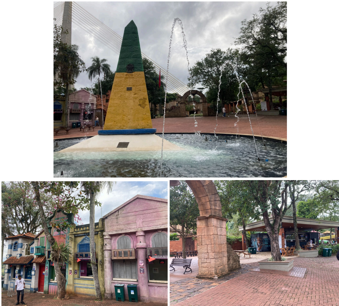
Figura 9 - A segunda praça, ou praça principal, com o obelisco e a praça de alimentação

Brasil - Paraguai - Argentina” 7 , se apresenta como um mapa, para indicar onde a pessoa está geograficamente a partir dos rios, marcos e referenciais da cidade de Foz — como a Itaipu, as pontes, da Amizade e da Fraternidade e as Cataratas. À direita do obelisco, encontra-se uma sequência de barracas de comida que se distribuem lado a lado, oferecendo pratos variados. À esquerda do pórtico, há outro espaço, uma espécie de trailer, também voltado para venda de bebidas e alimentos.