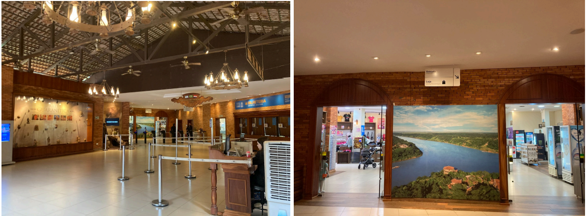
Figura 5 - Saguão da bilheteria e entrada para o parque temático pela loja

antecipação do consumo à vivência. Camisetas, chaveiros, canecas, ímãs e produtos que trazem imagens que “traduzem a fronteira” são oferecidos como formas de “lembrança” de algo ainda não experienciado.