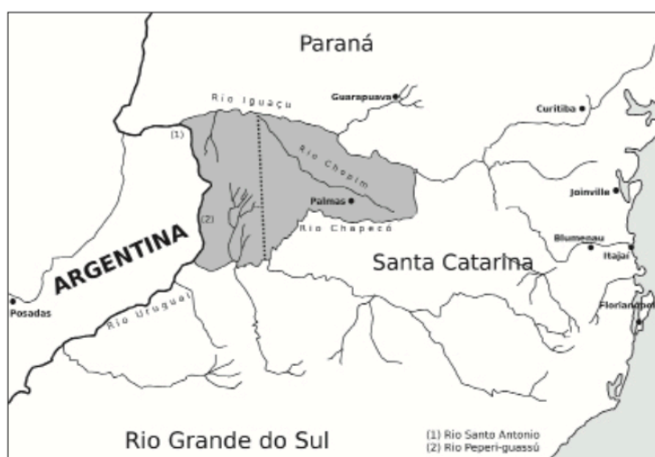
Figura 12 – Mapa do território litigioso entre Brasil e Argentina (em cinza) e proposta da divisão. A linha pontilhada representa o Tratado Bocaiúva-Zebalos (1890)

Em consequência direta às tentativas de consolidação do Tratado de Madri, eclode as Guerras Guaraníticas (1753–1756). Como afirmam Capilé e Vergara (2014), os confrontos da Guerra Guaranítica impediram o sucesso da primeira comissão de demarcação da fronteira. Somente após o fim do conflito, em 1759, organizou-se uma nova expedição para dar sequência às novas tentativas de delimitação. Devido às resistências e dificuldades da demarcação, assim como a incapacidade de Portugal e Espanha de cumprir cláusulas propostas no Tratado de Madri (O Tratado [...], 2018), este é anulado pelo Tratado do El Pardo (1761).