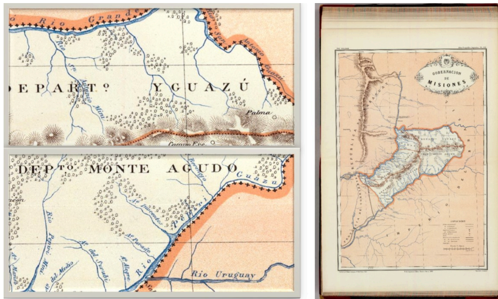
Figura 13 – Mapa Gobernación de Misiones, 1888

Fonte: Elaborado por Paz Soldan, Mariano Felipe, 1821-1886 12