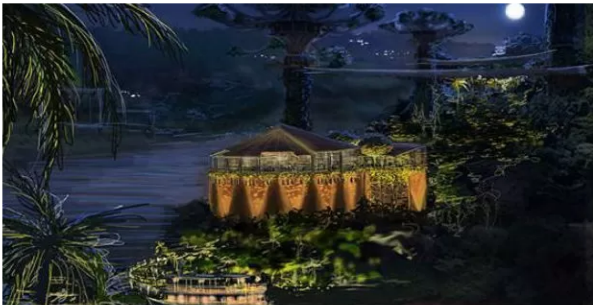
Figura 20 – Espaço das Américas à noite - revitalização total da instalação - imagem projeto conceitual