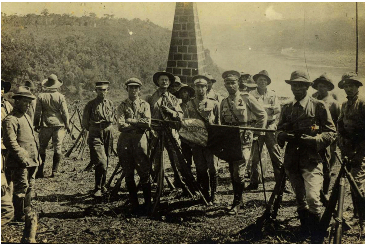
Figura 16 – As tropas revolucionárias ocupam Foz do Iguaçu