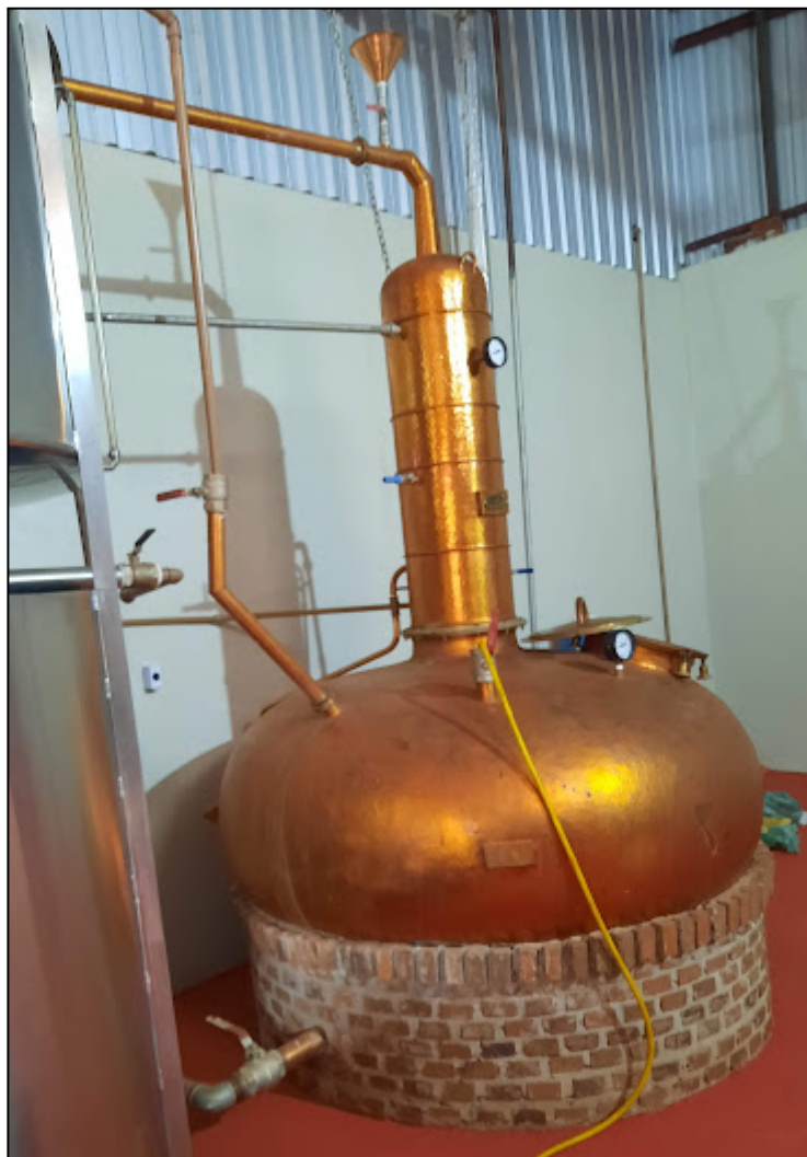
Fotografia 6 – Cebolão utilizado para destilação do caldo de cana