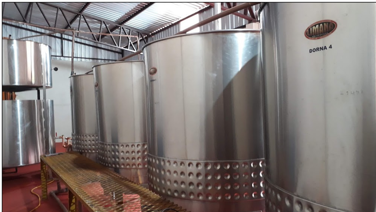
Fotografia 5 – Dornas utilizadas para fermentação do caldo da cana