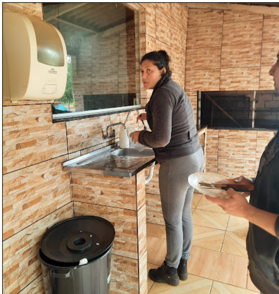
Fotografia 12 – Trabalhadora da COPAVI lavando seu prato após o almoço

A prática de lavar a louça após cada refeição é altamente valorizada na COPAVI, contando com a participação de todos para a preservação de um ambiente limpo e organizado.