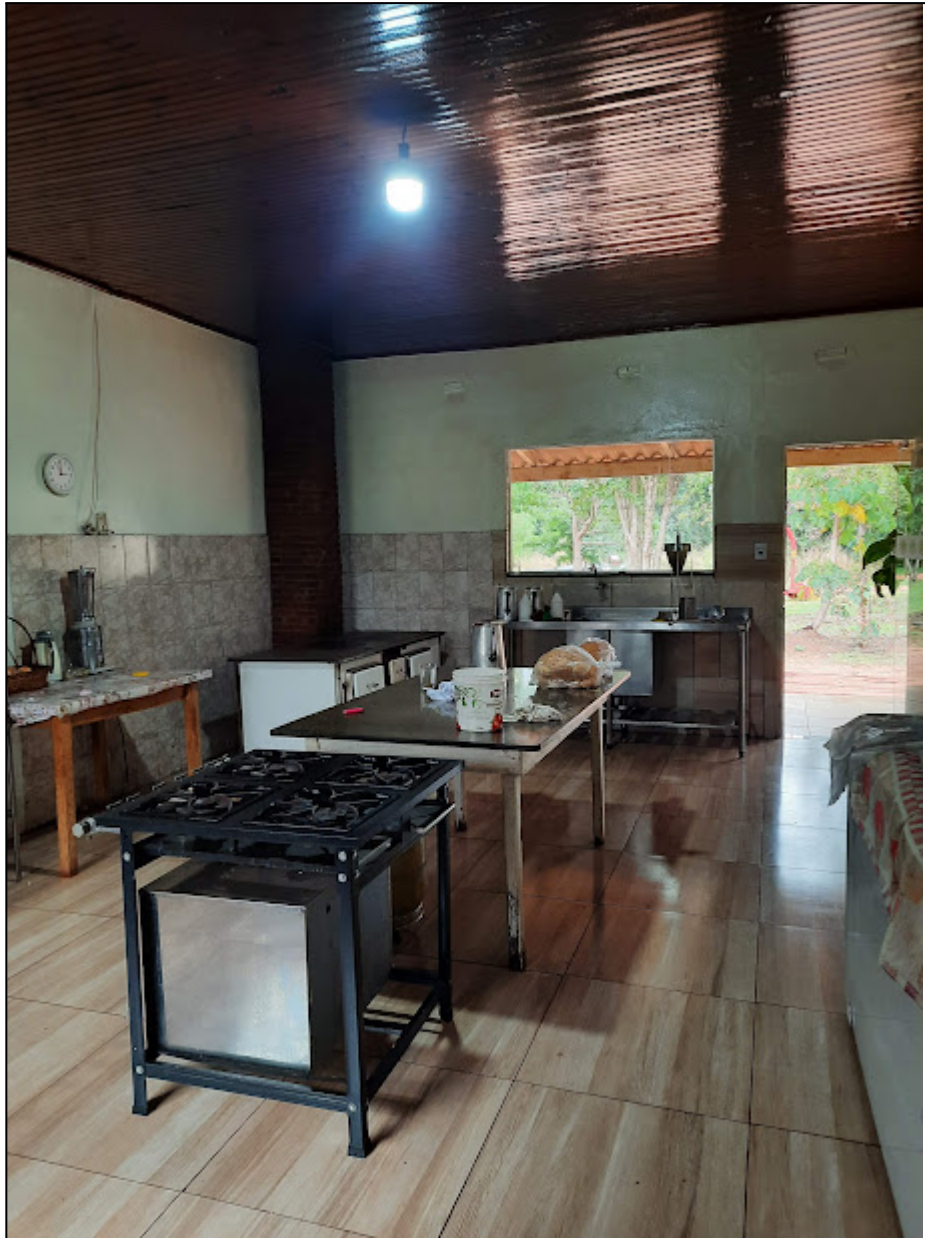
Fotografia 2 – Cozinha do Refeitório Coletivo do Assentamento Santa Maria