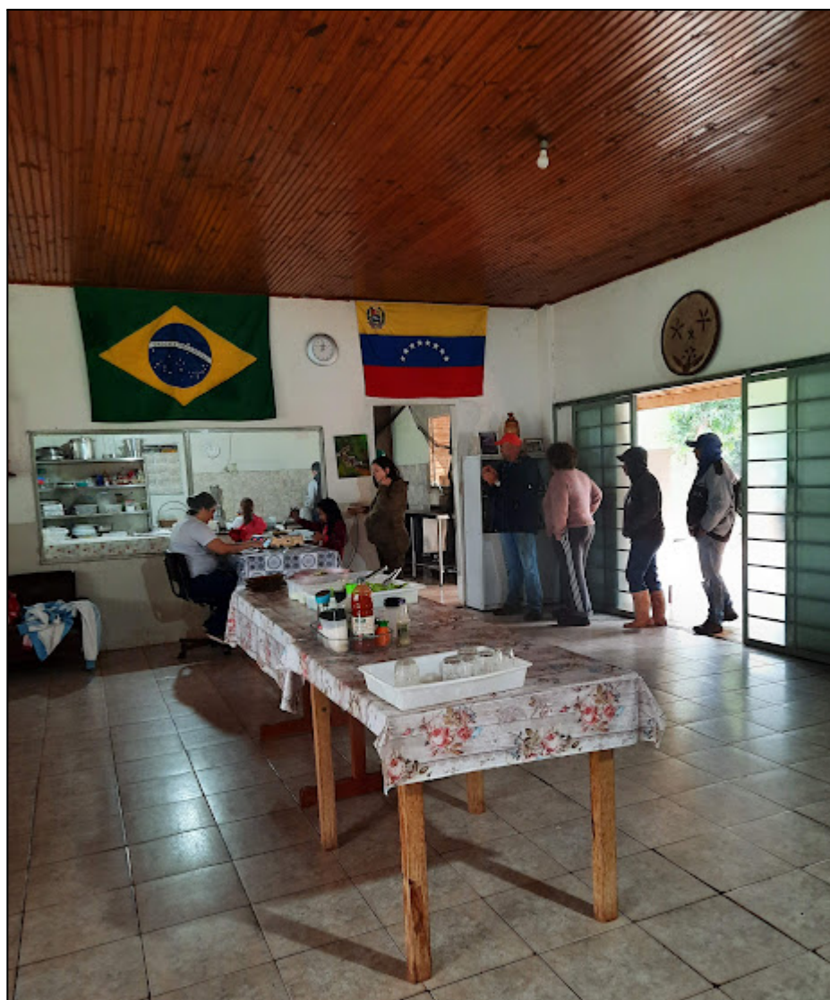
Fotografia 10 – Trabalhadores da COPAVI alinhados em fila para o almoço.

Após a visita ao setor industrial, fez-se uma pausa para participação do almoço no Refeitório Coletivo. A fotografia 10 mostra os trabalhadores da COPAVI em fila, aguardando para se servir.