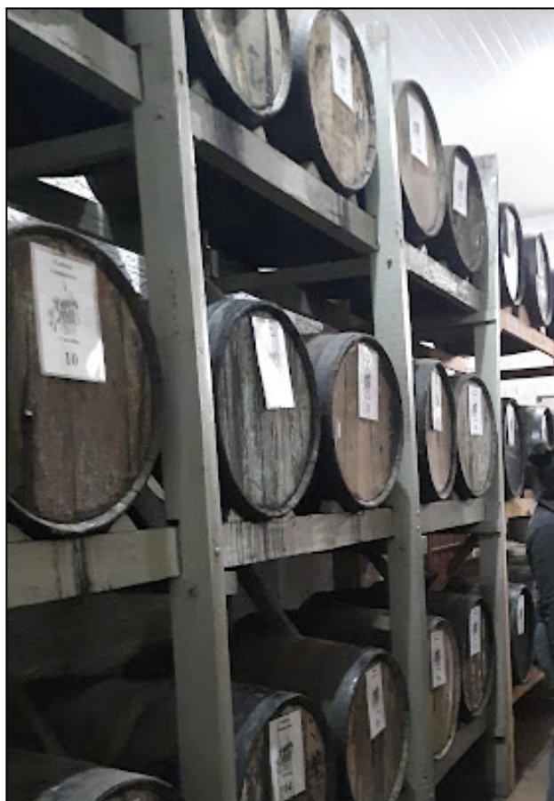
Fotografia 7 – Local de armazenamento dos barris de carvalho, amburana e bálsamo