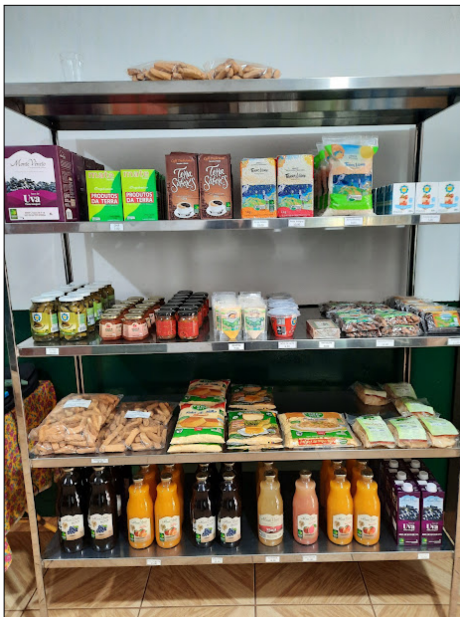
Fotografia 17 – Prateleira de produtos da Reforma Agrária vendidos na loja da COPAVI