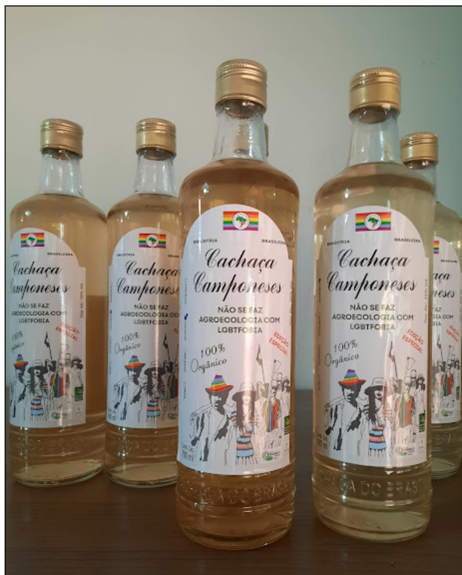
Fotografia 9 – Edição especial de cachaça da COPAVI em combate à LGBTFobia

A fotografia 9 apresenta a embalagem da edição especial da cachaça Camponeses, desenvolvida em colaboração com o Coletivo LGBTQIA+ (Lésbicas, Gays, Bissexuais, Transexuais, Queer, Intersexo, Assexuais e +) do MST.