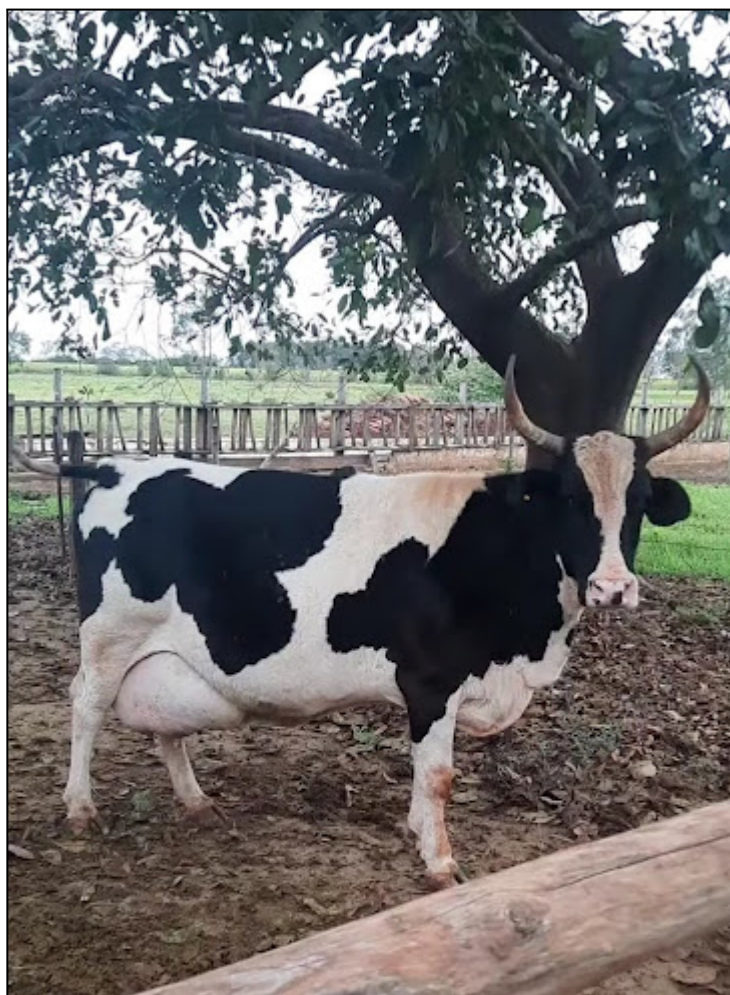
Fotografia 18 – Vaca em fase de lactação aguardando a ordenha

determina equipes responsáveis pela ordenha matinal e outra equipe responsável pela ordenha vespertina. A escala também é aplicada para a horta e as vendas.