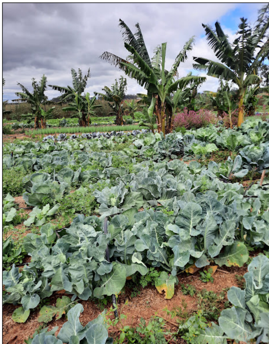
Fotografia 13 – Plantação de couve do setor de Horta e Sustento

Durante a visita ao setor de Horta e Sustento, ocorreu uma conversa com a responsável por essa área. Ela detalhou o funcionamento da horta, explicando a dinâmica de plantio, e ressaltou a escassez de mão de obra atualmente. No momento, o trabalho nesse setor conta com o apoio de quatro mulheres, um homem e a participação dos adolescentes, que estão sendo integrados à área produtiva da cooperativa. Esses jovens iniciam sua trajetória no setor da horta, cumprindo uma carga horária de meio período (4 horas) diariamente.