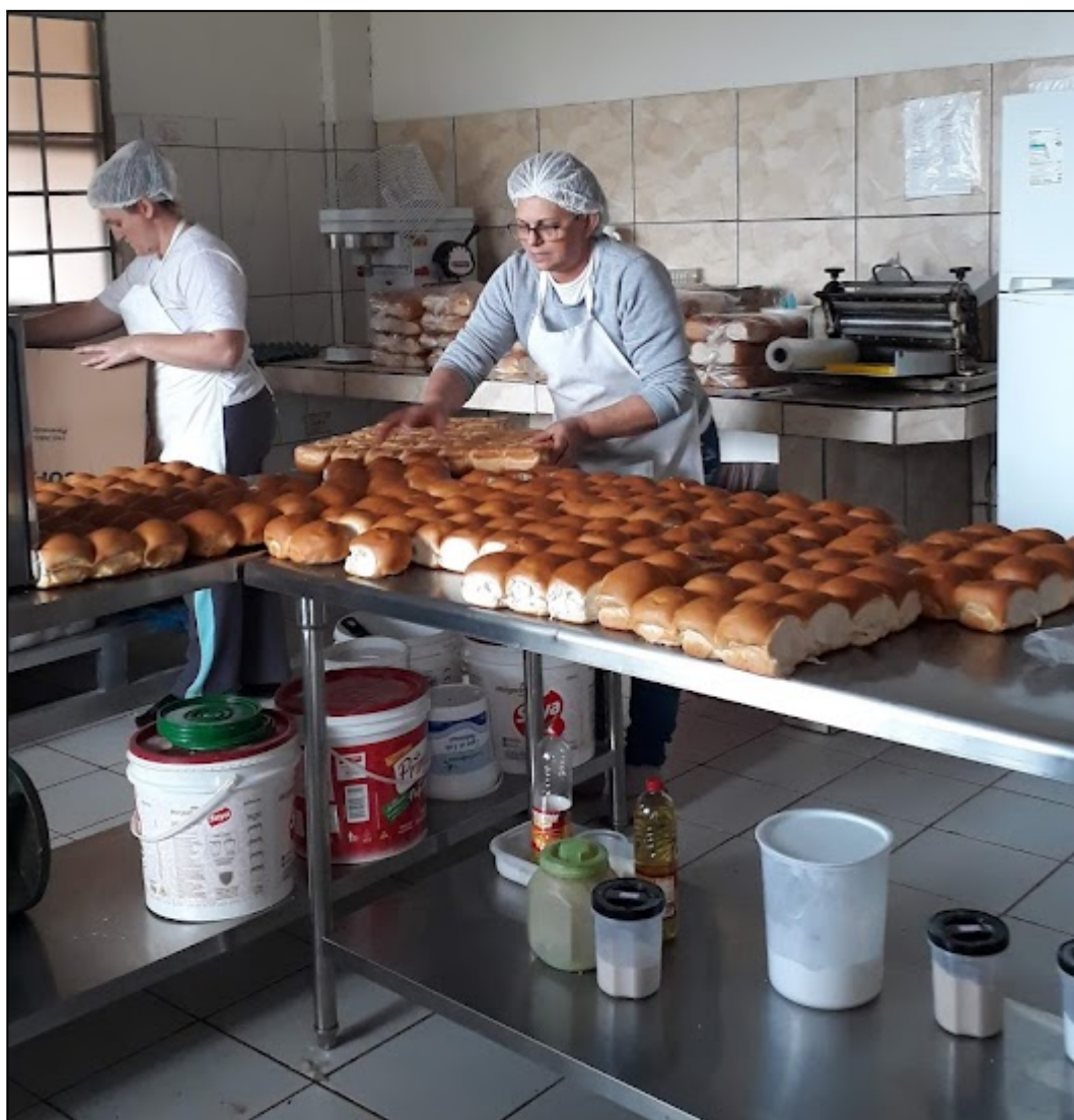
Fotografia 16 – Confeção de pães na padaria da COPAVI

Além dos produtos mencionados, há um espaço dedicado à venda de itens provenientes de outros assentamentos, como café, chás, diversos sucos, arroz, creme de leite, temperos, pepino em conserva, molho de tomate, banana-passa, doce de leite e farinha de milho. É importante ressaltar que todos os alimentos comercializados no Assentamento Santa Maria são certificados como orgânicos pela Rede Ecovida.