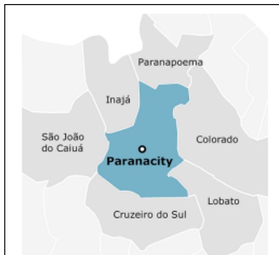
Figura 2 – Limites da cidade de Paranacity — PR

Paranapanema, Colorado, Lobato, Cruzeiro do Sul, São João do Caiuá e Inajá (Figura 2).