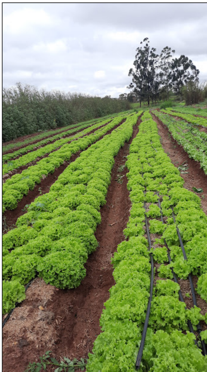
Fotografia 14 – Cultivo de alface do Assentamento Santa Maria

Após o período da pandemia do COVID-19 (nos anos de 2020 e 2021), houve um considerável aumento na demanda por produtos provenientes da horta no município de Paranacity. Como resultado, a necessidade de mão de obra nesse setor também cresceu significativamente. Atualmente, o trabalho está sendo realizado aos sábados, a fim de suprir a demanda e garantir a entrega dos produtos para a merenda escolar. São destinados 200 quilos de alface por semana para atender à prefeitura.