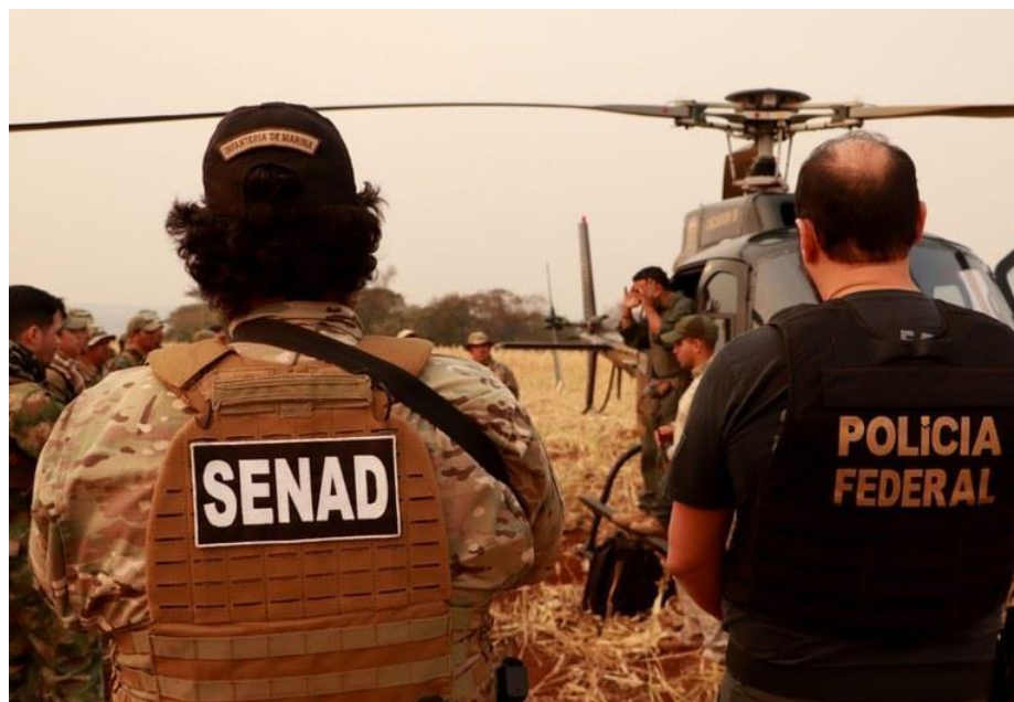
FIGURA 5: Secretaria Nacional Antidrogas do Paraguai e Polícia Federal PF