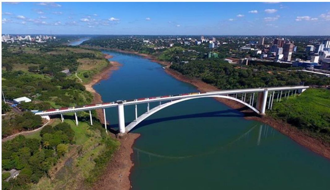
FIGURA 1 – Ponte da Amizade