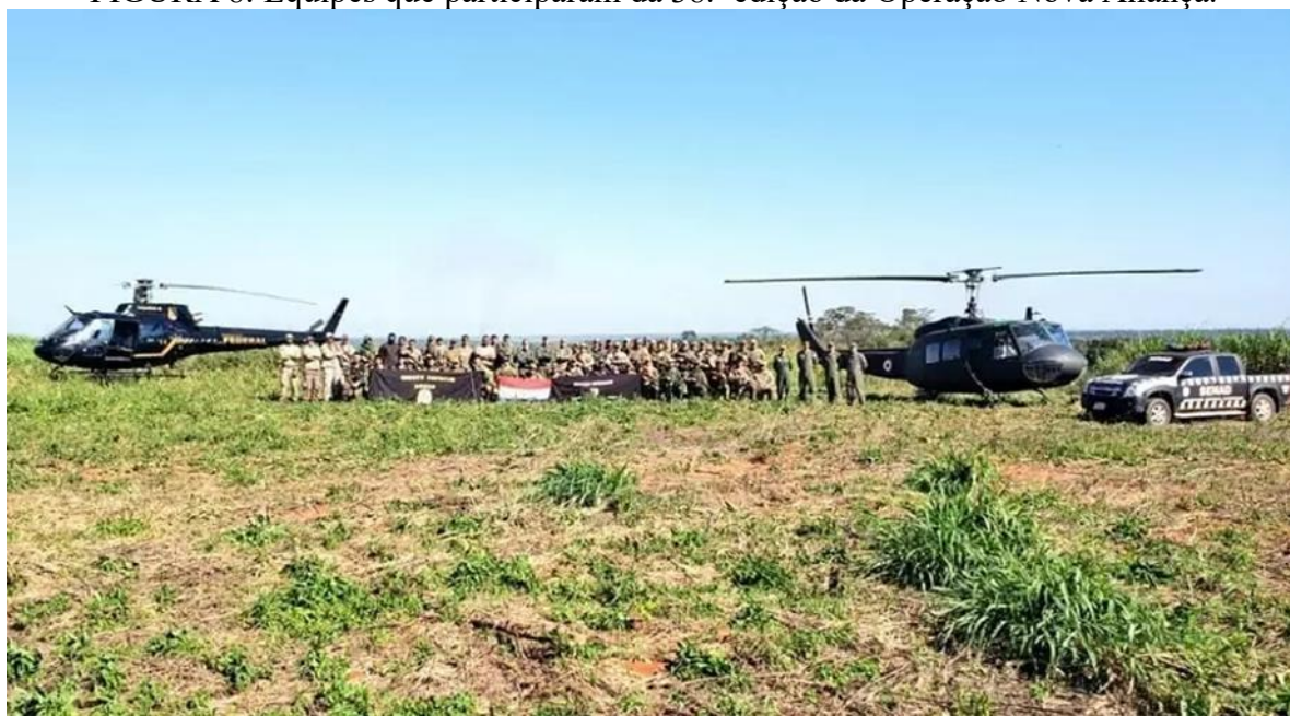
FIGURA 8: Equipes que participaram da 38. a edição da Operação Nova Aliança.

Segundo dados do Escritório das Nações Unidas sobre Drogas e Crime (UNODC), o Ministério de Justiça e Segurança Pública do Brasil (2024) destacou que “apenas no ano de 2024, em cinco etapas realizadas, a Operação Nova Aliança já erradicou quase 4 mil toneladas da droga, aproximadamente 80% do que se apreende anualmente em operações policiais realizadas em todo o planeta”