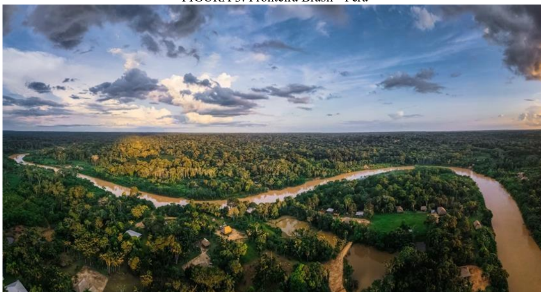
FIGURA 3: Fronteira Brasil - Peru

4