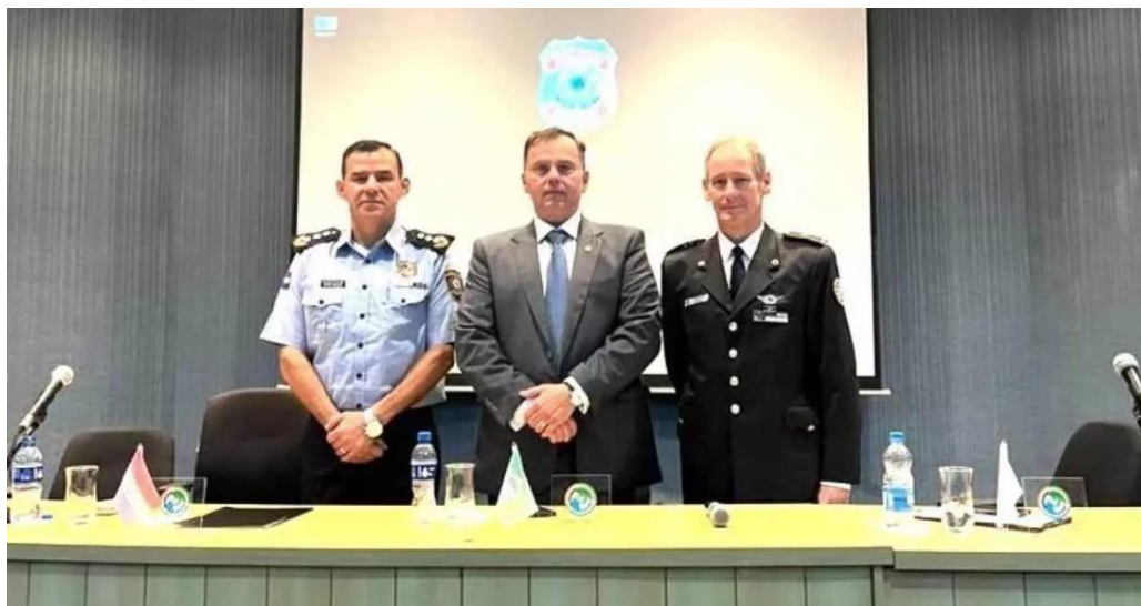
FIGURA 4 - Dirigentes de forças de segurança do Paraguai, Brasil e Argentina.

Um dos principais motivos da escolha de Governança como conceito fundamental é o fato de que, nela, a análise vai além da questão colaborativa entre governos, como pode ser visto na imagem abaixo: