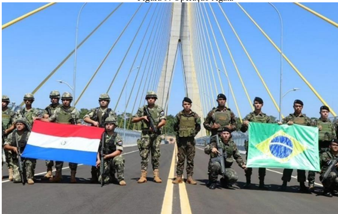
Figura 9: Operação Ágata