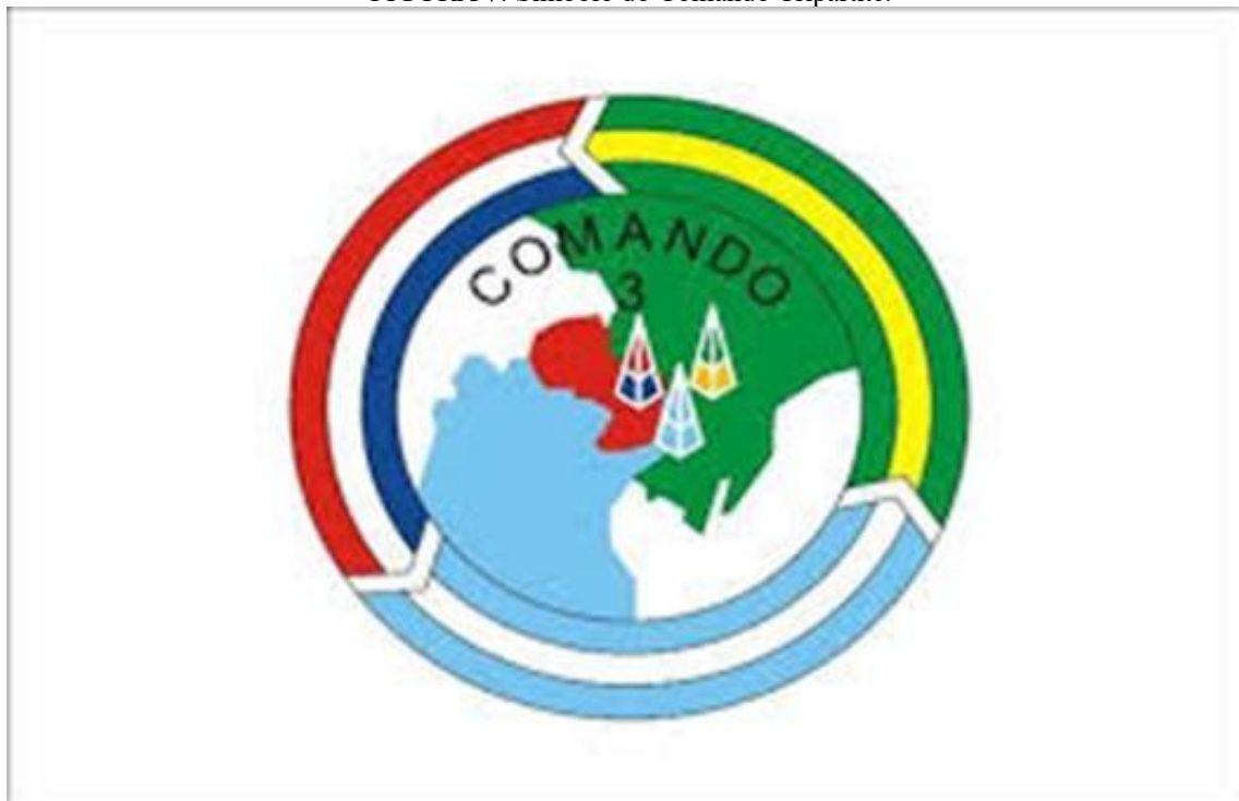
FIGURA 7: Símbolo do Comando Tripartite.