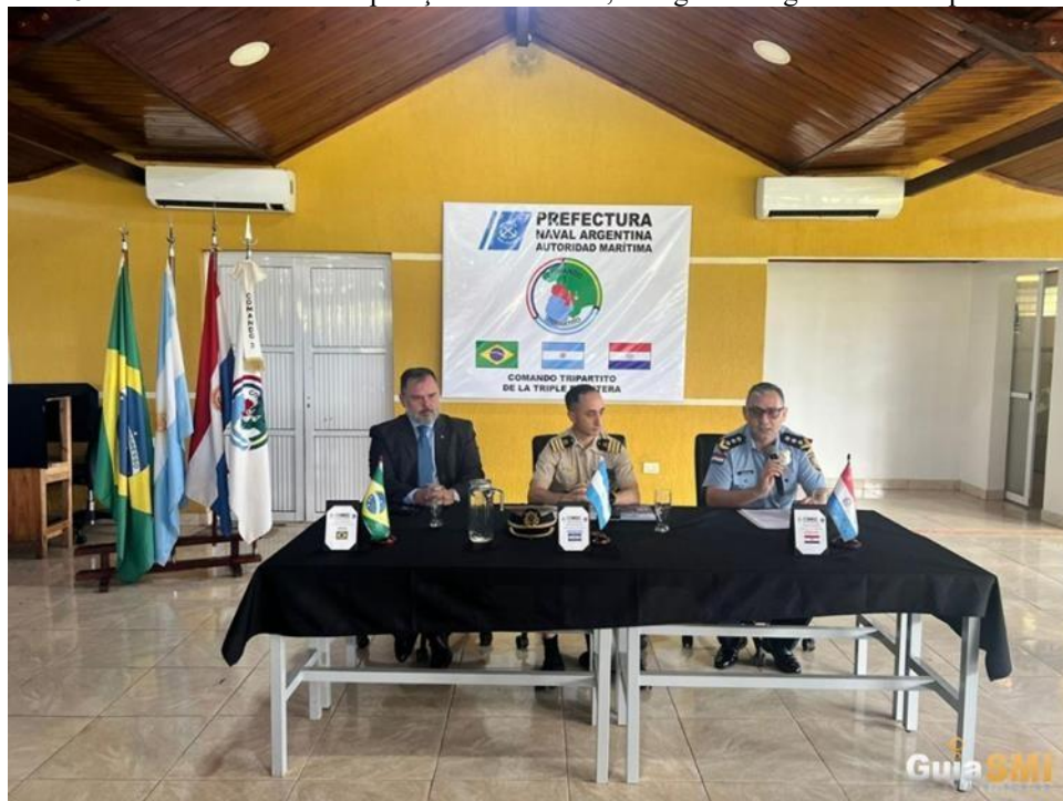
FIGURA 6: Encontro fortalece cooperação entre Brasil, Paraguai e Argentina na Tríplice Fronteira.

Um dos principais exemplos dessa articulação é o Comando Tripartite, uma estrutura criada para fortalecer o intercâmbio de informações e a integração operacional entre as polícias dos três países. A imagem a seguir ilustra essa cooperação, destacando um encontro recente que reafirma o compromisso das autoridades em atuar de maneira coordenada na região.