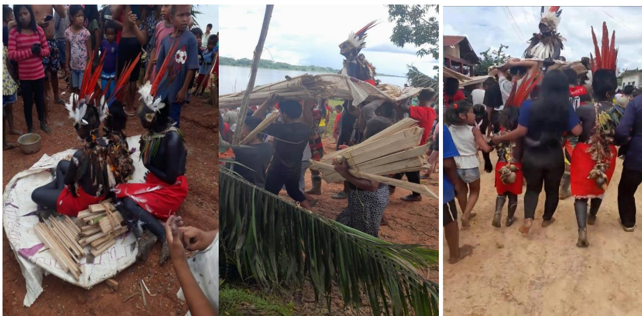
Fotografia 3: Moça nova (Worecü) é levado pelo rio, Aldeia Bom Caminho-AM (ritual)

Fonte: Imagem 2 frontal e versos. 1, 2 e 3 As moças e uma criança pronto para tirar toda impureza do corpo e jogar a casa da moça o (Turi) e todos os desnecessários instrumentos no rio. Nekinha Coelho; 3 de janeiro de 2021