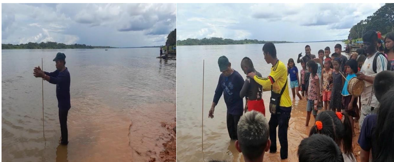
Fotografia 4: O Yuücü e a moça nova no rio Alto Solimões- AM, O feiticeiro (Yuücü) apresentando nestas duas imagens abaixo; fazendo seu trabalho de proteção.