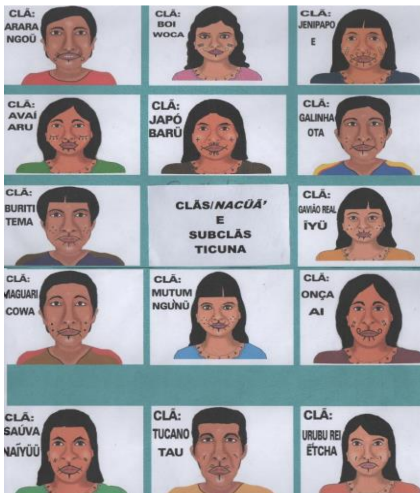
Figura 3. Classificação dos clãs

Fonte: Ilustração confeccionada por Elias Ticuna (2020). Fonte: Maria Auxiliadora Pinto, 2020. Recuperado em: 26 agosto de 2023