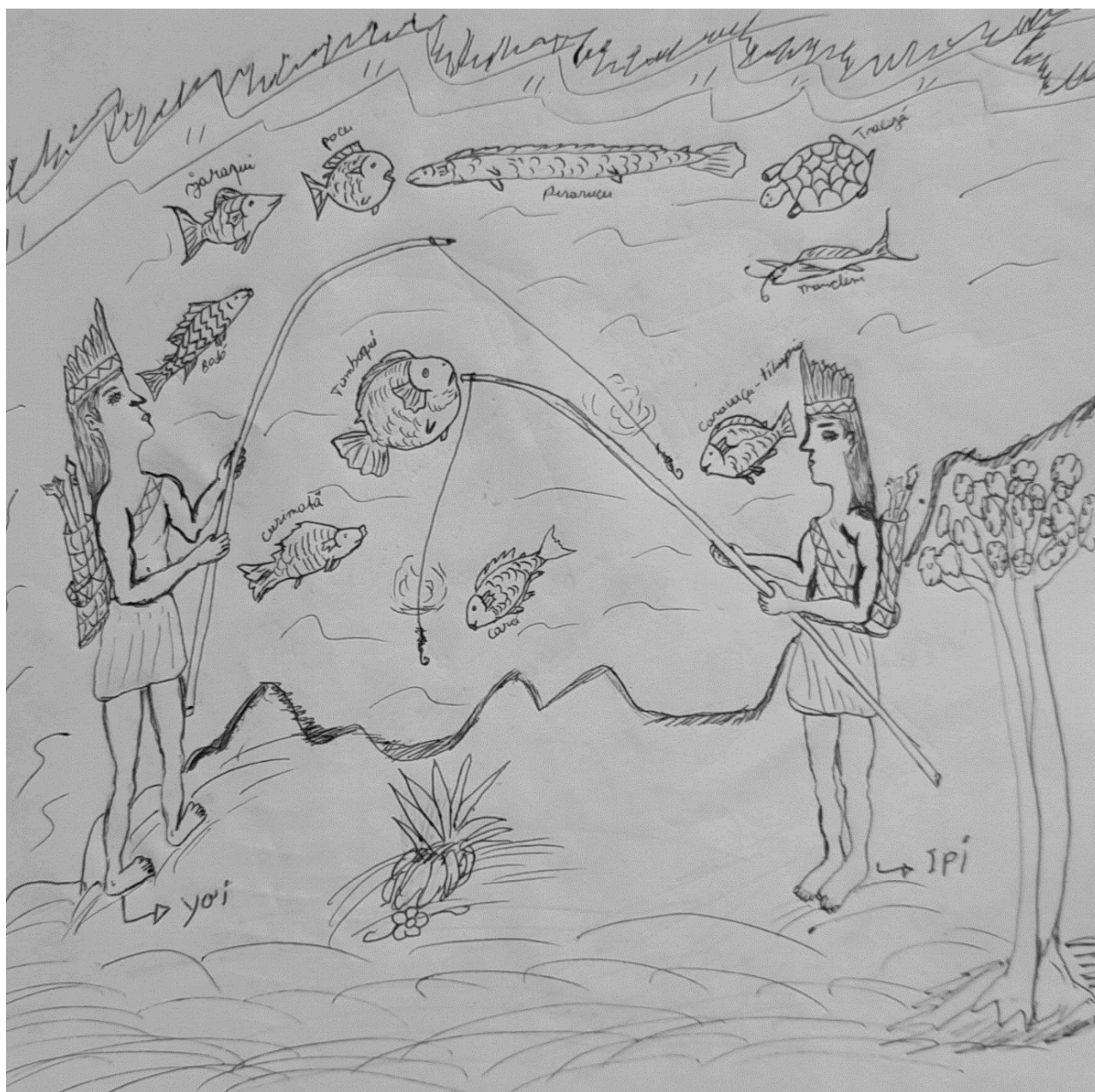
Figura 2. Uma ilustração de Yo'i e Ipi pescando seu povo “Magüta” no rio.

Fonte: Ilustração da autora (Coelho, 2023).