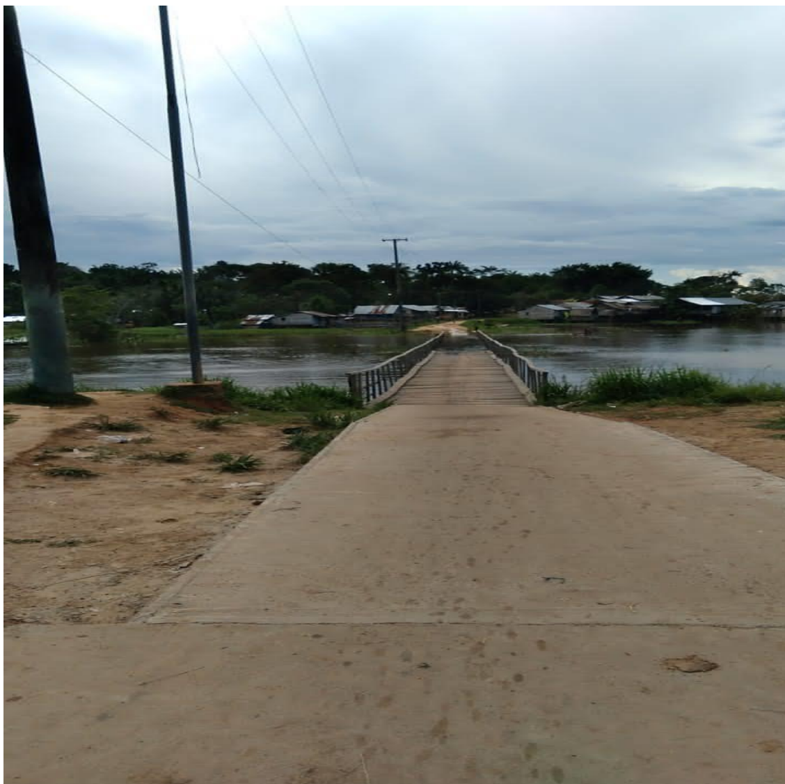
Figura 4: Figura mostrando a ponte de comunidade indígena de Filadelfia, pertence aos municípios de Benjamin Constant, no Estado de Amazonas, Brasil.

Fonte: Imagem Ponte Filadélfia, ponte de madeira; foto Nekinha Coelho; quarta-feira 21 de abril de 2021.