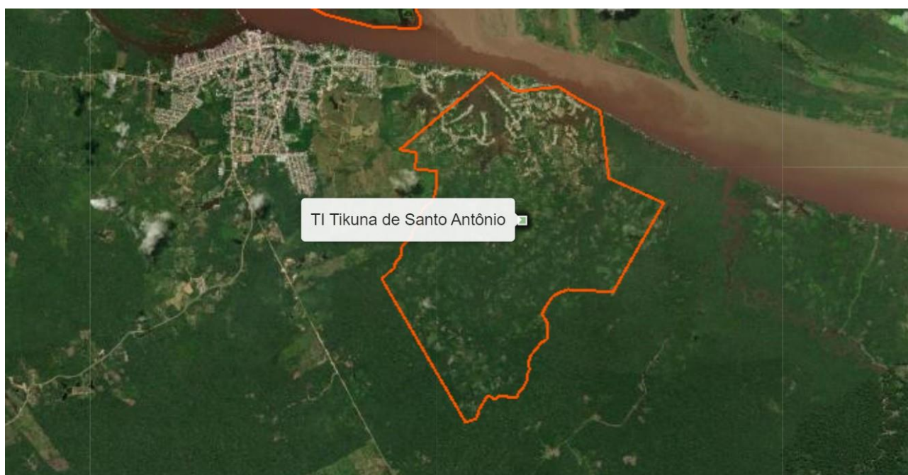
Figura 6: Terra Indígena Magüta de Santo Antônio