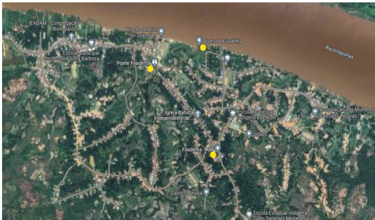
Figura 5: Os pontos marcados com amarelo é a ponte e porto e o centro da Comunidade Indígena de Filadélfia e Benjamin Constant, no rio Alto Solimões, Estado de Amazonas, Brasil.