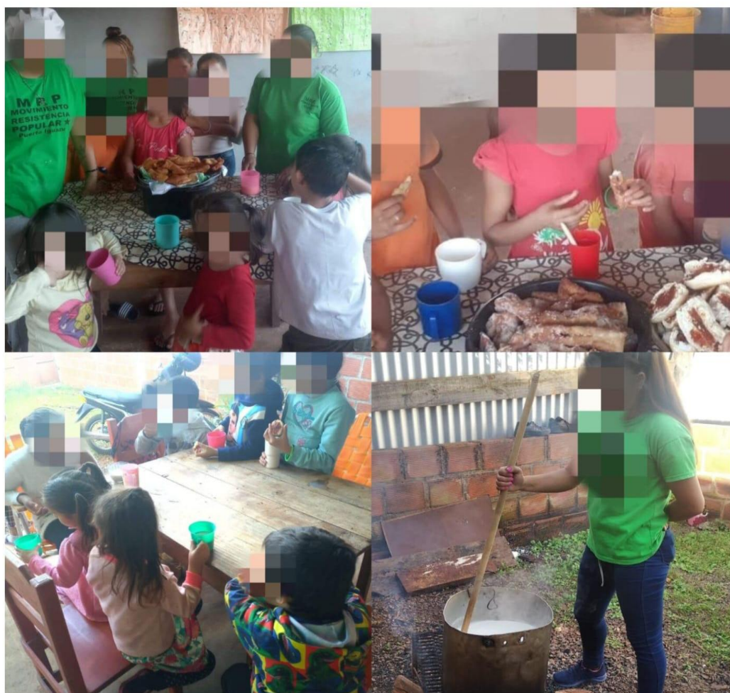
Figura 7. Merienda

En el horario de 14:30 a 16:00 horas tienen el espacio para pintar, para sumar, aprender, crear tarjetas, tiempo de lectura, etc. Los materiales para estudiar provienen de donaciones, como lápices de colores y hojas en blanco o con dibujos para colorear.