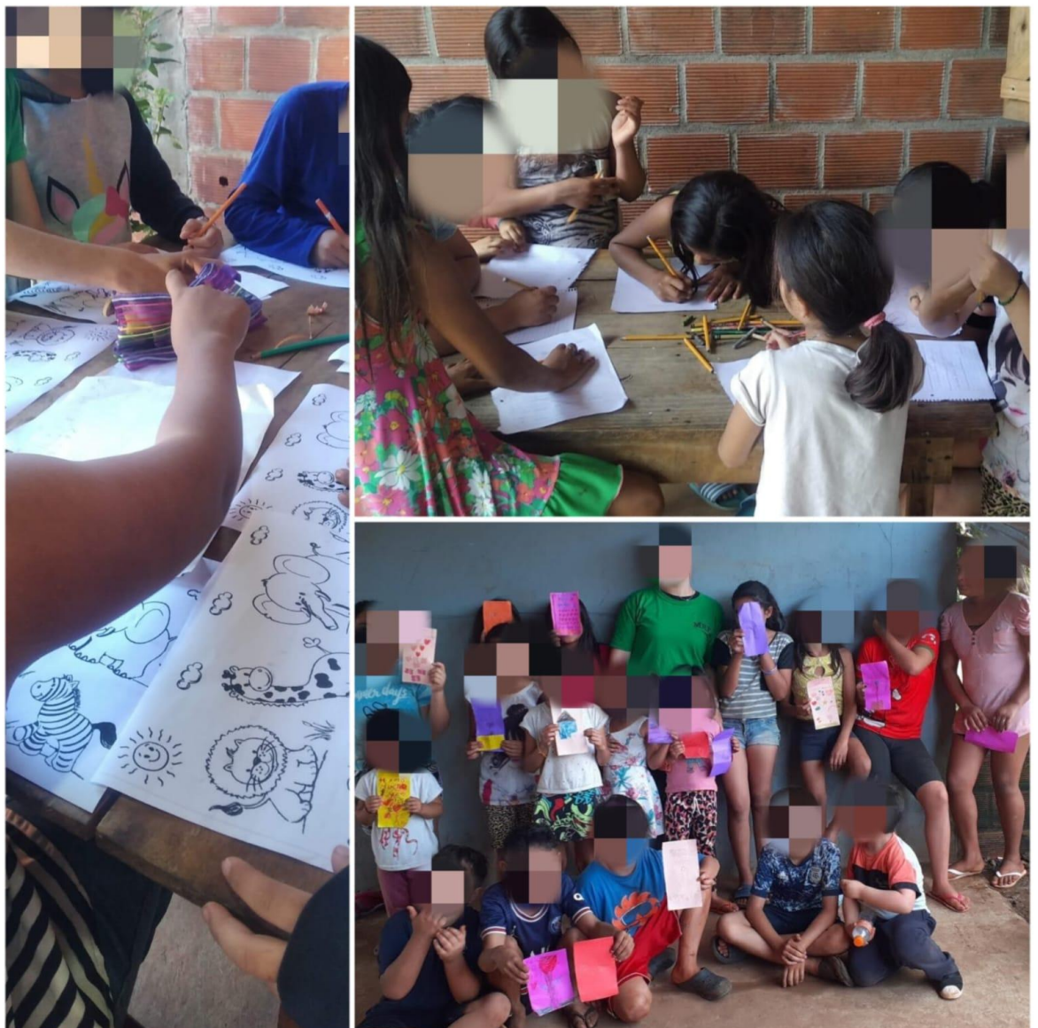
Figura 6. Escuelita