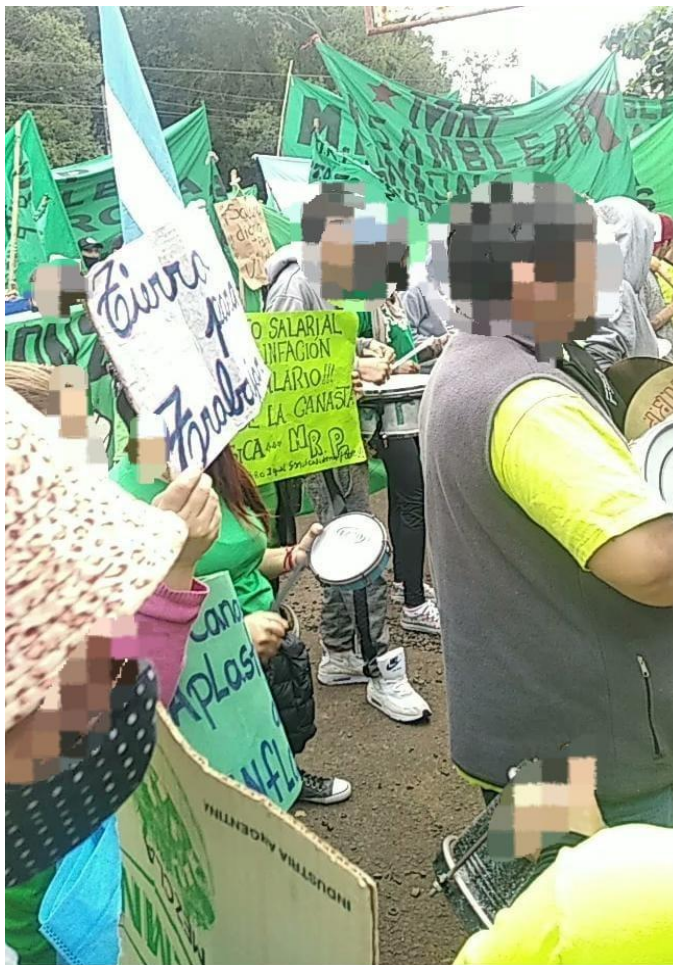
FIGURA 2. “Marcha” del MRP

Fuente: fotografía propia de la autora. Diciembre 2022.