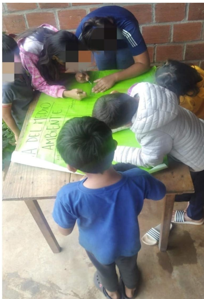
FIGURA 4. Día del Ambiente