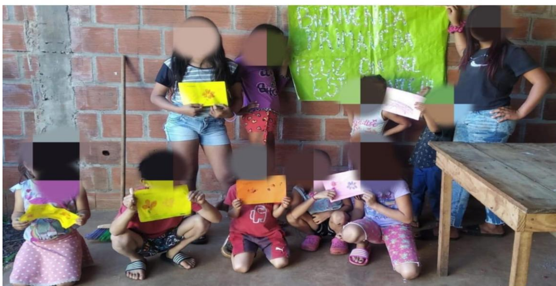
Figura 5. Bienvenida primavera y feliz día del estudiante.