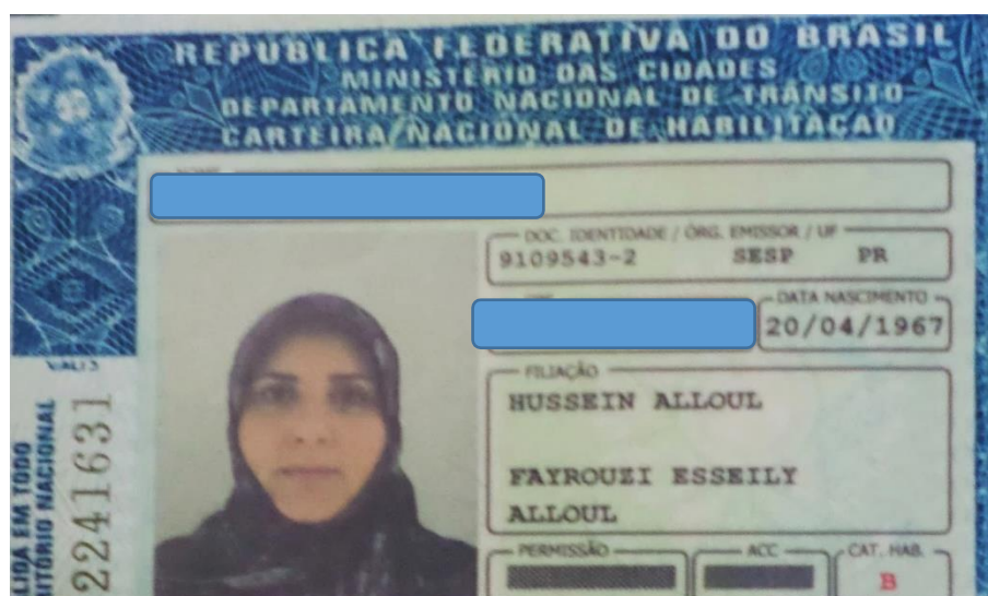
Imagen 3 - Reivindicación del velo en las políticas de Foz do Iguaçu

En este momento de la entrevista se nombra el término de “lucha” con cautela de parte de la entrevistada, se pronuncia, pero no de forma negativa, sino como una manera de entender que hay que respetar los derechos, donde acá entrarían los religiosos, la cuestión del velo hizo con que la SBI buscara y ayudara a las mujeres de NSF con los contactos gubernamentales de Foz do Iguaçu donde ellas pudieran expresar y argumentar esta situación y reivindicar sus derechos de poder viajar e ir a cualquier parte sin tener que quitar en ninguna parte, ni en ninguna institución del estado el velo.