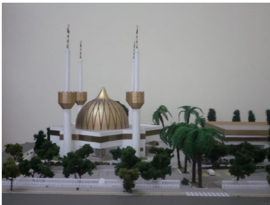
Imagen 2 - Ejemplo de auto reafirmación de la identidad

Es importante destacar: La identidad religiosa y la concepción de cultura que se tiene desde el punto de vista de esta sociedad específica.