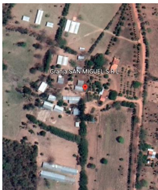
Figura 1 - Localização da propriedade.