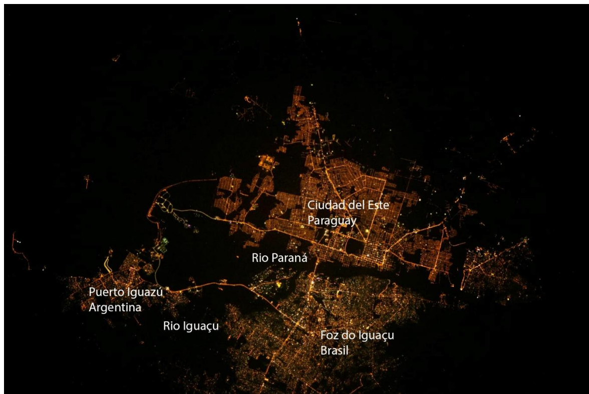
Figura 1 – Tríplice fronteira vista do espaço; printscreen da página oficial da Prefeitura Municipal de Foz do Iguaçu no Facebook