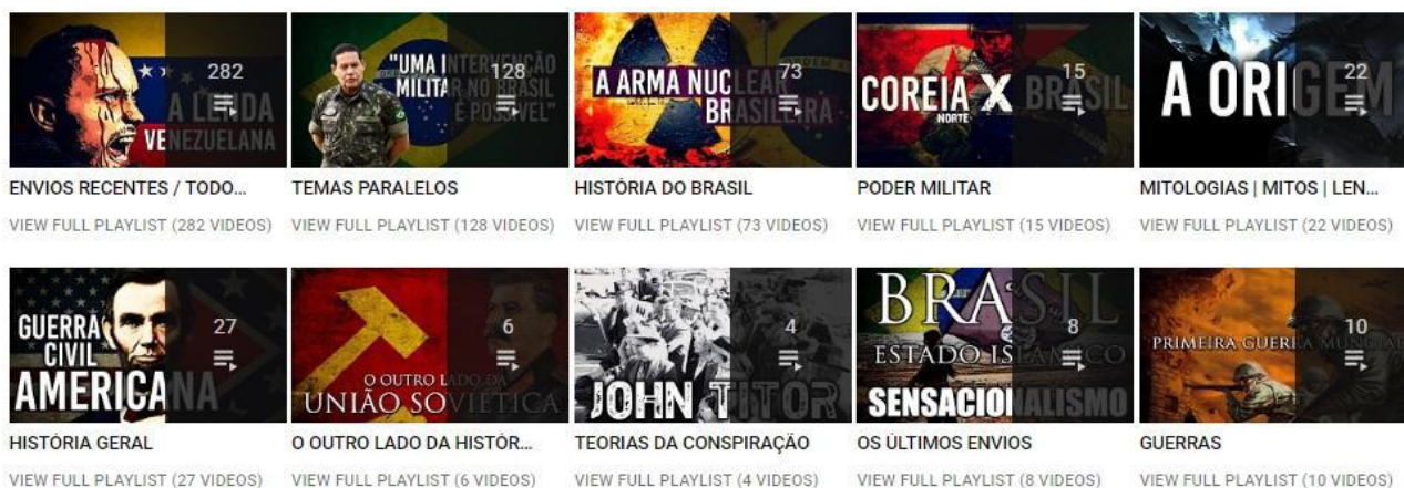
Figura 4. Organização dos vídeos “Vamos Falar de História?”.

O canal estrutura seu conteúdo entre dez blocos de vídeos, separados por temáticas, sendo elas: Envios Recentes / Todos os Vídeos (282 vídeos), Temas Paralelos (128 vídeos), História do Brasil (73 vídeos), Poder Militar (15 vídeos), Mitologias | Mitos | Lendas (22 vídeos), História Geral (27 vídeos), O Outro Lado da História (06 vídeos), Teorias da Conspiração (04 vídeos), Os Últimos Envios e Guerras (10 vídeos). Como se observa na Figura 4.