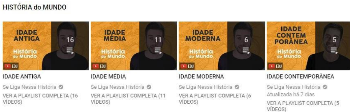
Figura 2. Organização dos vídeos “História do Mundo”

O “Se Liga Nessa História” também oferece um curso online pago chamado “Quarentena Humanas”, acessado por meio de um site que leva o mesmo nome do canal. O curso volta-se para os vestibulares e para o ENEM 10 . O canal e o curso contam com aulas de Sociologia, Filosofia e Geografia. Porém, o canal divide as aulas de História em dois blocos, sendo que o primeiro é denominado como “História do Mundo”. O qual 38 vídeos se ramificam, em quatro pequenos blocos: Idade Antiga (16 vídeos), Idade Média (11 vídeos), Idade Moderna (06 vídeos) e Idade Contemporânea (05 vídeos), como se observa na Figura 2: