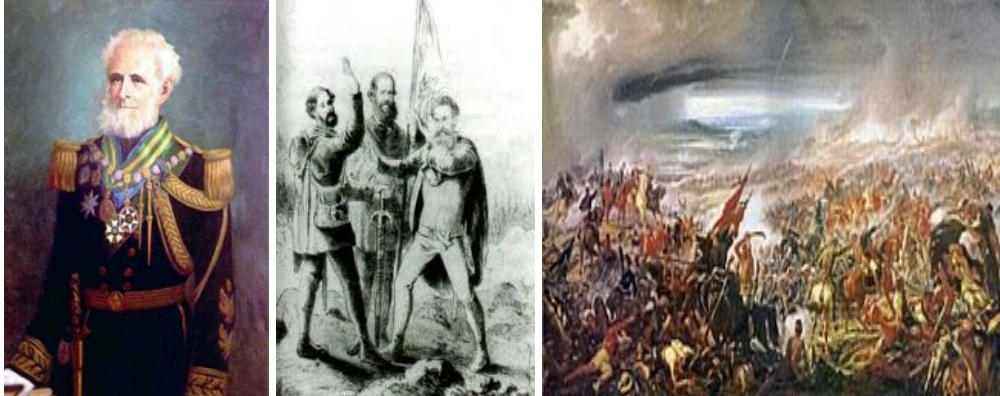
Representações do livro de Gilberto Elias Salomão (2013)

interpretação sobre as imagens, sobre o que representam, diferentemente da proposta do livro da FTD que será visto no próximo tópico.