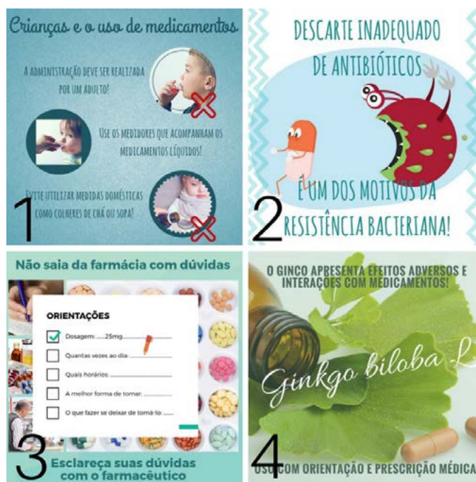
Figura 02 – Exemplos de peças gráficas já utilizadas nas publicações da página do Facebook do programa de extensão Cuidando da Farmácia Caseira da UFCSPA nos tópicos uso racional de medicamentos (1 e 3), guarda e descarte de medicamentos (2) e uso correto de plantas medicinais e fitoterápicos (4).

Além do importante papel na promoção de saúde, o desenvolvimento da página do Facebook contribui na formação dos bolsistas de extensão envolvidos, preparando-os para selecionar informações relevantes, organizá-las, redigi-las e divulgá-las de forma clara para a população leiga. Desenvolvendo, assim, habilidades essenciais para papel primordial de educador em saúde de qualquer profissional de saúde.