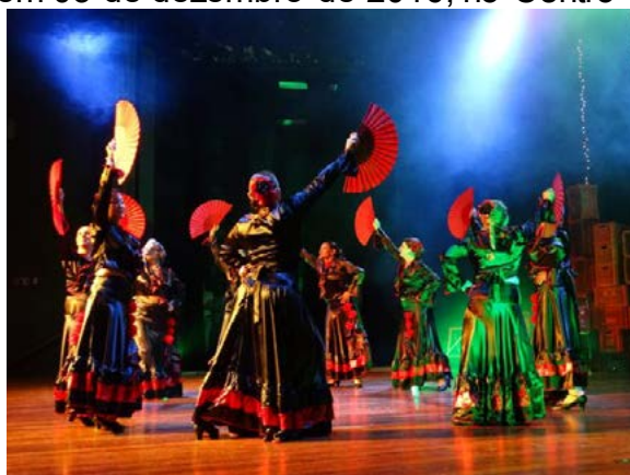
Figura 06 – Apresentação do grupo Arte Flamenca Senior no espetáculo “Hoje é Arte-feira”, estreado em 03 de dezembro de 2016, no Centro Cultural Vera Schubert