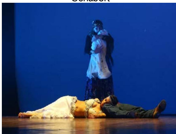
Figura 05 – Apresentação da Cia de Dança IFPR Schubert no espetáculo “Emociones Flamencas”, estreado em 30 de abril de 2016, no Centro Cultural Vera Schubert