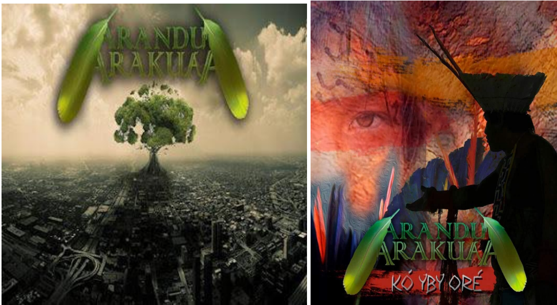
Figura 6: Capa da Demo. Primeira produção da banda (2012) e capa do álbum “Kó Yby Oré” (2013).