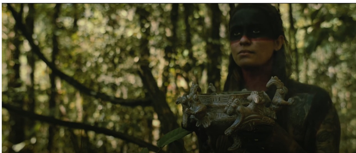
Figura 10: Trecho do clipe “Conipuyaras”.