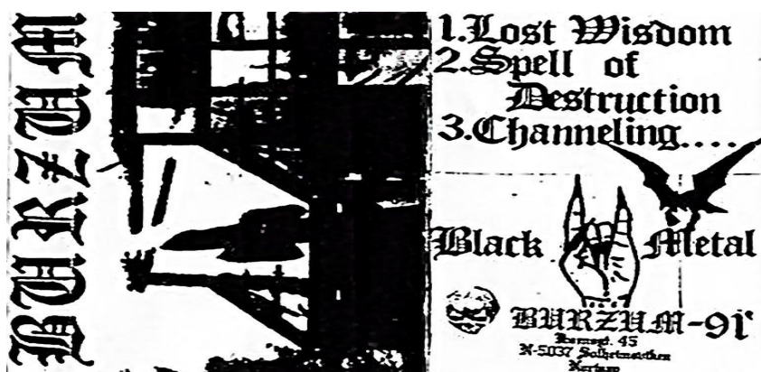
Figura 1: Capa da Demo “Demo I” da banda Burzum (1991).