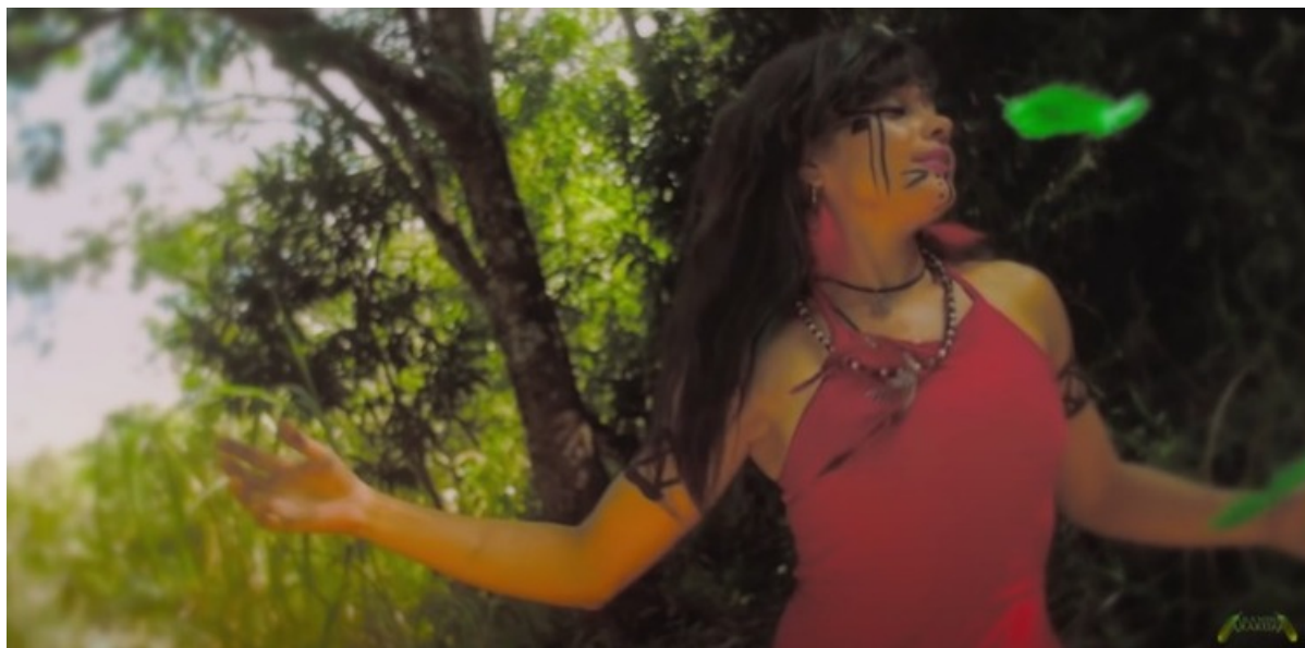
Figura 11 Trecho do clipe “Ïpredu” (2016).