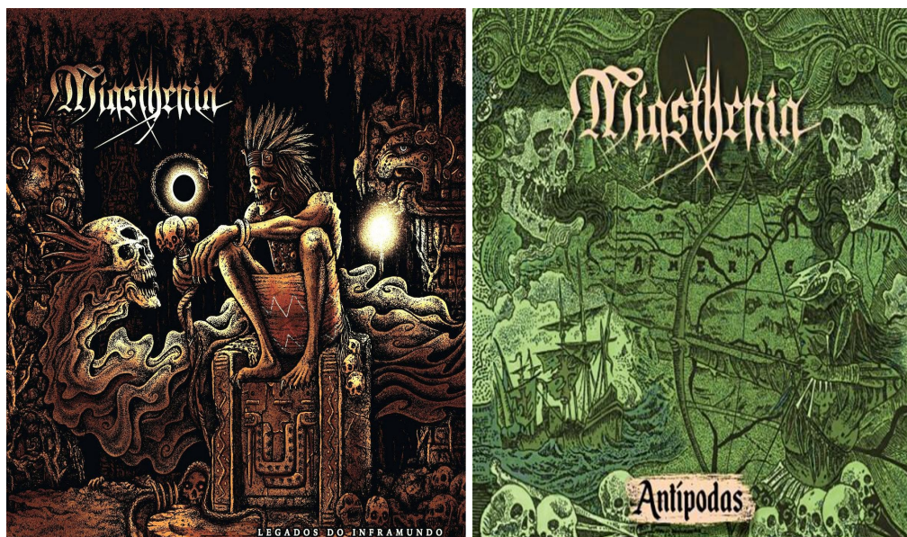
Figura 4: Capas dos álbuns “Legados do Inframundo” (2014) e “Antípodas” (2017)