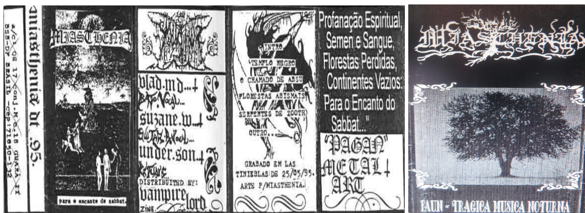
Figura 2: Capas do EP “Para o encanto de Sabbat” (1995) e Split CD “Faun - Trágica Música Noturna” (1998).