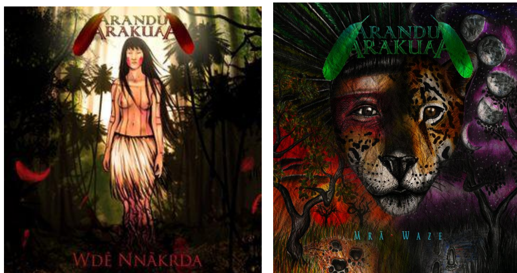
Figura 7: Capa do álbum “Wdê Nnãkrda” (2015) e capa do álbum ”Marã Waze” (2018).