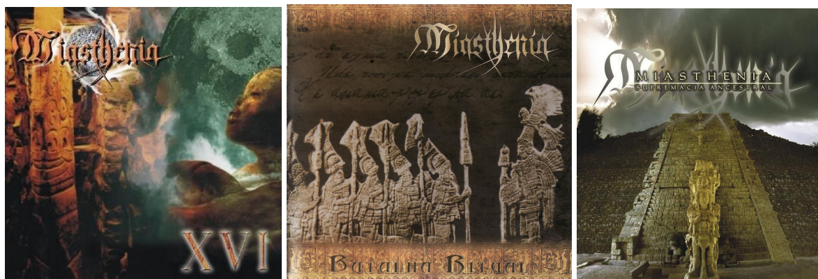
Figura 3: Capas dos álbuns XVI (2000), Batalha Ritual (2004) e Supremacia Ancestral (2008)