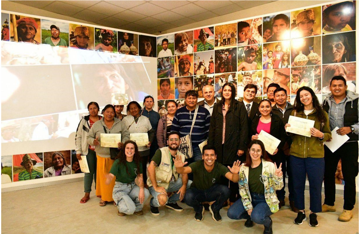
Cierre del evento “Planificadores Turísticos” 28 de septiembre, 2023, en compañía de participantes y organizadores.