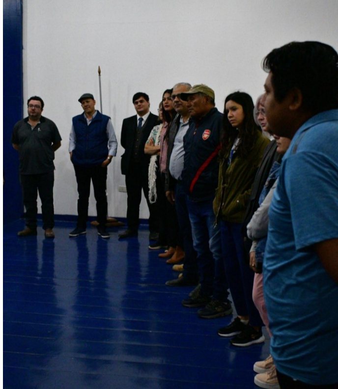
“Planificadores Turísticos” 28 de septiembre, 2023; Centro de Interpretación del Gran Chaco Americano.