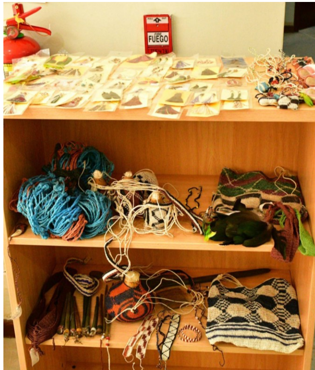
Stand de artesanías hechas por diferentes comunidades, Centro de Interpretación del Gran Chaco septiembre 2023.