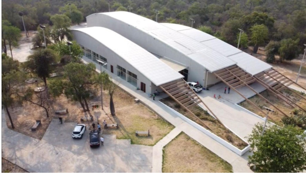
Autoría propia, Centro de Interpretación del Gran Chaco Americano septiembre 2023

Esta infraestructura representa un museo interactivo verdaderamente único en Paraguay, tanto en su concepto como en su formato. Lo que lo distingue es su capacidad para proporcionar una experiencia inmersiva y enriquecedora a los visitantes. En cada parada, se integran recursos materiales y audiovisuales de manera innovadora, lo que permite una comprensión más profunda y envolvente de los diferentes biomas naturales y de los elementos que los componen.