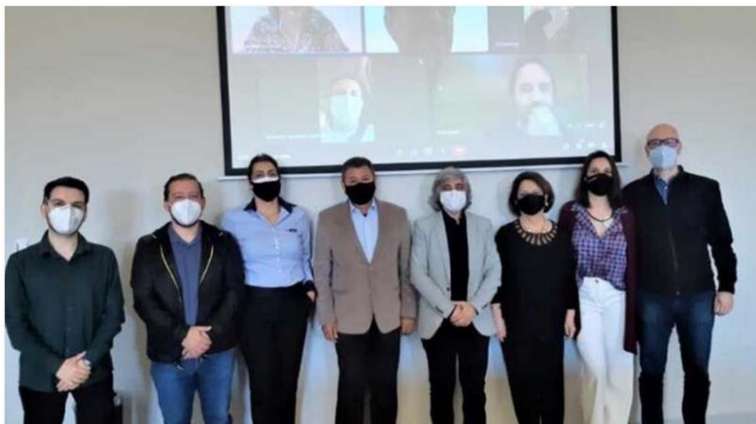
Na nova proposta, o foco das discuss es do projeto ser o as demandas do Codetri - Foto: Divulga o