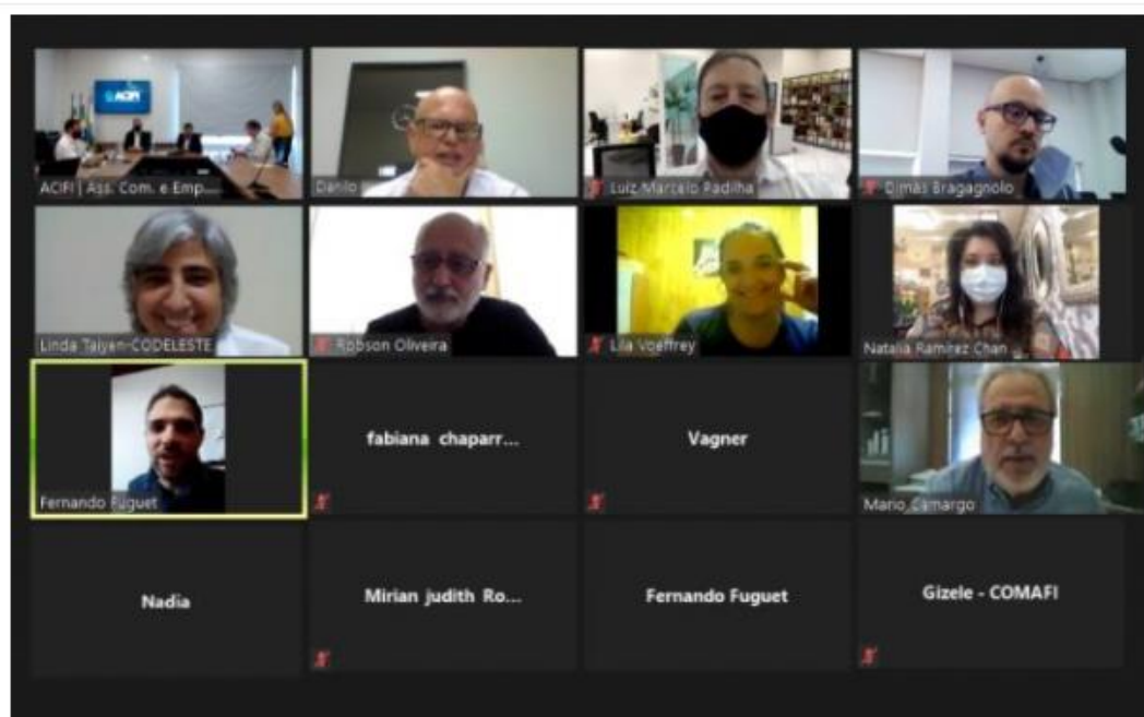
Reunião presencial e virtual do conselho da fronteira – Foto: Divulgação